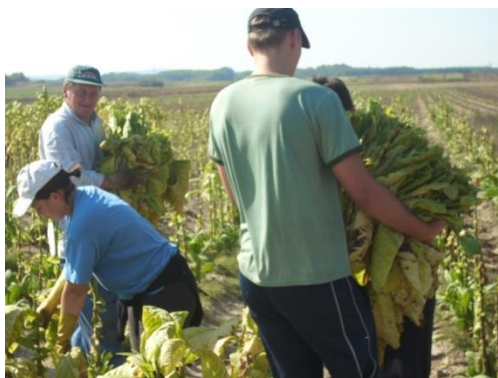
Slika 6. Berba duhana