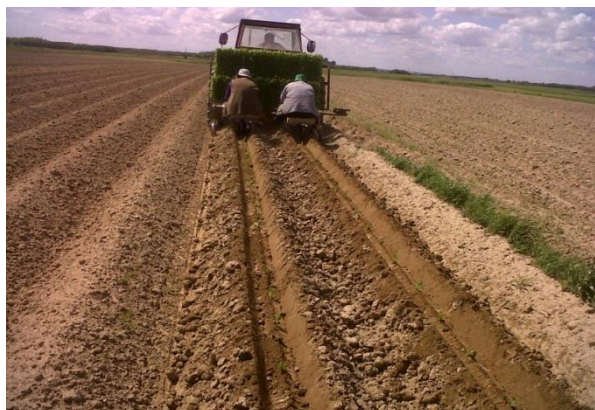
Slika 4. Sadnja duhana