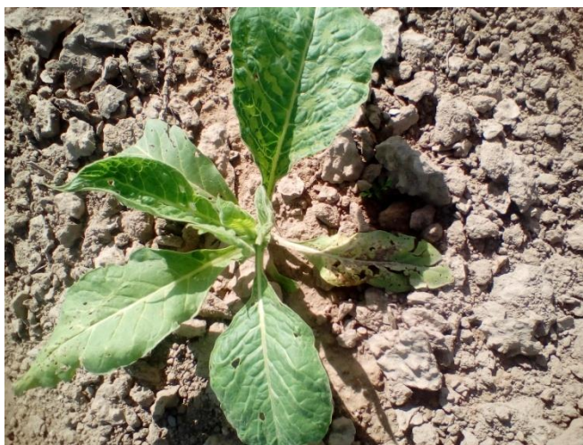
Slika 15. Virus mozaika duhana

17. To je relativno stara sorta te nema otpornost na TMV. Virusi nisu osjetljivi na antibiotike pa tako ih ne možemo suzbiti zaštitnim sredstvima. Kao najveći prenosioč virusa, zelena breskvina uš ( Mysus perssicae Sulzer), prijašnjih godina se je provodila mjera zaštite za suzbijanje istih. Mjere koje se mogu poduzeti je poštivanje plodoreda i mehaničko uništavanje zaraženih biljaka.