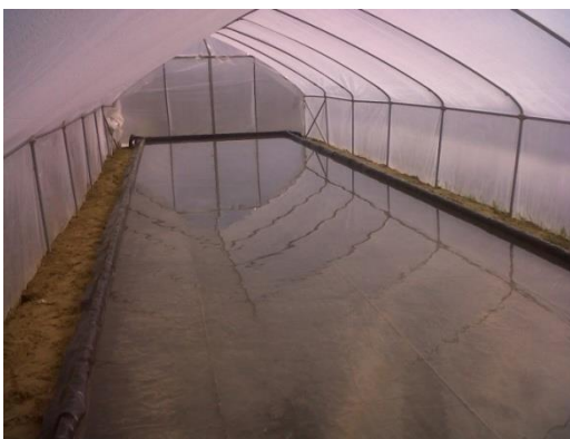
Slika 2. Hidroponi