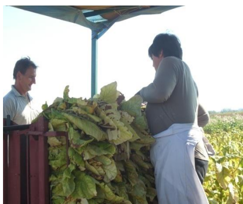
Slika 8. Berba duhana

Duhan se slaže u okvire odmah u polju, a zatim se puni okviri slažu u za to namijenjene specijalizirane prikolice (slike 9. i 10.).