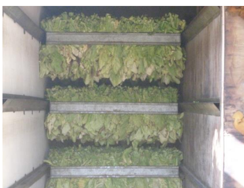
Slika 13. Punjenje sušare s duhanom

Tek ubran list duhana sadrži 90% vode i 10 % suhe tvari. Sušionice se ravnomjerno pune i hermetički zatvaraju (slika 13.).