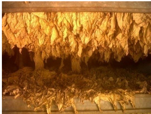
Slika 14. Sušenje duhana

Nakon sušenja duhan sadrži samo 5% vlage uslijed čega postaje lomljiv. Zbog toga se prije vađenja iz sušionice mora kondicionirati, odnosno dovlažiti, te poprima limunastu do narandastu boju kakarakterističnu za duhan tipa virginia (slika 14.).