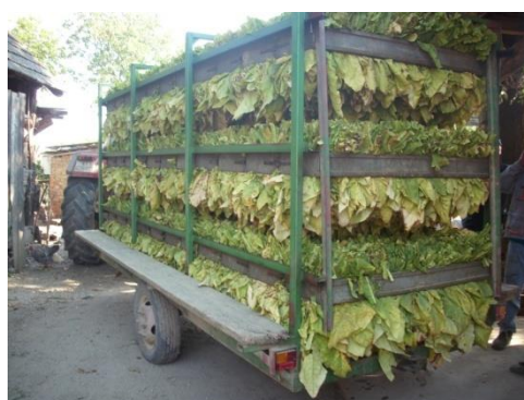
Slika 10. Prikolica sa ubranim duhanom