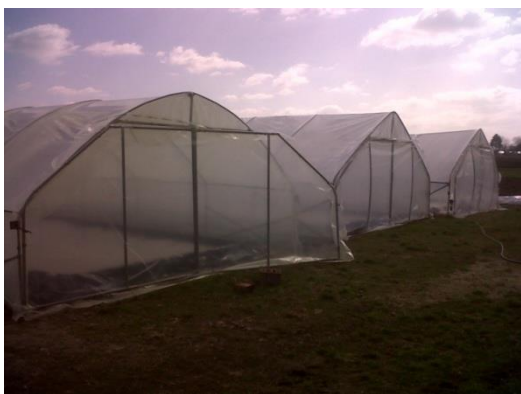
Slika 1. Plastenici