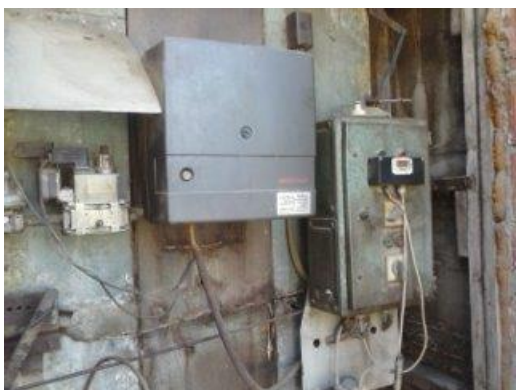
Slika 11. Termogen sušionice

OPG posjeduje tri sušionice kapaciteta 78 okvira, dvije sušionice tipa Univerzal i jedna Povel . Takve sušionice su bulk tipa, duhan se suši u okvirima, a izvor energije je plin (slike 11. i 12.).