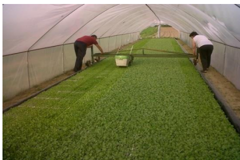
Slika 3. Košnja duhana

Rasad se presađuje u polje kada stabljika ima debljinu olovke i pri savijanju oko prsta ne puca. Duljina stabljike s lišćem veličine je 12 do 15 cm, a korijen mora biti dobro razvijen.