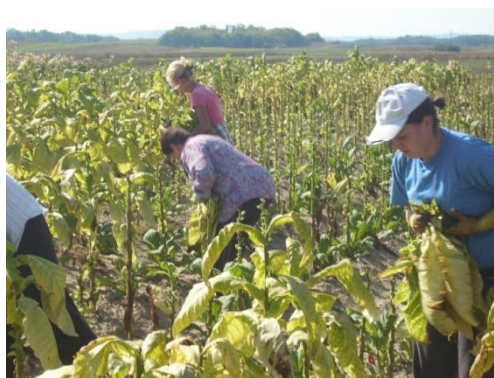
Slika 7. Berba duhana