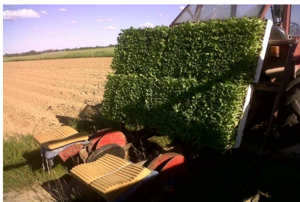
Slika 5. Sadilica za duhan