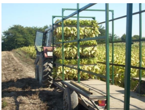
Slika 9. Prikolica za branje duhana

Duhan se slaže u okvire odmah u polju, a zatim se puni okviri slažu u za to namijenjene specijalizirane prikolice (slike 9. i 10.).