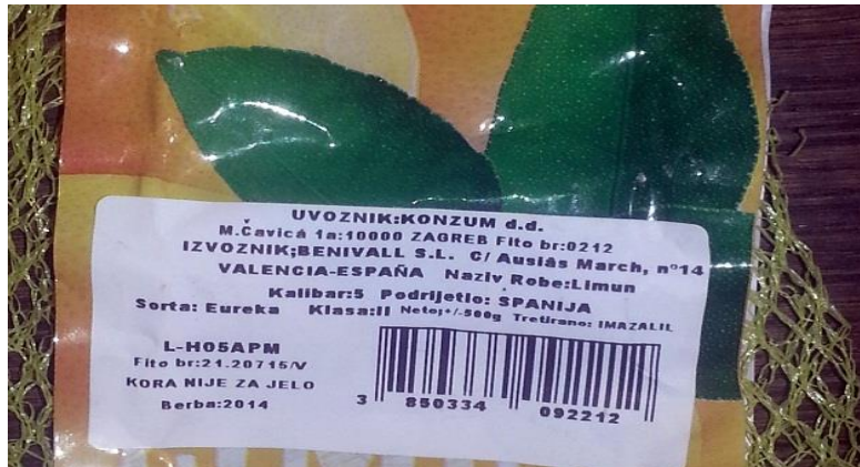
Slika 4. Deklaracija proizvoda velikog trgovačkog lanca

čovjekov organizam. Stoga na voću i stoji upozorenje da koru tretiranu imazalilom ne treba jesti.