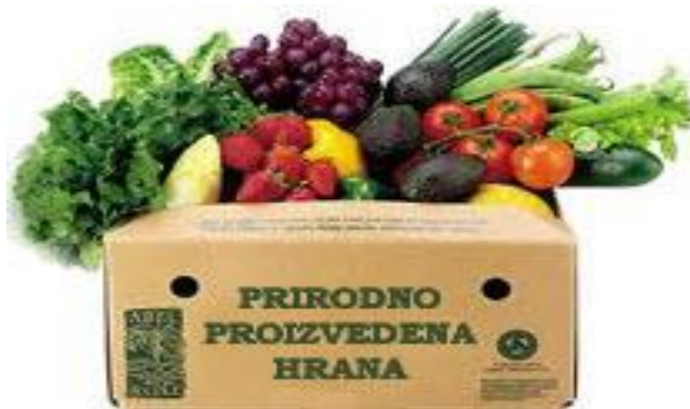
Slika 1. Organska hrana