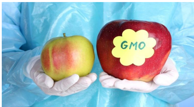
Slika 7. Uzgoj genetski modificirane jabuke