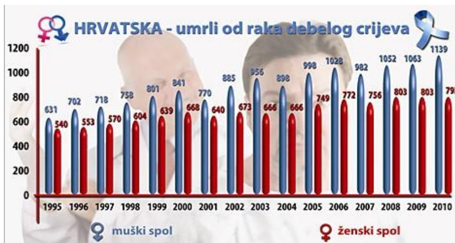
Grafikon 1. Prikaz umrlih u Hrvatskoj od raka debelog crijeva prouzročenog nekvalitetnom prehranom

Kod fizikalnih opasnosti u hrani podrazumijevaju se stvari koje se slučajno ili namjerno mogu naći u hrani, kao što su komadići stakla, plastike, gume, metala te ostali nejestivi materijali prilikom obavljanja određenih radnji proizvodnog procesa. Takve stvari najčešće u hranu dospijevaju nenamjerno, ali mogu biti i namjerno dodavani u svrhu sabotaze od strane zaposlenika, pri čemu se narušava estetika proizvoda, te mogu biti izvor opasnosti za potrošače. Ponekad i sama namirnica temeljem svojih dimenzija i fizikalnih svojstava, može predstavljati opasnost.