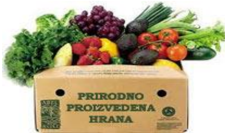
Slika 1. Organska hrana