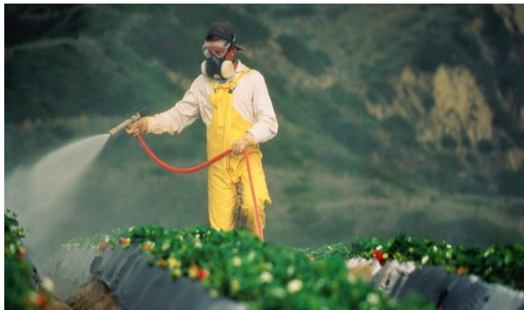
Slika 2. Primjena pesticida u konvencionalnoj proizvodnji

Konvencionalna poljoprivreda najčešći je tip poljoprivredne proizvodnje u Republici Hrvatskoj. No unatoč tome, postoji i pomak u proizvodnji na druge načine kao što je ekološka poljoprivreda. Prema podacima iz 2012. godine u Republici Hrvatskoj ekološka poljoprivreda činila je 2,4% proizvodnje, a konvencionalna 6,0%. Iako je primjena ekološkog načina proizvodnje u Hrvatskoj i dalje vrlo mala u usporedbi s ostalim razvijenim zemljama, smatra se da će se svakako u vrlo skoroj budućnosti povećati takav sustav proizvodnje zbog sve veće svijesti o očuvanju okoliša i zdravlja ljudi.