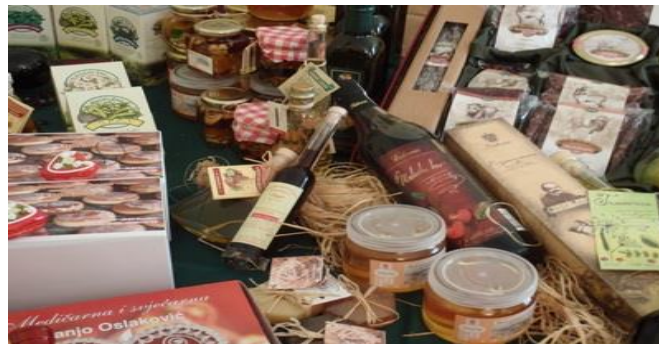
Slika 3. Tradicijski proizvodi

Najveći nedostatak tradicijskih proizvoda je visoka cijena, loše označavanje i priprema za tržište te nemogućnost kontrole. S obzirom na to da takvi proizvodi pripadaju višim sjenovnim razredima, a na tržištu Europske unije raste potražnja za autohtonim proizvodima posebne kvalitete, jasno je da veća proizvodnja tradicijskih proizvoda može imati veliki značaj u prihodovnom smislu poljoprivrednog gospodarstva. Pri tome treba imati na umu da se ovakvi proizvodi trebaju zaštititi europskim standardima kako bi potrošači bili sigurni u njihovu autohtonost i kvalitetu.