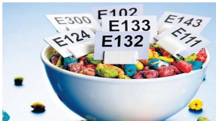
Slika 6. Oznake aditiva u hrani

Kod tvari za zaslađivanje ubrajaju se umjetna sladila i zamjene za šećer, te su zaslužne za sladak okus hrane. Kada je riječ o umjetnim sladilima, ona mogu biti i do nekoliko puta slađa od samog šećera s tim da nemaju gotovo nikakvu kaloričnu vrijednost. Za njihovu razgradnju u tijelu nije potreban inzulin te se zbog toga koriste u proizvodima namijenjenim dijabetičarima. Kao zamjene za industrijski šećer može se koristiti prirodni zaslađivač – stevija. Stevija za razliku od šećera ne uzrokuje karijes niti nepoželjnu toleranciju na okus, nema kalorija i štetnih nuspojava, uz to sve je otporna na visoke temperature. Krajem 80 – ih godina prošlog stoljeća američki Ured za hranu iznenada je pokrenuo postupak u kojem se zabranjuje uzgoj stevije, zbog navodno dovoljno neutvrđenih činjenica da je stevija puno zdravija u odnosu na industrijski dobiveni šećer. Ubrzo je bilo vidljivo da zakoni koji su provodili takvu odluku nisu utemeljeni, te se iz toga moglo zaključiti kako bi se intenzivnijom proizvodnjom stevije ugrozila industrijska proizvodnja šećera.