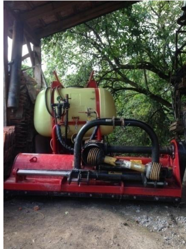
Slika 14. Garažiranje raspršivača i malčera

Nakon što se u jesen obavi zadnje prskanje i košnja strojevi se detaljno operu i stave na palete pod nadstrešnicu, (slika 14). Premazivanje protiv korozije se neprimjenjuje pa je utjecaj korozije pri ponovnoj upotrebi strojeva vidljiv.