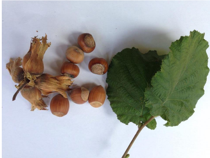
Slika 1.Plod i lišće lijeske