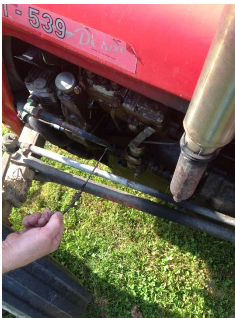
Slika 5. Provjera razine ulja

Pri tehničkom održavanju traktora prije početka rada provjerava se tlak zraka u pneumaticima, razina ulja, (slika 5.), i razina rashladne tekućine, signalizacija traktora te zategnutost remena ventilatora. Količina goriva se provjerava vizualno zbog toga što na traktor nema mjerača za gorivo.