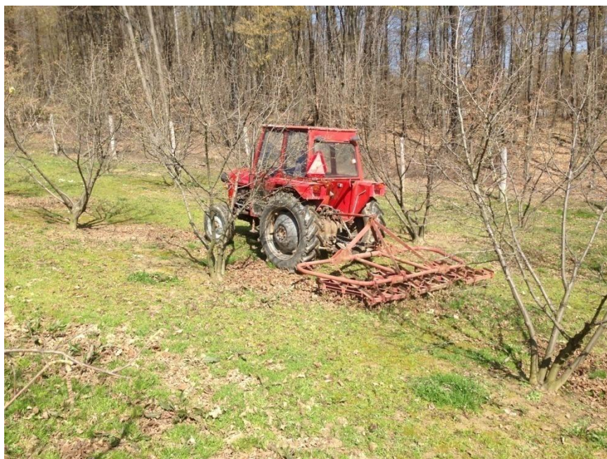
Slika 11.Drljanje travnate površine

Drljače, (slika 11.), se koriste samo u proljeće kada je potrebno poravnati travnatu površinu, pa su stoga većinu vremena izvan upotrebe. Prije svake upotrebe potrebno je provjeriti stanje radnih elemenata „zubaca“. Ukoliko je neki od radnih elemenata polomljen ili savinut potrebno je isti zamijeniti ili popraviti kako bi drljača radila ispravno. Nakon završetka radova čisti se nakupljena zemlja i trava kako bi se smanjio utjecaj korozije.