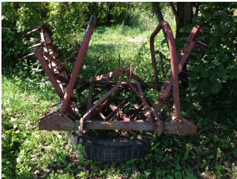
Slika 17. Garažiranje drljače

Drljača i tanjurača garažiraju se na otvorenom prostoru. Na istima, koje su postavljene na palete i traktorske gume, nije obavljena tehnička zaštita i one su tijekom garažiranja izložene djelovanju korozije, (slika 17. i 18).