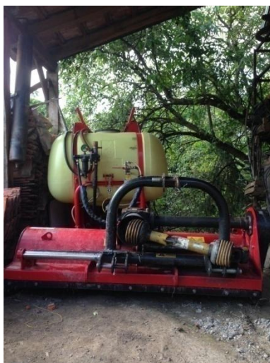
Slika 14. Garažiranje raspršivača i malčera

Nakon što se u jesen obavi zadnje prskanje i košnja strojevi se detaljno operu i stave na palete pod nadstrešnicu, (slika 14). Premazivanje protiv korozije se neprimjenjuje pa je utjecaj korozije pri ponovnoj upotrebi strojeva vidljiv.