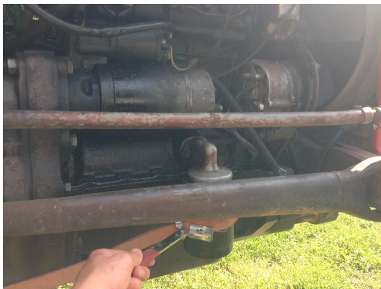
Slika 6. Izmjena pročistača ulja

Gume na traktoru mijenjaju se u vulkanizerskoj radionici, a stare otpadne gume ostaju kod vulkanizera.