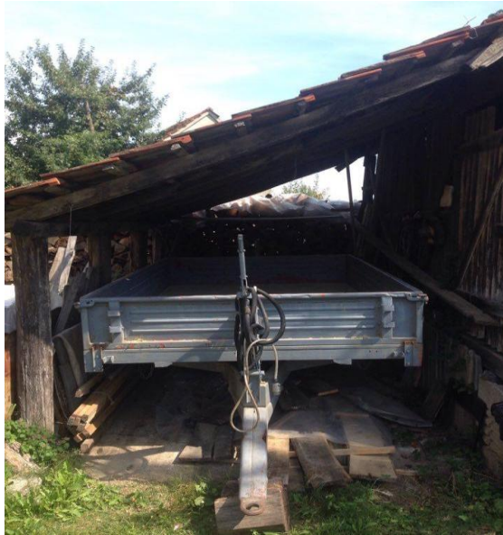
Slika 16. Garažiranje prikolice