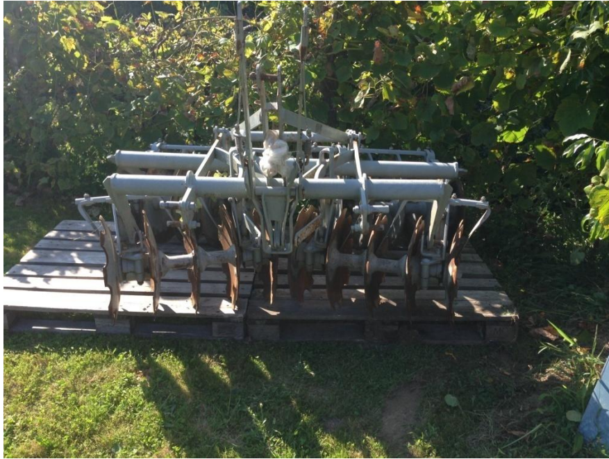
Slika 18. Garažiranje tanjurača