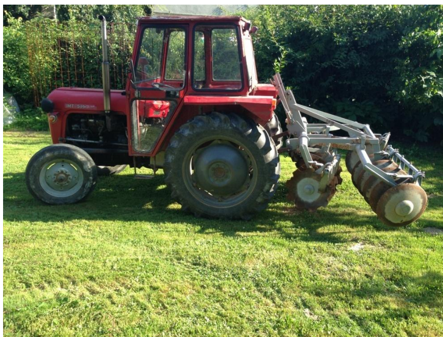
Slika 10. Tanjurača prije odlaska u rad

Na tanjurači se nalaze drveni ležajevi kuhani u ulju koje treba redovito podmazivati. Nakon određenog vremena ležajeve je potrebno zamijeniti novima kako nebi došlo do oštećenja kućišta ležaja. Stari ležajevi se zamjenjuju novima i podmažu grafitnom masti.