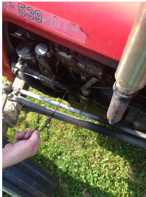
Slika 5. Provjera razine ulja

Pri tehničkom održavanju traktora prije početka rada provjerava se tlak zraka u pneumaticima, razina ulja, (slika 5.), i razina rashladne tekućine, signalizacija traktora te zategnutost remena ventilatora. Količina goriva se provjerava vizualno zbog toga što na traktor nema mjerača za gorivo.