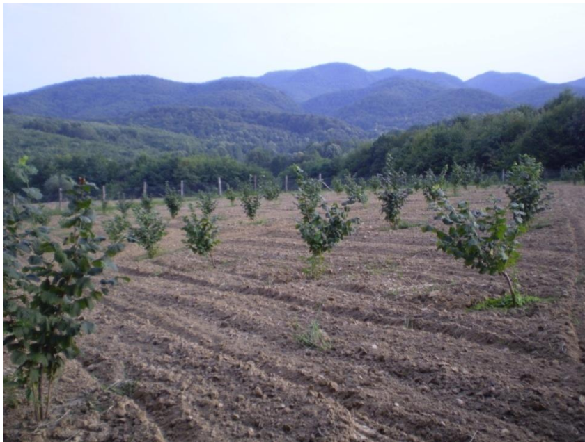
Slika 2. Nasad lijeske u drugoj godini

Prvih pet godina tlo je obrađivano tanjuranjem i okopavanjem oko same sadnice, te je nakon toga nasad zatravljen. Nekoliko puta tijekom vegetacije se obavlja međuredna obrada malčiranjem (svaka tri tjedna), a unutar reda se obavlja košnja sa trimerom. Nasad je od samog početka bio ograđen pletenom žicom, koja služi za zaštitu od divljači, posebice divljih svinja. Unatoč ogradi, divlje svinje prave sve veće štete kako na ogradi tako i na samom nasadu.