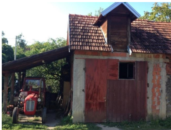
Slika 13. Garažiranje traktora

Traktor „IMT“- 539 s kabinom je u upotrebi tijekom cijele godine. Osim za potrebe OPG-a služi i za druge potrebe (dovoz drva, dovoz građevinskog materijala i dr.), pa se zbog toga ne obavlja konzerviranje istog nego se provode redovite mjere održavanja. Traktor se nalazi tijekom godine pod nadstrešnicom, (slika 13).