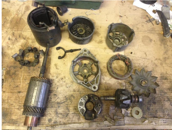
Slika 7. Dijelovi elektropokretača i alternatora

Prije garažiranja obavlja se servisiranje električnih uređaja na traktoru. Elektropokretač i alternator (generator izmjenične struje) se rastave, (slika 7.), i operu tekućinom za odmašćivanje. Pregleda se ispravnost dijelova. Potrošeni dijelovi se zamijene novima kako nebi došlo do kvara tijekom sezone, te se podmažu s novom masti.