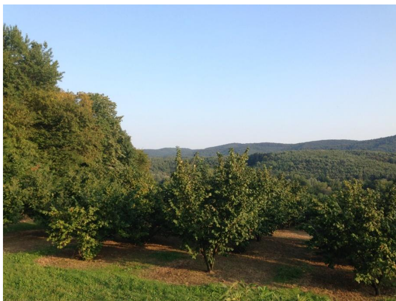
Slika 3. Nasad u punoj rodnosti

Urod je od sadnje postupno rastao s razvijanjem i povećavanjem vegetativne mase, slika 3.