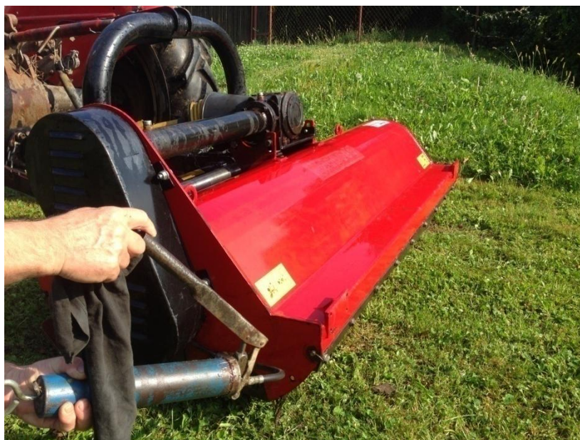
Slika 9. Podmazivanje ležajeva na malčeru

Nakon što se radni elementi „čekići“ istroše potrebno ih je zamijeniti novima. Na vratilu se nalaze 24 radna elementa. Ukoliko dođe do oštećenja radnog elementa isti se zamjenjuje novim istih svojstava kao i ostali radi lakšeg uravnoteženja vratila.