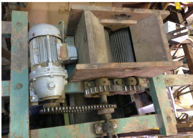
Slika 4. Stroj za drobljenje

Na muljaču je stavljen elektromotor sa reduktorom snage 0,12 kW koji pogoni valjke između kojih ulaze lješnjaci i obavlja se lomljenje ljuske. Lom jezgre je minimalan i iznosi 2-3 % (iskustveni podaci OPG-a) što je zadovoljavajuće. Nakon toga obavlja se ručno odvajanje jezgre od ljuske te se jezgra stavlja na sušenje. Ljuska od lješnjaka se koristi za zagrijavanje radionice na gospodarstvu i prostorije za sušenje lješnjaka.