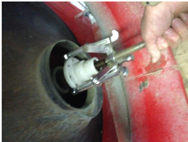
Slika 8. Skidanje kućišta ležaja

Promjena mlaznica vrši se po potrebi, a kada se uoče nepravilnosti kod rada pojedine mlaznice istu je potrebno zamjeniti. Koriste se keramičke vrtložne mlaznice. Ukoliko negdje na stroju dođe do pojave korozije, potrebno je odmah očistiti mjesto na kojem se pojavila i premazati zaštitnom bojom zato što se stroj nalazi u veoma agresivnoj sredini. Preparati koji se koriste u prskanju veoma agresivno djeluju na metalne dijelove te ih je stoga potrebno dobro zaštititi. Prije svake upotrebe provodi se provjera kardanskog prijenosnika te se po potrebi podmazuje.