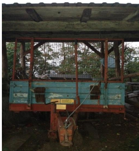
Slika 15. Garažiranje prikolice za stajski gnoj

Prikolice se parkiraju pod nadstrešnice, (slika 15. i 16). Tehnička zaštita oplata i pneumatika se ne obavlja.