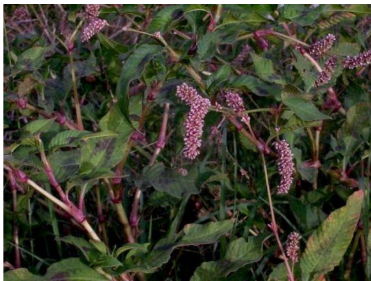
Slika 34. Polygonum lapatifolium L. – Kiseličasti dvornik Izvor: http://luirig.altervista.org/flora/taxa/index1.php?scientific-name=polygonum+lapathifolium