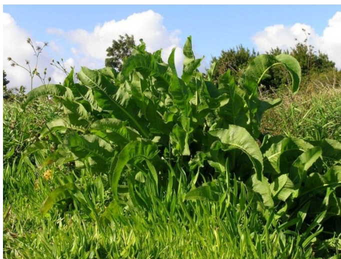
Slika 30. Rumex crispus L. – Kovrčava kiselica

Kovrčava kiselica (Slika 30.) je višegodišnja zeljasta biljka iz porodice dvornjača (Polygonaceae). Stabljika je uspravna, razgranata, visoka do 150 cm. Korijen je deo, mesnat, vretenast i dobro razgranat, dubok je više od 3 metra čime biljka crpi vodu i hranjiva iz dubokih slojeva. Listovi su dugački i uski, glatki, u prizemnoj rozeti su dugi 10-40 cm, imaju dugu peteljku, valovito kovrčavih su rubova, listovi na stabljici su naizmjenični, rijetki, manji i nemaju peteljku. Cvjetovi su mali, crvenkastozeleni skupljeni u razgranate metličaste cvatove duge 10-50 cm. Cvatu od lipnja do rujna. Plod je ahenij velik 3-6 mm, sjeme je trobridno, smeđe i sjajno. Biljka u godini stvara 2000 – 5000 sjemena koje zadržavaju sposobnost klijanja i nakon 60 godina. U fazi kada sjeme dozrije cijela biljka poprimi tamno crvenosmeđu boju i postane poludrvenasta.