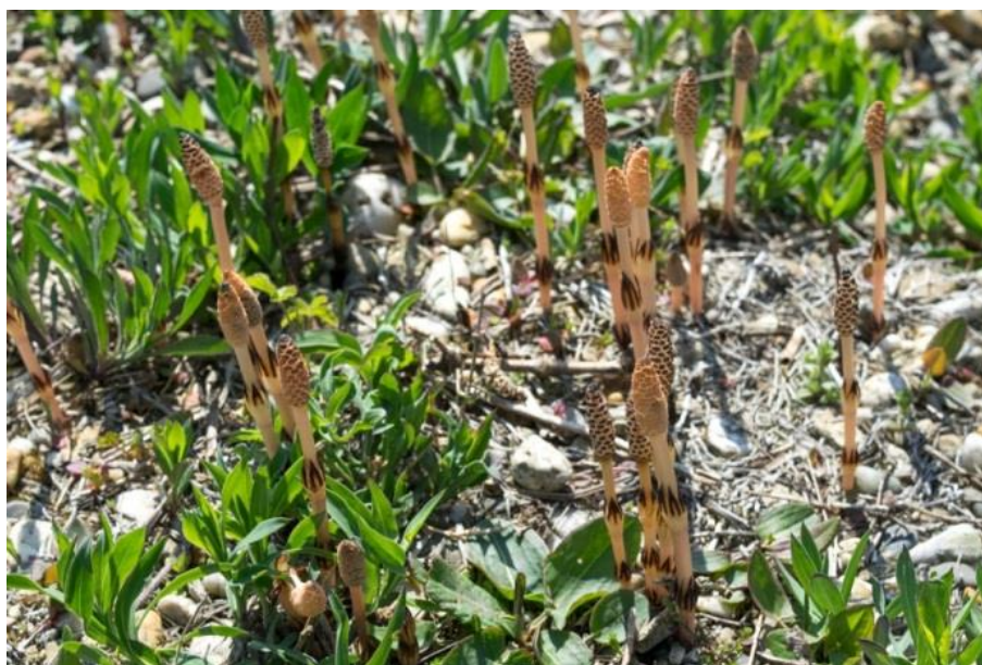
Slika 28. Equisetum arvense L. – Poljska preslica

Poljska preslica (Slika 28.) je trajna zeljasta biljka iz porodice preslica (Equisetaceae). Podanak je puzajuć i vrlo razgranat, vrlo dug a prodire u zemlji i do tri metra. U rano proljeće (ožujak, travanj) iz njega prvo niču do 20 cm visoke uspravne, plodne stabljike koje u vršnim trusnicima nose sporangije. Nakon što spore dozriju njihovi plodni izdanci uginu te krenu nicati novi izdanci koju se sterilni i narastu do 50 cm visine. Oni su zelene boje, izrazito čvrsti i žilavi, a u pršljenovima stvaraju bočne izdanke.