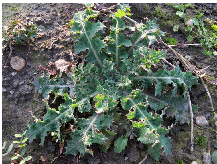
Slika 19. Sonchus oleraceus L. – Zeljasti ostak

Zeljasti ostak (Slika 19.) je jednogodišnja zeljasta biljka iz porodice glavočika (Asteraceae). Stabljika je uspravna, šuplja, debela i glatka, razgranata u gornjem dijelu, može narasti i do 1 m u visinu. Korijen je horizontalan, dobro razvijen. Listovi su naizmjenični, oštro nazubljeni, plavozeleni, donji su na peteljkama a gornji su strelasto prirasli uz stabljiku. Na vrhu stabljike nalaze se cvjetne glavice skupljene u rahle složene cvatove, čine ih žuti jezičasti cvjetovi. Cvatu od svibnja do rujna. Plod je ahenija s papusom. Jedna biljka godišnje proizvede do 30 000 sjemenki. Čitava biljka sadrži mnogo mliječnog soka.