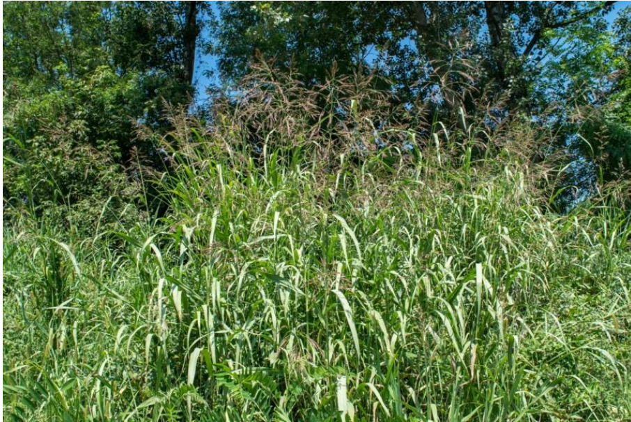
Slika 33. Sorghum halepense (L.) Pers. – Piramidalni sirak