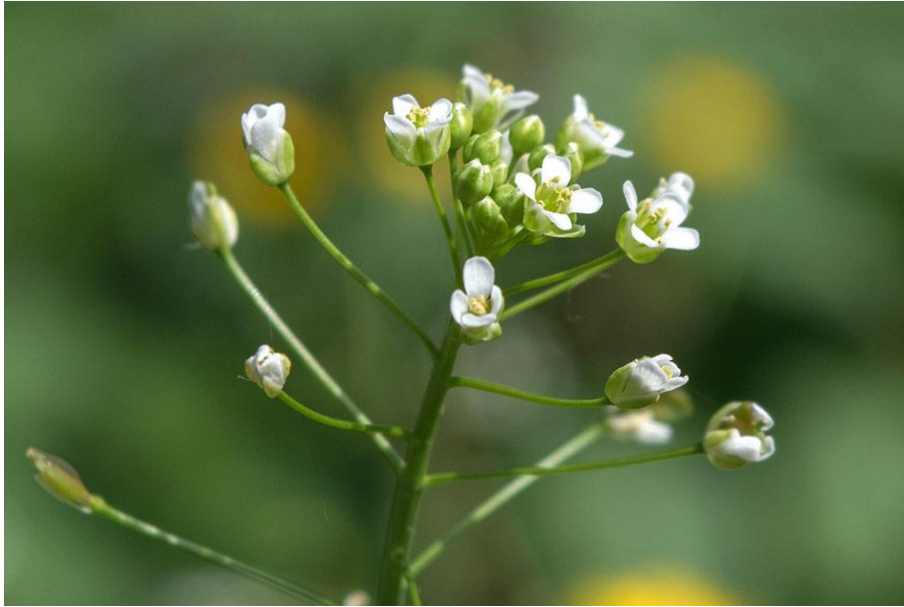
Slika 3. Capsella bursa-pastoris (L.) Med. – Prava rusomača