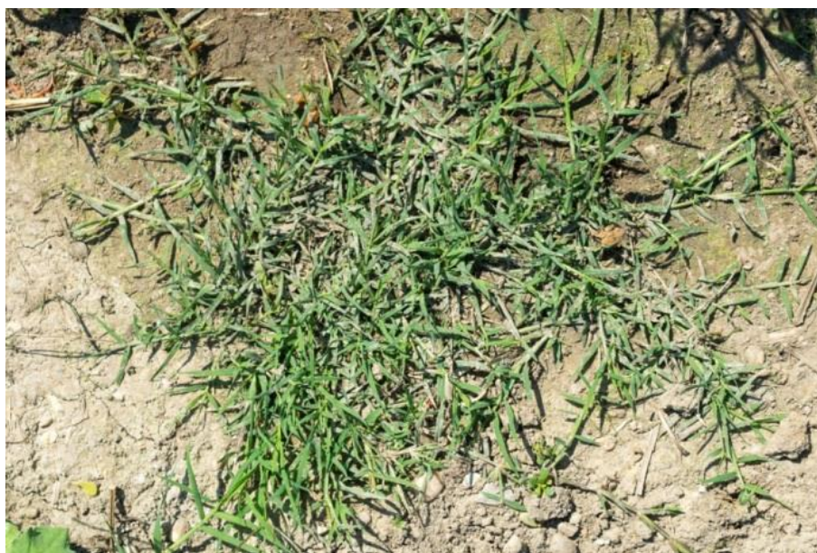
Slika 32. Agropyron repens (L.) PB. – Puzava pirika

Listovi su dugački, uski i plosnati, ušiljenog vrha, na licu su hrapavi. Lisni rukavci su goli ili češće dlakavi. Cvjeta od svibnja do kolovoza cvjetovima skupljenima u dugačkim klasovima. Klas se sastoji od 7-36 klasića jajastog oblika od kojih svaki sadrži 3-5 cvjetova. Plod je dlakavo pšeno. Biljka proizvede 300 – 1000 pšena godišnje. Zadržava klijavost do 4 godine.