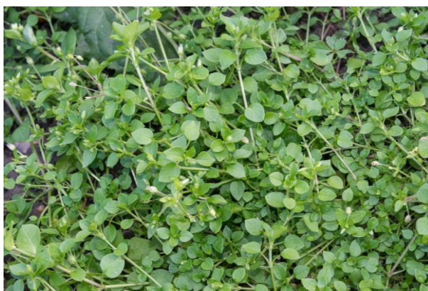
Slika 1. Stellaria media (L.) Vill. – Srednja mišjakinja

Srednja ili obična mišjakinja (Slika 1.) je jednogodišnja zeljasta biljka iz porodice karanfila (Caryophyllaceae). Stabljika je niskog rasta, naraste do 40 cm dužine no uglavnom je polegnuta uz zemlju. Jako je razgranata i tek u jednom redu je prekrivena dlačicama (Knežević, 2006.). Listovi su nasuprotno smješteni, maleni, jajastog oblika, cjelovitog ruba i ušiljenog vrha. Donji listovi smješteni su na peteljci dok su gornji sjedeći – bez peteljke. Cvate tokom cijele godine malim, bijelim cvjetovima sa 10 latica koje su smješteni u parovima kao zečje uši. Sjemenke su česta ptičja hrana.