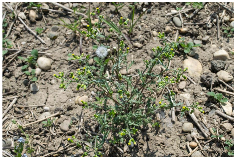
Slika 7. Senecio vulgaris L. – Obični staračac

Obični staračac (Slika 7.) je jednogodišnja ili dvogodišnja zeljasta biljka iz porodice glavočika (Asteraceae). Stabljika je uspravna, razgranata od osnove i naraste do 50 cm visine. Listovi su naizmjenični, plitko urezani, donji listovi nalaze se na peteljka dok su gornji sjedeći. Cvjetovi su žuti, skupljeni u izdužene cvatove, čine ih cjevasti cvjetovi u sredini, jezičasti cvjetovi nedostaju već cijeli cvat izgleda kao da se nije još otvorio. Cvate od ožujka do listopada. Plod nema papus. Jedna biljka godišnje proizvede do 7000 sjemenki koje zadržavaju klijavost do tri godine.