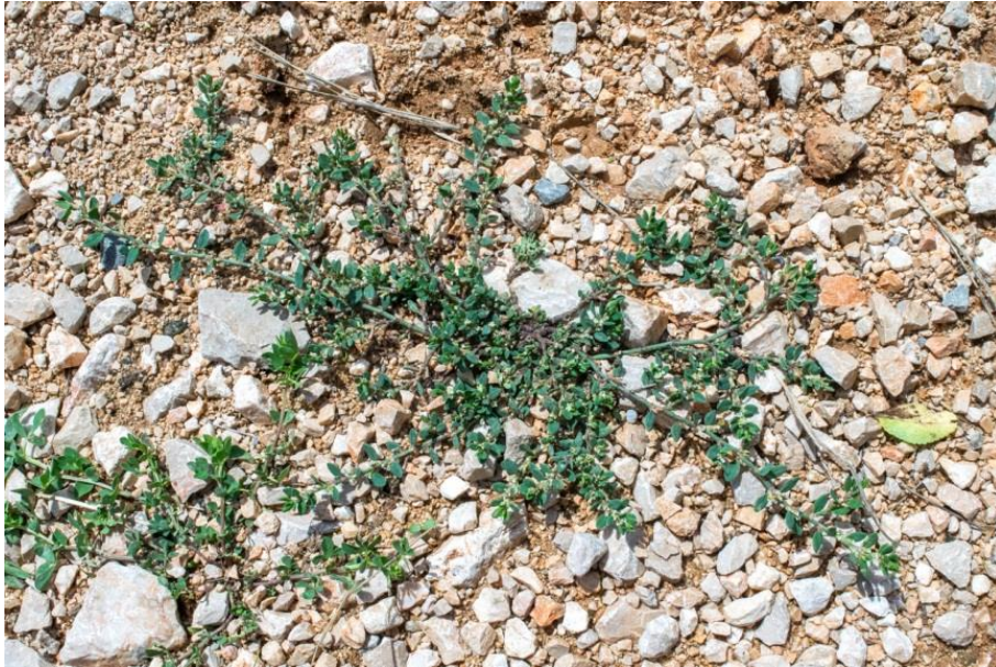
Slika 16. Polygonum aviculare L. – Ptičji dvornik