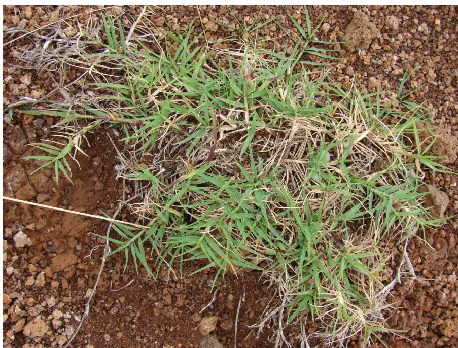
Slika 31. Cynodon dactylon (L.) Pers. – Prstasti troskot

Zubača (Slika 31.) je zeljasta trajnica iz porodice trava (Poaceae). Podanak nosi brojne vriježe i vrlo je dug, naraste i preko 1 metar, ide do 35 cm dubine. Izračunato je da biljka može na jednom hektaru razviti oko 800 km podanaka koji nose nekoliko milijuna pupoljaka. Na koljencima vriježa stvara se adventivno korijenje kojim se ponovno ukorijenjuje. Iz podanka rastu izdanci visoki do 50 cm, iz pupoljaka na vriježama stvaraju se fertilni izdanci. Listovi su lancetasti, kruti, ravni, ušiljeni, slabo dlakavi, rukavci su im goli. Cvjetovi su skupljeni po 3-6 u jednostavne klasove. Cvatu od lipnja do kolovoza. Jedna biljka u godini stvara 1000 – 2000 sjemena, no slabe su klijavosti.