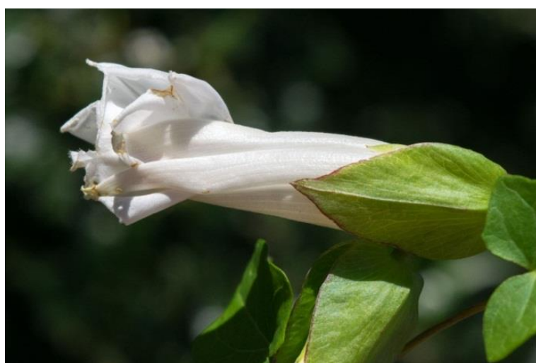
Slika 27. Calystegia sepium (L.) R.Br. – Obični ladolež

Ladolež (Slika 27.) je višegodišnja zeljasta biljka iz porodice slakova (Convolvulaceae). Stabljika je duga i do 3 metra a raste obavijajući se oko drugih biljaka pored kojih raste. Korijen je razgranat i dobro razvijen. Listovi su strelasti, dugi 5-10 cm, široki 3-7 cm, cjelovitog no malo valovitog ruba i ušiljeni na vrhu. Cvjetovi su pojedinačni, veliki, ljevčkasti i bijele boje, nalaze se u pazušcima gornjih listova. Cvate od lipnja do rujna. Plod je okruglast tobolac koji sadrži 3-4 crne sjemenke. Jedna biljka godišnje proizvede 100-400 sjemenki koje obično kličaju u proljeće. Razmnožava se sjemenom, korijenom i nadzemnim izdancima koji se ukorjenjuju u dodiru sa zemljom.