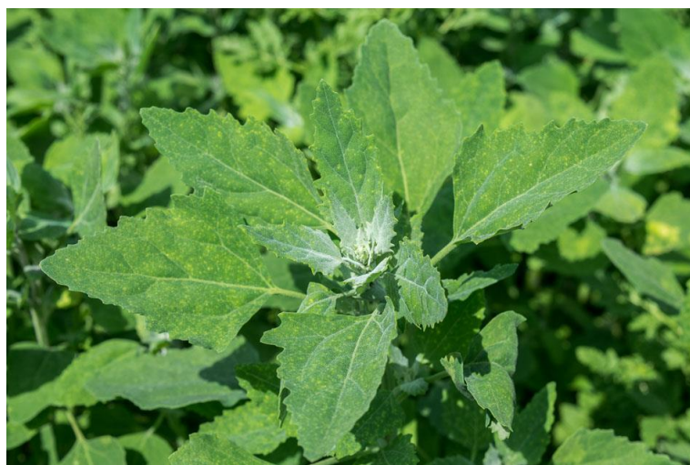
Slika 12. Chenopodium album L. – Bijela loboda

Na licu listova vidljivi je bijeli prah po kojemu je vrsta dobila ime. Cvjetovi su dvospolni, sitni, zelenkasti, skupljeni u razgranate grozdaste cvatove. Cvijet sadrži 5 prašnika i tučak. Cvate od srpnja do rujna (Knežević, 2006.). Nakon oprašivanja stvaraju se brojne sitne, tamne sjemenke koje variraju veličinom, bojom i sjemenom lupinom a razlikuju se i po brzini klijanja. Jedan tip klija brzo, drugi tipovi nakon određene faze dormantnosti. Uočeno je da zadržavaju sposobnosti klijanja i nakon impresivnih 1600 godina. Jedna biljka godišnje može proizvesti i do 800 000 sjemenki, iako ih u prosjeku daje 3000 – 20 000.