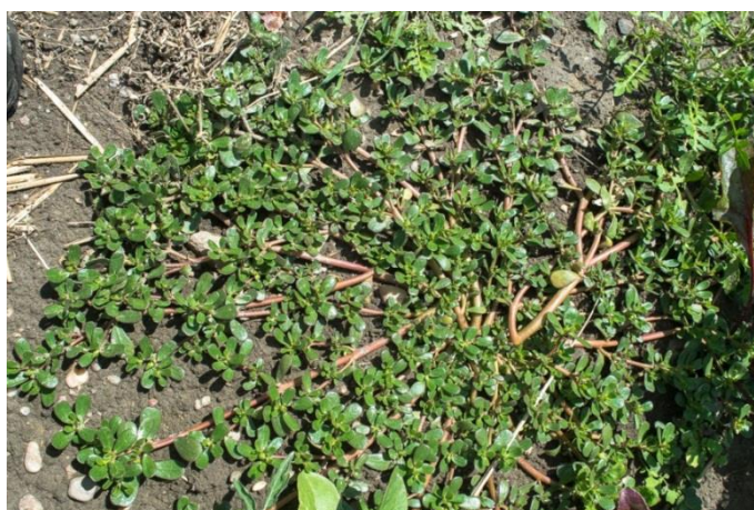
Slika 18. Portulaca oleracea L. – Obični tušanj

Tušanj (Slika 18.) je jednogodišnja sukulentna biljka iz porodice tušnjeva (Portulacaceae). Stabljika je vrlo razgranata, polegnuta tik uz zemlju i raste u širinu puštajući izdanke u svim smjerovima. Stapke su crvenosmeđe, mesnate i sočne, narastu do 30 cm dužine. Listovi su naizmjenični, ovalni, obrnuto jajasti, sjedeći i mesnati. Cvjetovi su sićušni i žućkaste boje, smješteni pojedinačno ili po 2-3 u pazušcima listova. Traju svega nekoliko sati za vrijeme sunčanog jutra. Cvatu od srpnja do listopada. Sitno, crno ali brojno sjeme (10,000 po biljci!) stvara se u malim tobolcima. Klije nakon razdoblja dormantnosti u drugoj godini u proljeće, no zadržava sposobnost klijanja i nakon 40 godina.