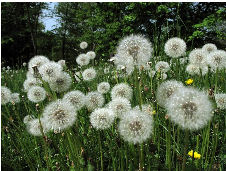
Slika 24. Taraxacum officinale Web. – Ljekoviti maslačak