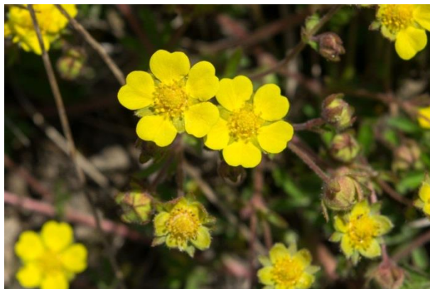
Slika 11. Potentilla reptans L. – Puzajući petoprst

Puzajući petoprst (Slika 11.) je višegodišnja zeljasta biljka iz porodice ruža (Rosaceae). Stabljika je puzava ili polegnuta, starije stabljike su često crvenkaste boje, narastu do 100 cm dužine. Korijen je razgranat i dubok. Vriježe su dugačke do 40 cm, kada im koljenca dodirnu zemlju ukorjenjuju se. Podanak je zadebljan. Listovi su naizmjenični, dlanasti, nalaze se na dugim peteljkama. Sastavljeni su od 5-7 jajolikih lisaka, nazubljenih rubova i prema osnovi suženi. Prekriveni su dlačicama kao i stabljika. Cvjetovi su pojedinačni, nalaze se na dugim, tankim stapkama u pazušcima listova. Sastavljeni su od pet žutih latica, pet lapova čaške i do 20 prašnika. Latice su dvostruko duže od čaške. Cvatu od lipnja do rujna. Plod je oraščić (Knežević, 2006.).