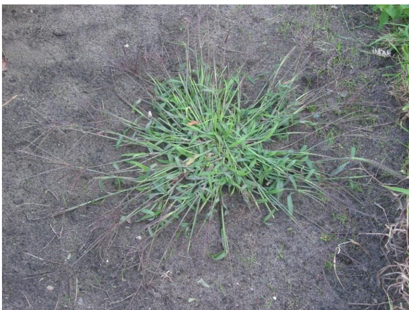
Slika 21. Digitaria sanguinalis (L.) Scop – Ljubičasta svračica

Svrāčica (Slika 21.) je jednogodišnja biljka iz porodice trava (Poaceae). Korijenov sustav je jak i dobro razvijen, stvara mnogobrojne do 50 cm duge stabljike uzdižuće, ili često privijene uz tlo. Listovi su dugi 5-15 cm, široki 5-8 mm, na licu prekriveni mekim dlakama a i rukavci donjih listova imaju dlake. Klasovi su raspoređeni na vrhovima stabljika, nose dvospolne, tamnocrvene boje. Cvjeta u lipnju. U jednoj sezoni stvori do 5000 sjemena.