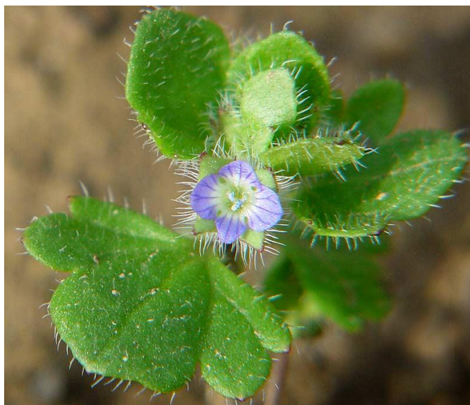
Slika 5. Veronica hederifolia L. – Bršljanasta čestoslavica

Bršljanasta čestoslavica (Slika 5.) je jednogodišnja ozima biljka, visine 5-30 cm. Korijenov je sustav jako razgranjen. Stabljika je pogućla ili se uzdiže, od osnove je jako razgranjena i dlakava. Donji su listovi nasuprotni, srcoliki, s peteljka, a ostali su na stabljici izmjenični i podijeljeni na 3-5 režnjeva. Cvjetovi su na stapkama, ljubičaste ili plave, rjeđe bijele boje, dolaze pojedinačno, u oazušcima listova. Sjemenke klijaju u hladno doba, tj. kasno u jesen ili rano u proljeće, iz površinskog sloja tla. Biljka proizvede oko 200-300 sjemenki (Knežević, 2006.)