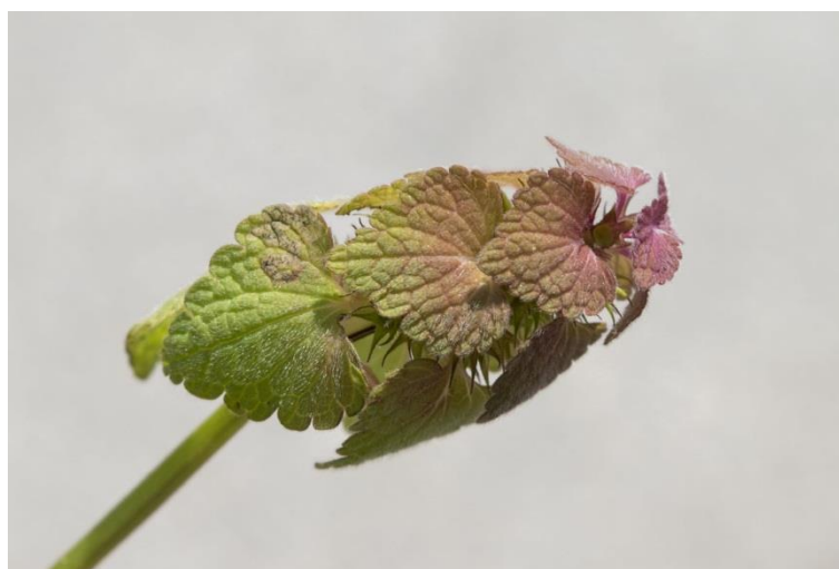
Slika 2. Lamium purpureum L. – Grimizna mrtva kopriva

Grimizna mrtva kopriva (Slika 2.) je jednogodišnja ili dvogodišnja zeljasta biljka iz porodice usnača (Lamiaceae). Stabljika je uspravna, šuplja, razgranata pri dnu, naraste do 30 cm visine. Donji listovi su na peteljci i okruglastog su oblika, gornji listovi su srcoliki, nazubljenih rubova i bez peteljke. Korijen je razgranat. Cvjetovi su ljubičasti, skupljeni po 6-10 u prividne pršljenove u pazušcima listova. Gornja usna je uspravna, donja trodijelna. Cvate skoro cijele godine izuzev kasne jeseni i početka zime. Jedna biljka proizvede oko 200 sjemenki koje zadržavaju sposobnost klijanja i nakon 600 godina.