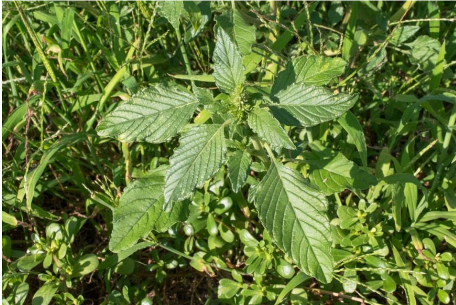
Slika 13. Amaranthus retroflexus L. – Oštrodlakavi šćir