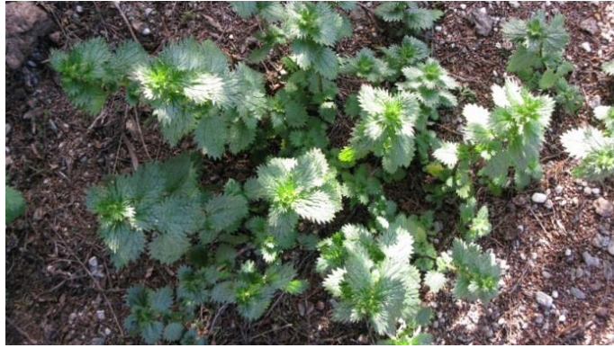
Slika 29. Urtica urens L. – Mala kopriva