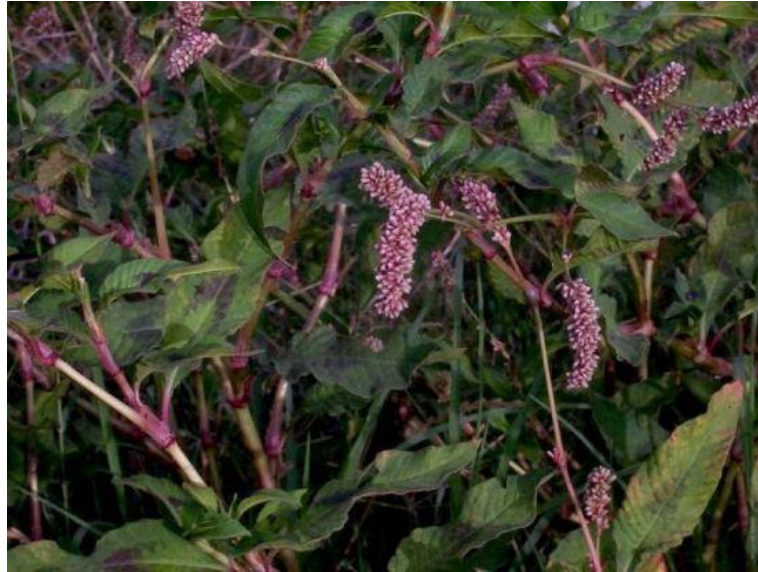
Slika 34. Polygonum lapathifolium L. – Kiseličasti dvornik