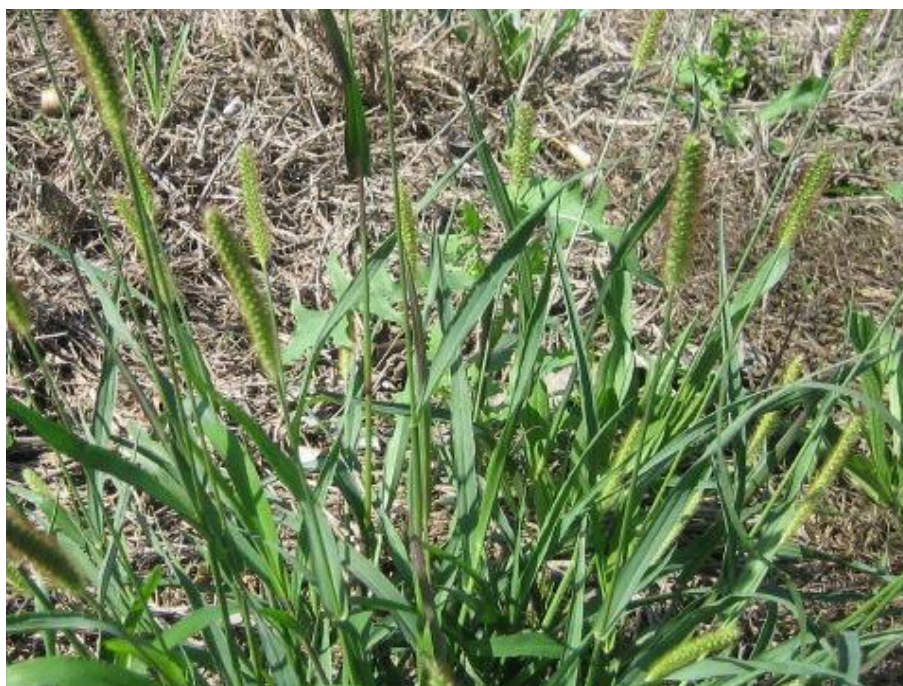
Slika 22. Setaria glauca L. PB. – Crvenkasti muhar

Crvenkasti muhar (Slika 22.) je jednogodišnja biljka, visine 10-40 cm. Vlati su uspravne i hrapave. Plojke su svijetlozelene, s izraženom bijelom žilom. Rukavci su plosnato stisnuti, produženi poput kljuna. Prividni je klas sastavljen od malenih, jednocvjetnih klasića, sa žutim do crvenkastim bodljama i 2-3 puta dužim od klasića. Sjemenke klijaju kasno u proljeće. Biljka proizvede do 500 sjemenki. Pored Crvenkastog muhara, u vinogradima se javlja i pršljenasti muhar ( Setaria verticillata L. PB) i zeleni muhar ( Setaria viridis L. PB.).