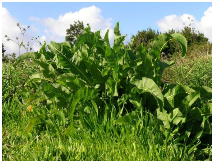
Slika 30. Rumex crispus L. – Kovrčava kiselica

Kovrčava kiselica (Slika 30.) je višegodišnja zeljasta biljka iz porodice dvornjača (Polygonaceae). Stabljika je uspravna, razgranata, visoka do 150 cm. Korižen je deo, mesnat, vretenast i dobro razgranat, dubok je više od 3 metra čime biljka crpi vodu i hranjiva iz dubokih slojeva. Listovi su dugački i uski, glatki, u prizemnoj rozeti su dugi 10-40 cm, imaju dugu peteljku, valovito kovrčavih su rubova, listovi na stabljici su naizmjenični, rijetki, manji i nemaju peteljku. Cvjetovi su mali, crvenkastozeleni skupljeni u razgranate metličaste cvatove duge 10-50 cm. Cvatu od lipnja do rujna. Plod je ahenij velik 3-6 mm, sjeme je trobridno, smeđe i sjajno. Biljka u godini stvara 2000 – 5000 sjemena koje zadržavaju sposobnost klijanja i nakon 60 godina. U fazi kada sjeme dozrije cijela biljka poprimi tamno crvenosmeđu boju i postane poludrvenasta.