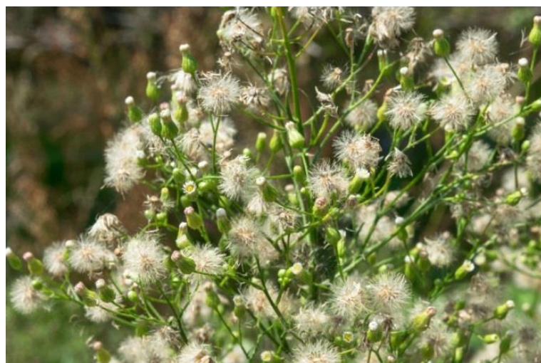
Slika 14. Conyza canadensis (L.) Cronq. – Kanadska hudoljetnica

Kanadska hudoljetnica (Slika 14.) je jednogodišnja zeljasta biljka iz porodice glavočika (Asteraceae). Stabljika je uspravna, prekrivena rijetkim dlačicama i naraste do 150 cm visine. Korijen je vretenast. Listovi su naizmjenični, jednostavni, uski, spiralno i gusto rastu uzduž donjeg dijela biljke. U gornjem dijelu snažno je razgranata, tvoreći bijele cvjetovi koji bujno cvatu skupljeni u metličaste cvatove. Na jednoj biljci može se nalaziti i više od 100 cvjetnih glavica. Cvatu od lipnja do rujna. Jedna biljka daje ogroman broj sjemenki (100 000 – 200 000) koje niču krajem sezone i prezimljuju u obliku rozete.