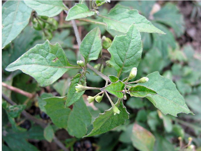
Slika 17. Solanum nigrum L. emend. Miller – Crna pomoćnica