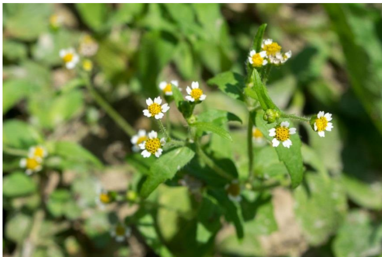
Slika 15. Galinsoga parviflora Cav. – Sitna konica

Sitnocvjetna konica (Slika 15.) je jednogodišnja zeljasta biljka iz porodice glavočika (Asteraceae). Stabljika je uspravna ili polegnuta, razgranata, naraste 20-80 cm visine. Listovi su jednostavni, nasuprotno smješteni i nazubljenih su rubova. Donji listovi su na peteljka, dok su gornji većinom sjedeći. Cvjetovi su mali i smješteni na dugim stapkama, sastavljeni su od središnjih žutih cjevastih cvjetova i pet bijelih jezičastih cvjetova. Cvate od svibnja do listopada. Jedna biljka proizvede 5000 – 300 000 sjemenki koje zadržavaju klijavost i nakon 10 godina. Sjemenke su klijave svježe i mogu dati 2-3 generacije godišnje, sve do pojave mraza.