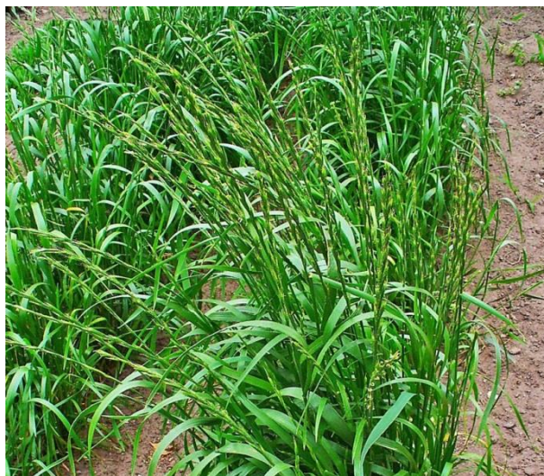
Slika 10. Lolium temulentum L. – pijani ljulj

Pijani ljulj ili debelovlatni ljulj (Slika 10.) je jednogodišnja zeljasta biljka iz porodice trava (Poaceae). Stabljika je uspravna, u gornjem dijelu hrapava, visoka do 80 cm. Listovi su na licu hrapavi, naličje im je sjajno, dugi 6-40 cm, široki 3-13 mm. Klas je uspravan, plosnat, dug oko 20 cm, sadrži mnogobrojne klasiće međusobno razmaknute. Svaki klasić ima 5-9 cvjetova. Cvate u lipnju i srpnju.