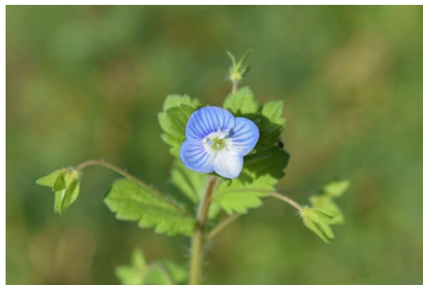
Slika 4. Veronica persica Poir. – Perzijska čestoslavica

Perzijska čestoslavica (Slika 4.) je jednogodišnja zeljasta biljka iz porodice trputca (Plantaginaceae). Stabljika je jednostavna ili razgranata od osnove, polegnuta uz tlo ili se tek dijelom uzduže. Niskog je rasta, naraste do 50 cm visine, prekrivena je dlačicama i često tamnocrvenkasta. Donji listovi su naizmjenični i kratke stapke, srednji i gornji su nasuprotni i gotovo sjedeći, jajolikog su oblika, pri osnovi su plitko sroliko usječeni i grubo su nazubljenih rubova. Cvjetovi su mali, smješteni u pazušcima listova na dugačkim drškama. Ždrijelo je žućkasto, vjenčić je svijetloplavi s tamnim prugama, prašnika ima 4. Može cvasti i tijekom cijele godine ako su uvjeti povoljni, no sigurno od ožujka do listopada. Jedna biljka proizvede 50-100 sjemenki koje rasprostranjuju mravi.