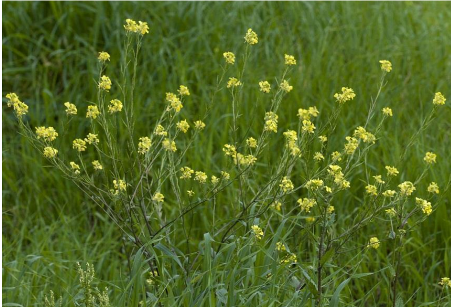
Slika 6. Sinapis arvensis L. – Poljska gorušica