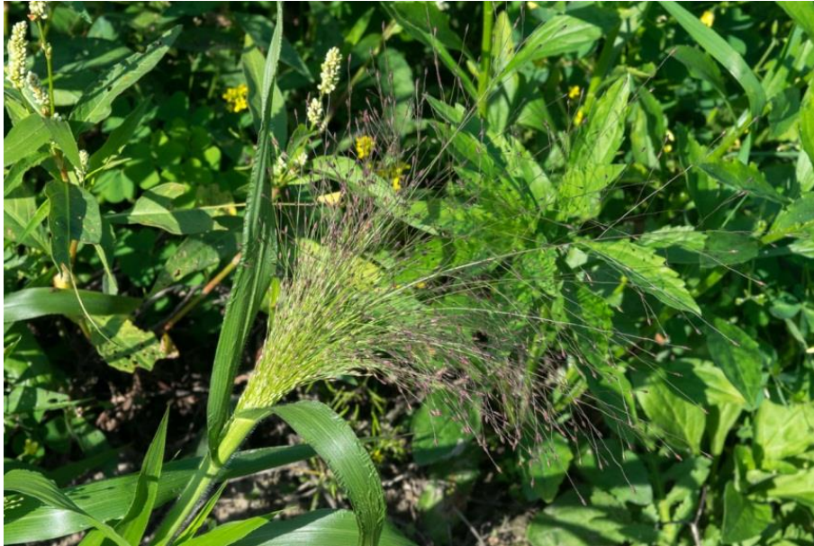
Slika 23. Panicum capillare L. – Vlasasto proso

Među višegodišnje širokolisne korove ubrajamo: Taraxacum officinale Web., Cirsium arvense (L.) Scop., Convolvulus arvensis L., Calystegia sepium (L.) R.Br., Equisetum arvense L., Urtica urens L. i Rumex crispus L.