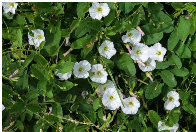
Slika 26. Convolvulus arvensis L. – Poljski slak