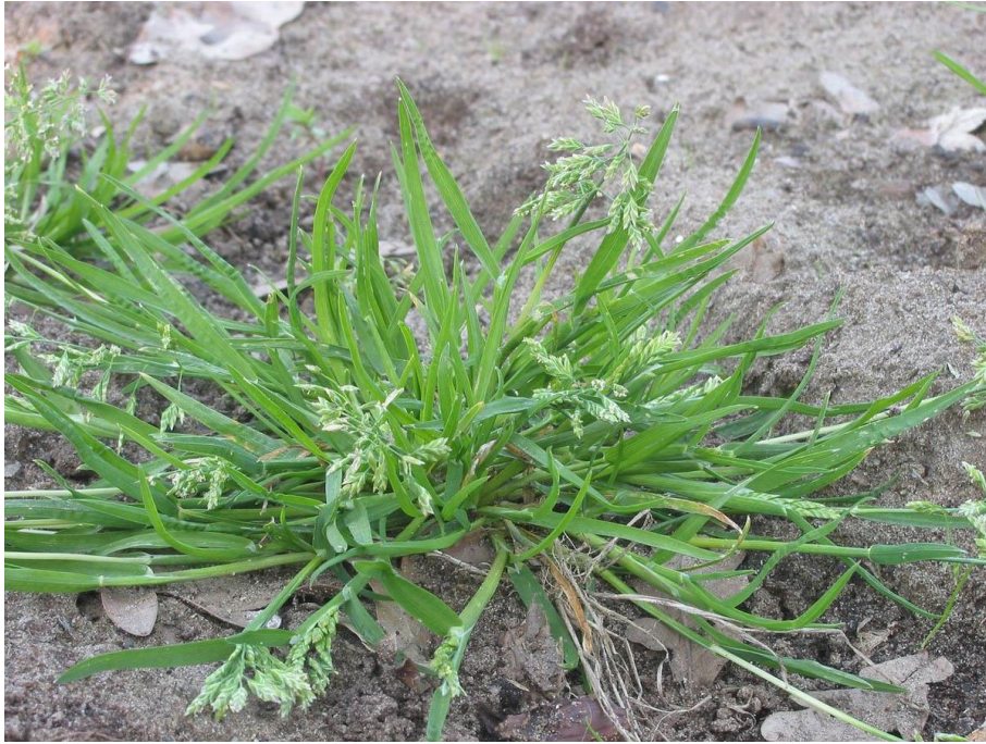
Slika 9. Poa annua L. – Jednogodišnja vlasnjača