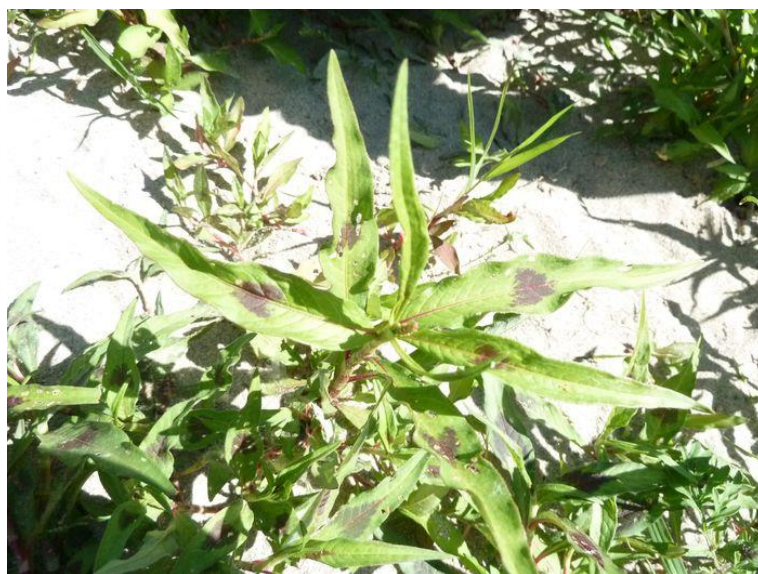
Slika 35. Polygonum persicaria L. – Pjegasti dvornik

Pjegasti dvornik (Slika 35.) je jednogodišnja biljka, visine od 10 do 60 cm. Stabljika je razgranjena i člankovita. Listovi su izmjenični, sivkasto zeleni, često s tamnom pjegom, lancetasti, s produženim, šiljastim vrhom. Cvjetovi su sitni, sa zelenkastobijelim, ružičastim ili crvenim perigonom, sakupljeni po 1 do 3 u gustim, klasastim cvatovima. Plod je sroliki, sjajni oraščić, s jednom sjemenkom. Sjemenke kličaju kasno u proljeće. Biljka proizvede do 800 sjemenki (Knežević, 2006.).