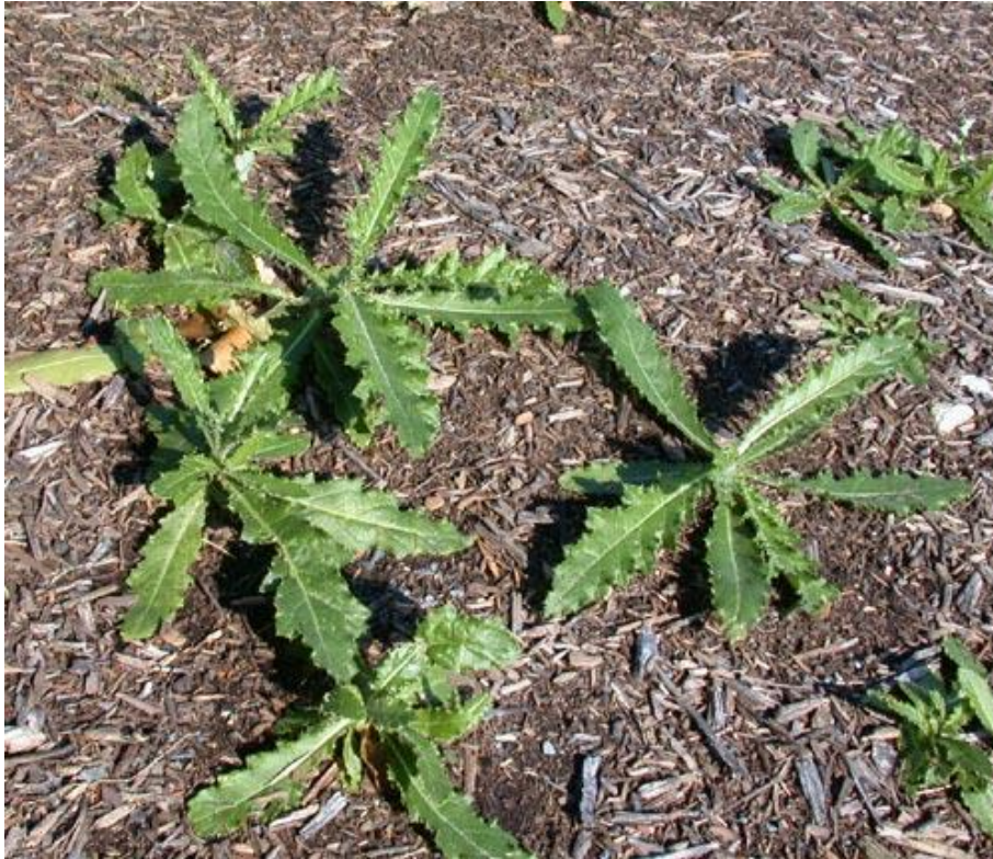
Slika 25. Cirsium arvense (L.) Scop. – Poljski osjak