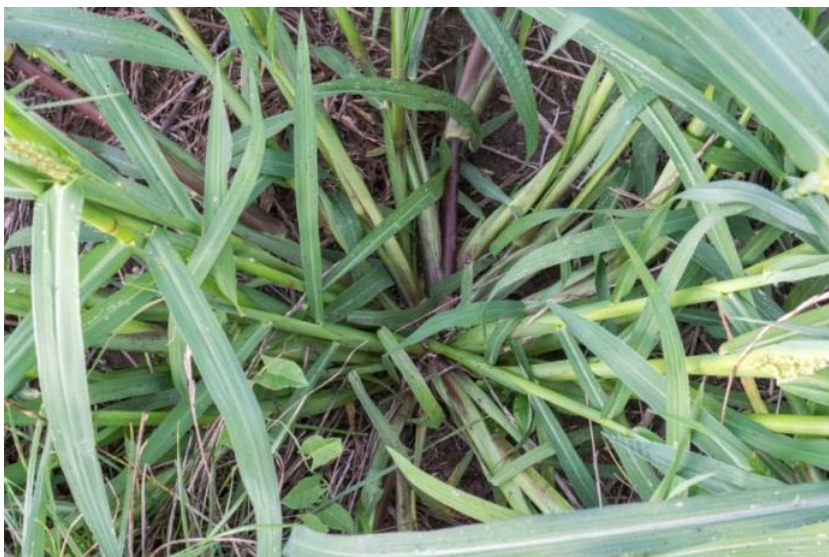
Slika 20. Echinochloa crus-galli (L.) PB. – Obični koštan