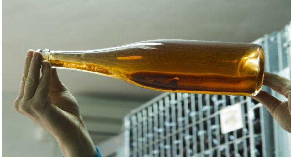
Slika 2. Talog pri klasičnom načinu fermentacije.