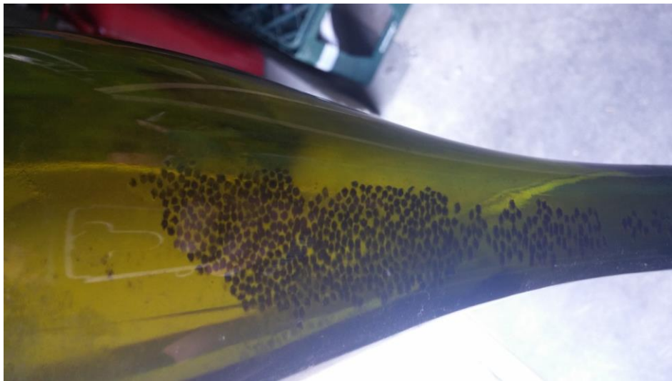
Slika 3. Talog pri fermentaciji s imobiliziranim kvascima.