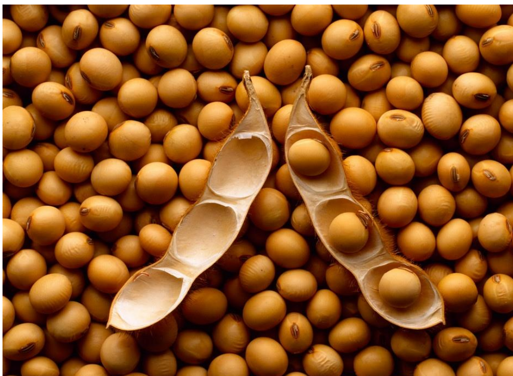
Slika 3: Soja web: http://www.navidiku.rs/magazin/

Stari Kinezi tisućama su godina prije Krista soju nazivali hranom i lijekom, svrstavajući je u red svetih biljaka. Danas možemo reći da soja pripada funkcionalnoj hrani, što znači da je između namirnice i lijeka. Ova nevjerojatna ljekovita biljka, ovisno o sorti (žuta, zelena, crna soja), sadrži između 37 i 50% proteina (dva puta više nego u mesu), uključujući svih 8 esencijalnih aminokiselina.