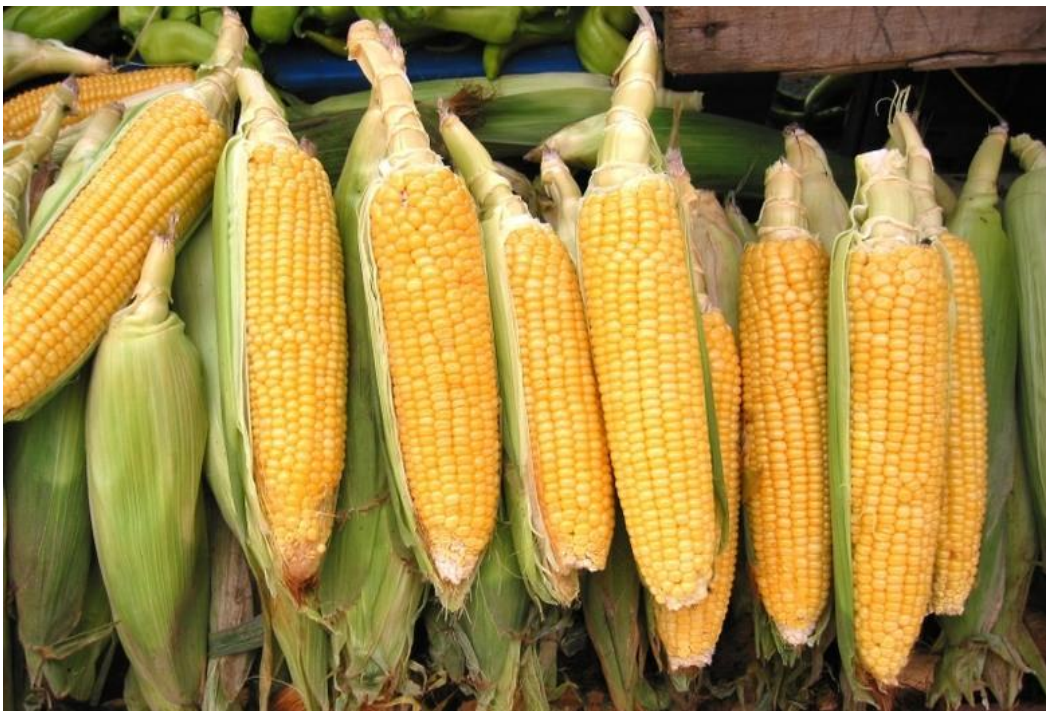
Slika 2: Klipovi kukuruza

Stabljika se sastoji od nodija i internodija, kojih može biti desetak, ali i više (dvadesetak). Kukuruz u tlu može oblikovati do osam nodija iz kojih se etažno razvija sekundarni korijenov sustav. Visina potpuno izrasle stabljike se kreće od svega 50-70 cm kod nekih sorti na krajnjem sjeveru gdje se još uzgaja kukuruz, pa do 6-7 m kod nekih tropskih vrlo kasno-zrelih formi kukuruza. Kod nas se visina stabljike kreće od oko 1 m kod nekih populacija iz brdsko-planinskih područja, pa do 1,5-2,5 m kod najkasnijih hibrida u nizinskim područjima.