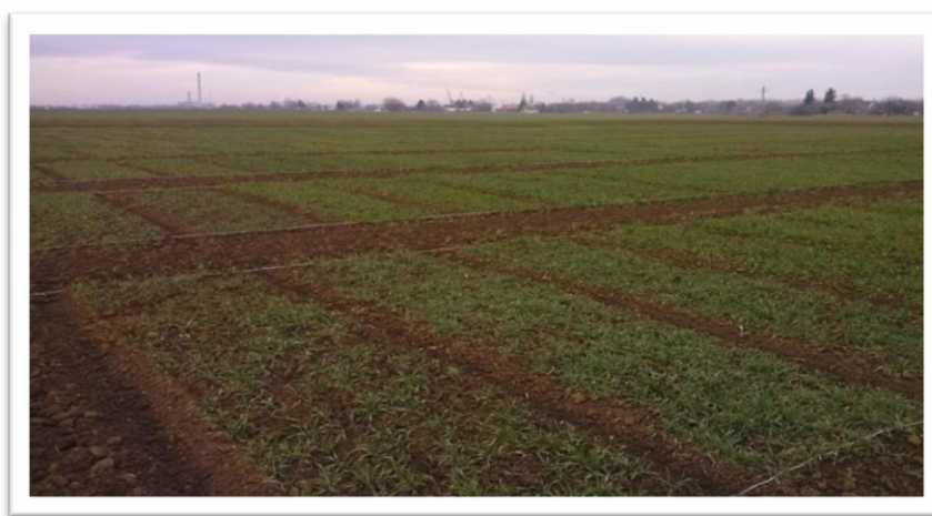
Slika 13. Poljski pokus tijekom nicanja pšenice

Poljski pokus (slika 13) je proveden tijekom 2013./2014. vegetacijske godinu na lokaciji Nemetin kod Osijeka. U sklopu Uspostavnog projekta Hrvatske zaklade za znanost “Creating wheat for the future – quest for the new genes in the old gene pool”. Pokus je zasijan 15. listopada 2013. godine. Svaka sorta posijana je na osnovnu parcelu dužine 5 m, širine 1,25 m, s površinom od 6,25 m 2 . Razmak između redova bio je 12,5 cm. Provedena je standardna agrotehnika za pšenicu.