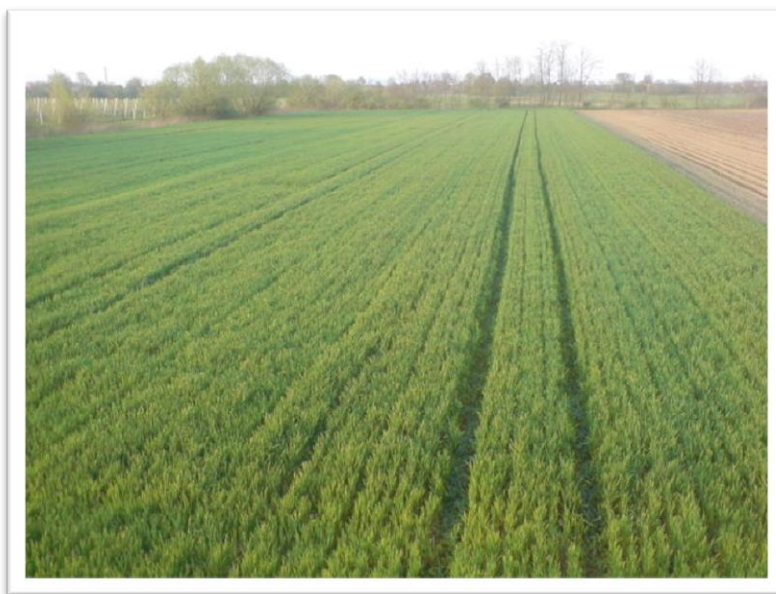
Slika 2. Sorta Žitarka

Sorta Žitarka (slika 2) jedna je od najraširenijih sorti ozime pšenice u proizvodnji u Republici Hrvatskoj. Kvalitetna krušna sorta, vrlo je stabilna po urodu i kakvoći, tolerantna prema najrasprostranjenijim bolestima i jedna od najotpornijih sorti prema polijeganju. Dobro reagira visinom uroda i kakvoćom na bogatu gnojidbu pogotovo dušikom.