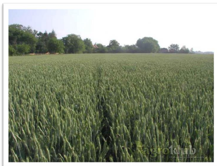
Slika 10. Sorta Sana

Sorta Sana (slika 10) srednje je rana sorta. Vrlo dobre otpornosti na niske temperature, vrlo dobre otpornosti na sušu i polijeganje. Dobro je otporna na rasprostranjene bolesti pšenice.