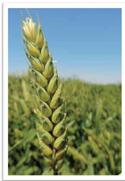
Slika 4. Sorta Lucija ( www.poljinos.hr )

Ozima pšenica Lucija (slika 4) je visoko rodna i kvalitetna sorta dobre otpornosti prema polijeganju. Tolerantna je prema niskim temperaturama i brzo se oporavlja nakon zime, tolerantna je prema najrasprostranjenijim bolestima, visoke urode zrna ostvaruje temeljem velikog broja rodnih klasova po jedinici površine.