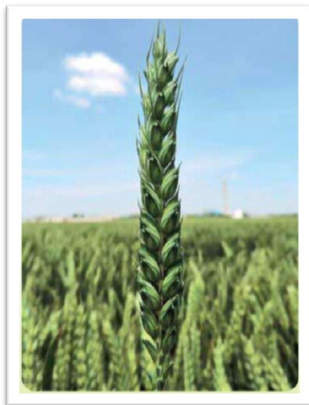
Slika 7. Sorta Katarina ( www.poljinos.hr )

Ozima pšenica Katarina (slika 7) srednje je rana sorta i visoko rodna. Kvalitetna je krušna sorta, dobre je tolerantnosti na polijeganje, tolerantna je na niske temperature i rasprostranjene bolesti pšenice.