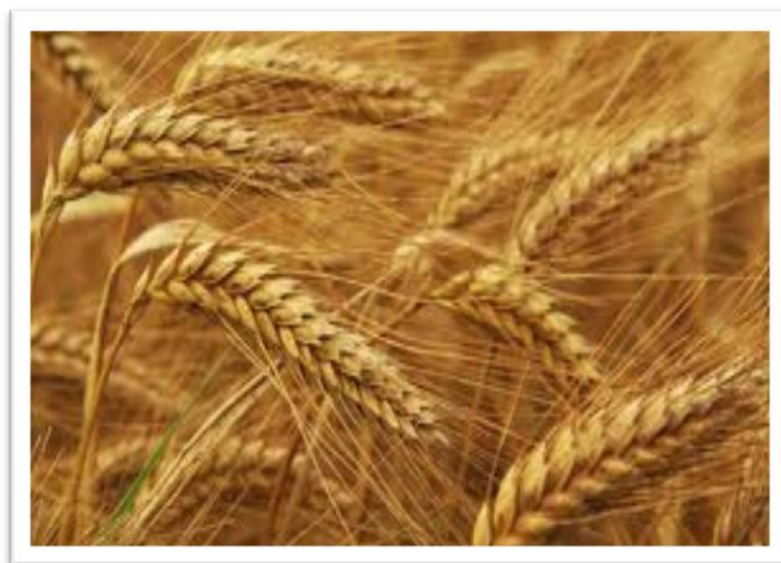
Slika 1. Pšenica

Pšenica ( Triticum spp.) je prva žitarica koju su ljudi počeli uzgajati. Potječe iz Azije, područja poznatog kao Fertile Crescent. Najraniji arheološki dokazi o uzgoju pšenice potječu iz Turske i sa Bliskog Istoka.