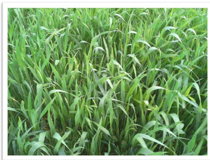
Slika 5. Sorta Renata

Ozima pšenica Renata (slika 5), dobre je otpornosti prema polijeganju, visokorodna i kvalitetna sorta. Tolerantna je prema niskim temperaturama i brzo se oporavlja nakon zime, tolerantna je prema najrasprostranjenijim bolestima, visoke urode zrna ostvaruje temeljem velikog broja rodnih klasova po jedinici površine.