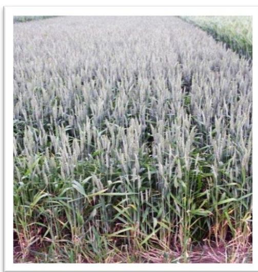
Slika 6. Sorta Felix ( www.semenarna.si )

Ozima pšenica Felix (slika 6), visokorodna i kvalitetna sorta tolerantna je prema niskim temperaturama i najrasprostranjenijim bolestima pšenice, vrlo dobre je otpornosti prema polijeganju i osipanju zrna u klasu.