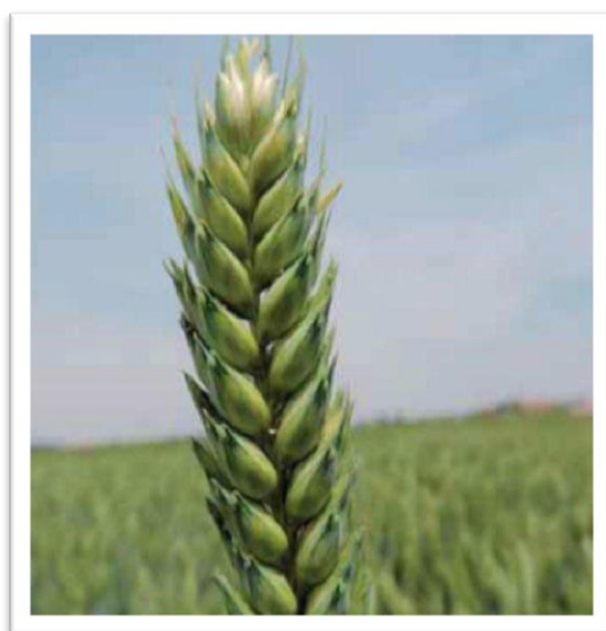
Slika 8. Sorta Alka

Ozima pšenica Alka (slika 8) visoko je rodna sorta, dobre kakvoće. Posjeduje dobru tolerantnost na polijeganje, tolerantna je prema niskim temperaturama i rasprostranjenim bolestima pšenice. Vrlo dobro busa.