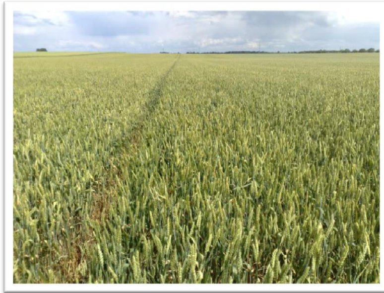
Slika 3. Sorta Srpanjka ( www.poljoprivredni-forum.biz )

Ozima pšenica Lucija (slika 4) je visoko rodna i kvalitetna sorta dobre otpornosti prema polijeganju. Tolerantna je prema niskim temperaturama i brzo se oporavlja nakon zime, tolerantna je prema najrasprostranjenijim bolestima, visoke urode zrna ostvaruje temeljem velikog broja rodnih klasova po jedinici površine.