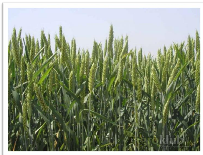
Slika 9. Sorta Bc Elvira

Bc Elvira (slika 9) srednje je kasna sorta. Dobre je otpornosti na niske temperature, vrlo dobro otporna na sušu i polijeganje. Dobre je otpornosti na rasprostranjene bolesti pšenice.