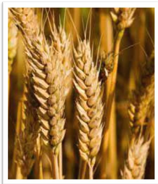
Slika 11. Sorta Seka

Sorta Seka (slika 11) ozima je pšenica, rana, visokorodna sorta, kvalitetna krušna sorta. Tolerantna je prema niskim temperaturama i najrasprostranjenijim bolestima pšenice, posjeduje i dobru otpornost prema polijeganju.