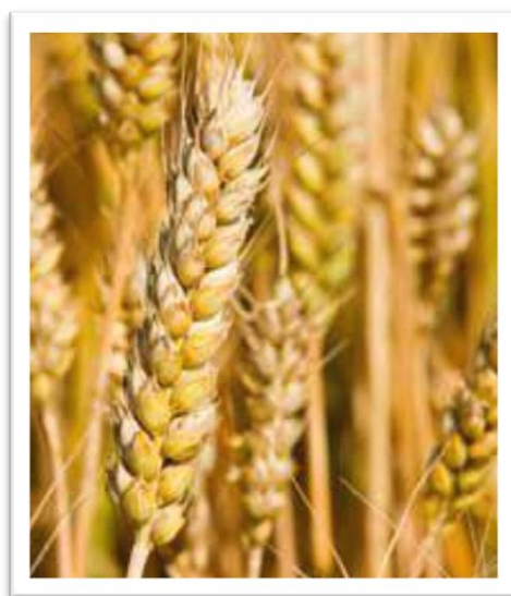
Slika 12. Sorta Super Žitarka

Sorta Super Žitarka (slika 12) srednje je rana sorta. Visoko rodna i kvalitetna krušna sorta. Odlične je otpornosti na polijeganje, posjeduje i vrlo dobru otpornost prema niskim temperaturama i rasprostranjenim bolestima pšenice. Posjeduje i vrlo dobru otpornost prema osipanju zrna u klasu. Ima izraženu dormantnost sjemena.