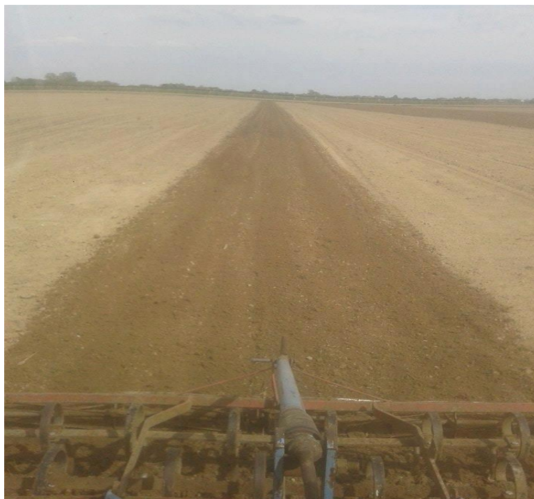
Slika 2. Sjetva kukuruza na istraživanom OPG-u