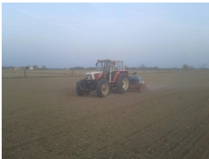
Slika 11. Sjetva djetelinsko travnih smjesa za pašu