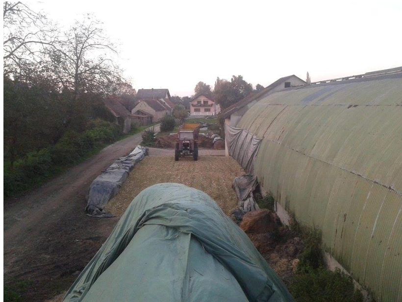
Slika 4. Silaža kukuruza na istraživanom OPG-u