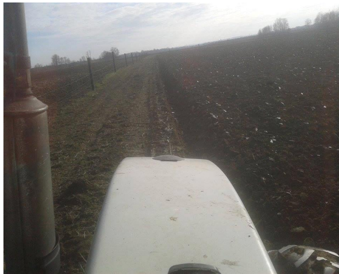
Slika 10. Oranje pašnjaka na istraživanom OPG-u