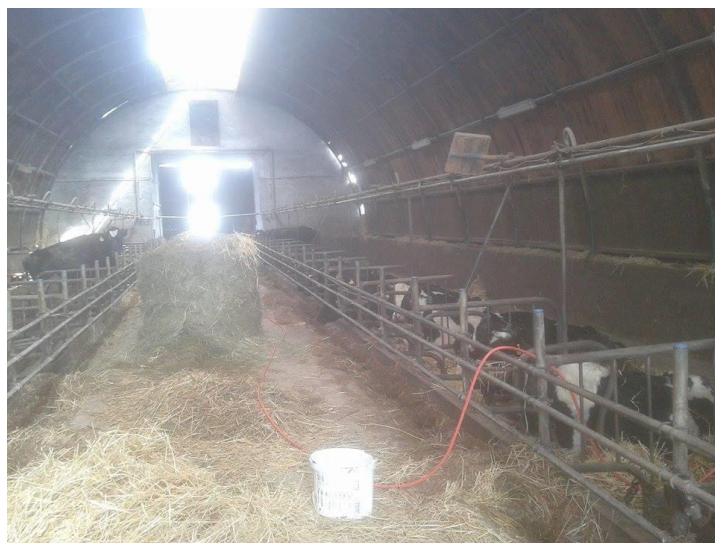
Slika 12. Muzne krave na istraživanom OPG-u

Za stelju se koristi slama koju dobivaju od okolnih ratara. Izgnojavanje je ručno, pošto su krave stalno slobodne, nema puno stajskog gnoja za čišćenje.