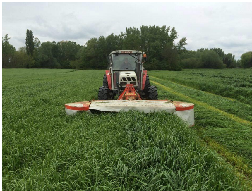
Slika 6. Košnja talijanskog ljulja na istraživanom OPG-u