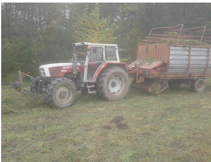
Slika 7. Sjenaža na istraživanom OPG-u