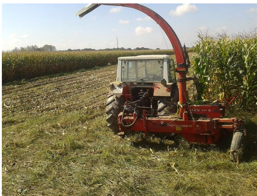
Slika 3. Siliranje kukuruza na istraživanom OPG-u