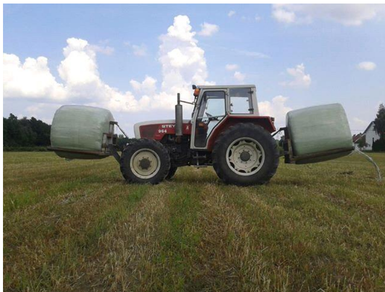
Slika 8. Bale sjenaže na istraživanom OPG-u