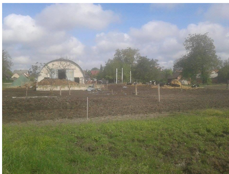
Slika 13. Ispust zasušenih krava i junica na istraživanom OPG-u