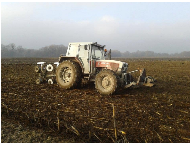
Slika 5. Zaoravanje stajskog gnoja na istraživanom OPG-u