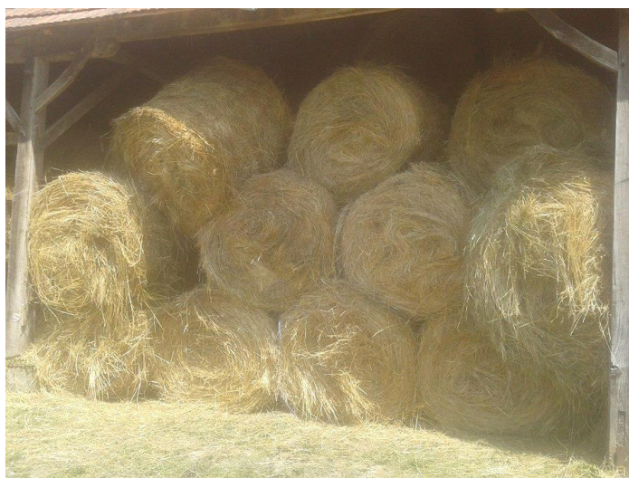
Slika 9. Držanje sijena na istraživanom OPG-u