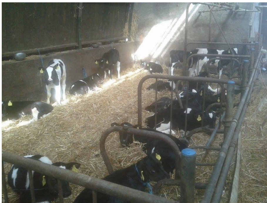
Slika 14. Držanje teladi na istraživanom OPG-u

Na farmi se odgajaju junice za remont stada. Također, na farmi se drži jedan odabrani bik za pripust na krave i junice koje ne ostanu steone nakon 3 oplodnje, a ostala junad se prodaje.