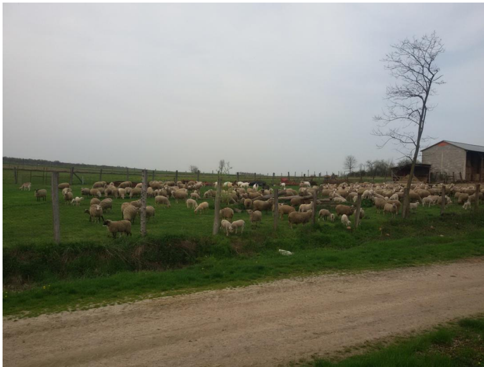
Slika 1: Farma ovaca u Novim Perkovicima

Ovce su danas najzastupljenije u tovnom uzgoju radi njezinog vrlo kvalitetnog i ukusnog mesa. Manje se koristi ovčje mlijeko, a još manje ovčja vuna. Upravo je ovčja vuna ta koja stvara uzgajivačima problem, jer se vuna nažalost ne prerađuje kao što se nekada to radilo. Uzgajivači nemaju kuda s ostriženom vunom. Vuna ovaca je vrlo specifična sirovina. Vuna su meke, nježne dlake, proteinska vlakna. Za razliku od krzna drugih životinja puna je sumpora. Vuna ne gori i nije zapaljiva nego se odmah pretvori u ugljen. Sumpor koji se izgaranjem oslobodi je jako štetan za zrak, tlo, vodu. Zbog toga se vuna ne smije paliti, a nije razgradiva pa se ne smije niti odlagati, niti zatrpavati u prirodu. Uzgajivači nakon što ostrižu ovce ne znaju kuda s njom. Otkupljivača je jako malo i cijena je vrlo niska. Nije rijetkost da se zbog tako niske cijene uzgajivači ipak odluče riješiti vune na neekološki način.