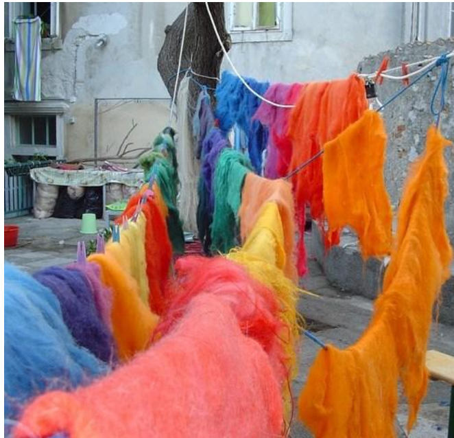
Slika 8: Sušenje obojane filcane vune

Kulturno umjetničko društvo „Branimir“ iz Benkovca i Zavičajna udruga „Hraštenić“ iz Reštevica održali su radionicu o filcanju vune. Filcanje vune je tehnika čvrstog uplitanja i ispreplitanja vunениh niti pomoću topline, sapuna i mehaničke sile. Vuna se opere, odvoji od nečistoća, počešlja, a zatim se kvasi u vodi sa sapunom, pa se valja kako bi dobili što čvršću strukturu. Vlakena se međusobno zapletu i stvore gusti materijal koji nazivamo filc ili pust. Filcana vuna jako je dobar materijal jer se i danas nose odjevni predmeti načinjeni od take vune: torbe, marame, kape, šeširi itd.