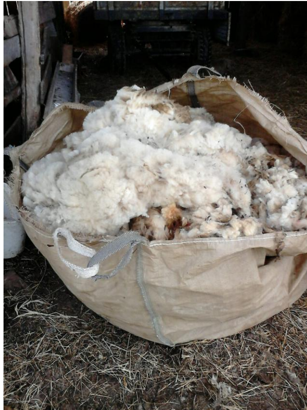
Slika 4: Ostrižena ovčja vuna