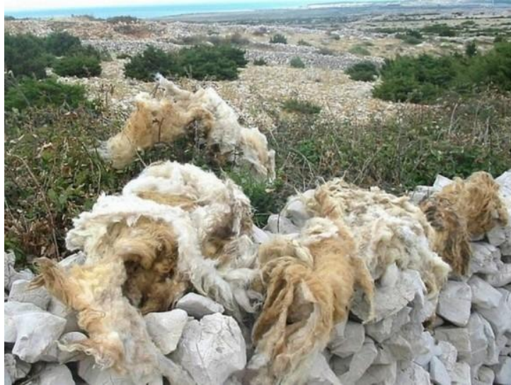
Slika 3: Odbačena vuna na otoku Braču