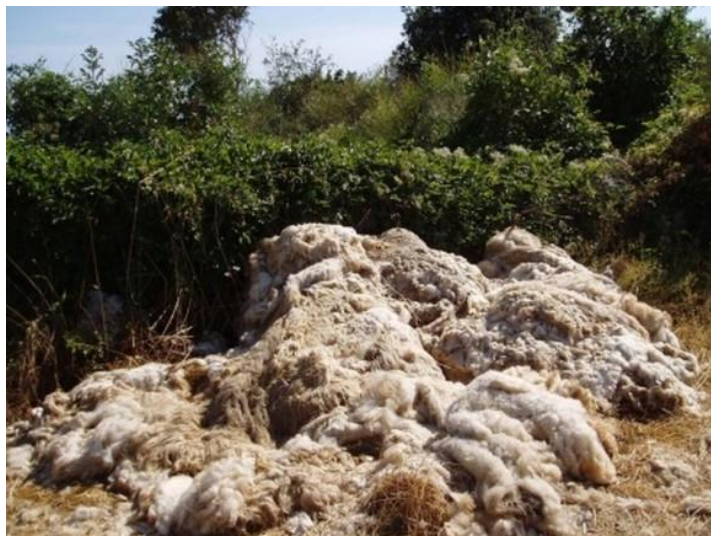
Slika 2: Odbačena vuna u prirodi

U Republici Hrvatskoj ima oko 650.000 ovaca. Godišnje dobijemo oko 1.000 tona ostrizene vune koja završava na deponijima. Nije rijetkost da uzgajivači vunu odbace u prirodu: na livade, pokraj šume, uz more, u odvodne kanale, bare ili pak zakopaju u zemlju. Time se zagađuju okoliš i narušava zdravlje ljudi. Pranje ovčje vune u kemikalijama koje s otpadnim vodama odlaze u tlo gdje zagađuju podzemne vode. U standardnom pranju vune potroši se oko 120 litara vode koja na kraju završi u tlu i šteti prirodi.