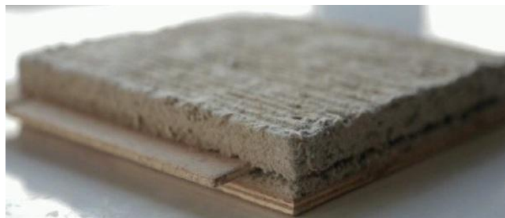
Slika 6: Prešani izolacijski materijal od vune