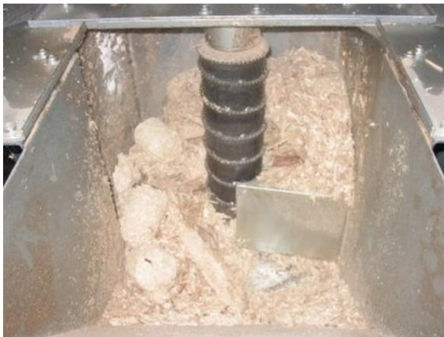
Slika 7: Peletiranje ovčje vune

Također, već spomenuti inovator Damir Remenar od ostataka vune koja ostane nakon pranja prerađuje (peletira) te proizvodi eko gnojivo od vune za poljoprivrednike.