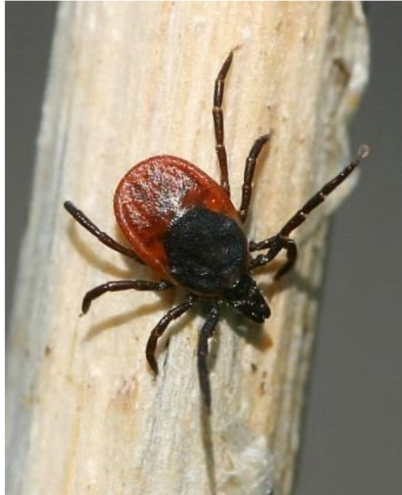
Slika 3. Krpelj

i do 15 mm. Svojim prisustvom i sisanjem krvi kod životinje izazivaju uznemirenost, svrab, oštećenje kože i u težim invazijama slabokrvnost. Osim toga svojim toksinima izazivaju alergijsku reakciju, ali mogu biti i značajni prijenosnici zaraznih bolesti.“ (Florijančić, 2001.)