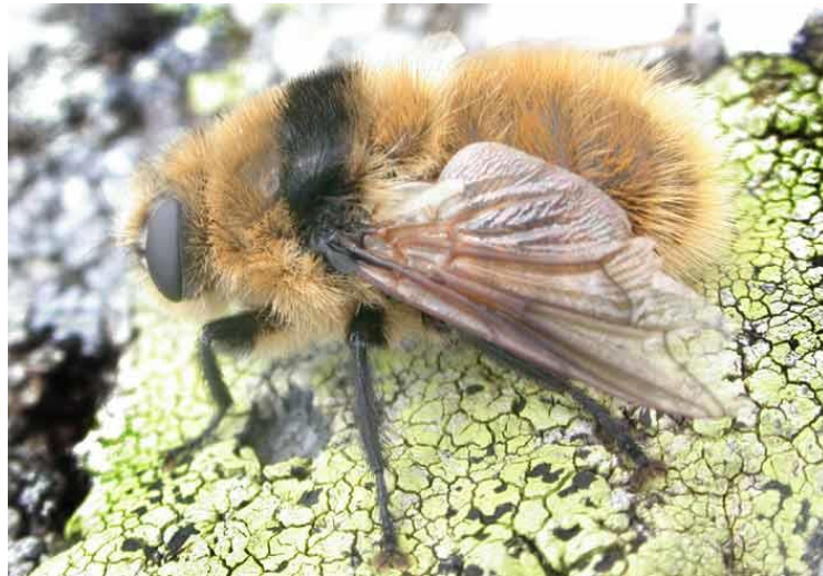
Slika 4. Odrasli stadij štrka

Štrkovi spadaju u porodicu Oestridae i po svom izgledu slični su divljoj pčeli. Tijelo im je prekriveno dlačicama, odlični su letači, a usni aparat im je nije u funkciji (nije razvijen kao u drugih insekata) pa zbog toga u stadiju insekta kratko žive. Ovu kratkoću života u stadiju insekta nadoknađuju dugim životom u svojim razvojnim stadijima, kao ličinke. U stadiju ličinke provode vrlo dugo razdoblje kod različitih životinjskih vrsta. Kod divljih životinja u našim lovištima najčešće parazitiraju u srnećoj i jelenskoj divljači. S obzirom na mjesto parazitiranja dijelimo ih na nosne i kožne štrkove.