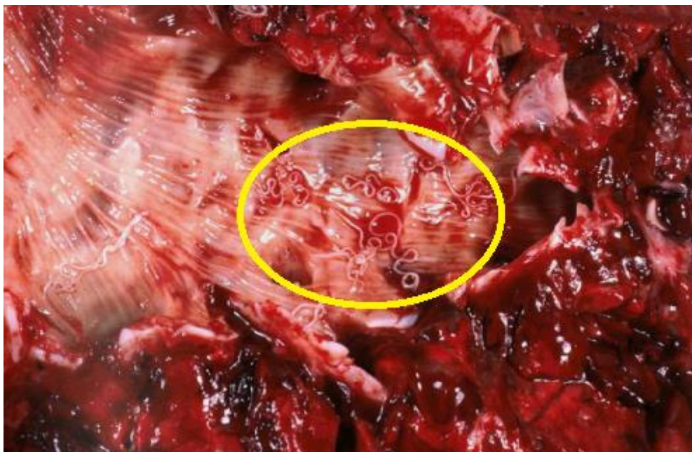
Slika 6. Uzročnik diktiokauloze ( Dictyocaulus viviparus )

Diktiokauloza ( Dictiocaulosis ) je invazijska bolest dišnog sustava jelena običnog, uzrokovana oblicima iz razreda Nematoda i roda Dictiocaulus , a koje još zovemo veliki plućni vlasci. Vrsta koja parazitira u tijelu jelena običnog je D. viviparus , duljine je 60-80 mm;