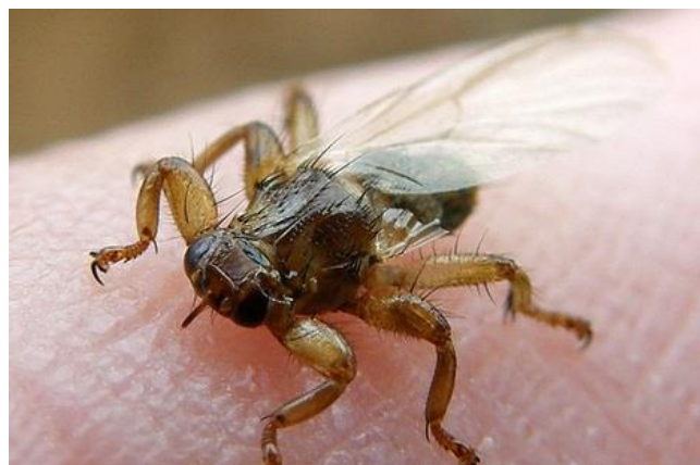
Slika 2. Jelenska uš

Lipoptena cervi ili jelenska uš spada u porodicu Hippoboscidae. Zajednički je hematofagni ektoparazit jelena običnog ( Cervus elaphus L. ), jelena lopatara ( Dama dama ) i srne ( Capreolus capreolus ). Originalni nositelj na području Euroazije je jelen obični ( Cervus elaphus L. ), stoga se kod drugih vrsta javlja u nešto nižem postotku.