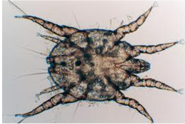
Slika 1. Uročnik šuge (šugarac)