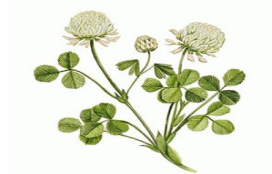
Slika 1: Bijela djetelina ( Trifolium repens L.), ( http://iknowlegumes.com/White-clove )

Rod Trifolium uključuje više od 250 vrsta od kojih su 10 od važnog agronomskog značenja (Zohary i Heller 1984.). Bijela djetelina se nalazi u podvrsti Lotoidea zajedno s ostalim višegodišnjim djetelinama Trifolium hybridum i Trifolium ambigum . Centri rasprostranjenosti za bijelu djetelinu nalaze se na zapadnom Mediteranu, istočnoj Africi i južnoj Americi (Zohary i Heller 1984.). Prema Ellison i sur. 2006. utvrđeno je da je u ranom miocenu otkriveno porijeklo gena roda Trifolium . Ovaj istraživački rad također dokazuje da su Trifolium pallescens i Trifolium occidentale diploidni preci alotetraploida bijele djeteline. Taksonomija i biosistematika bijele djeteline opisana je u istraživanju Williams (1987.), te molekularna filogenija roda (Ellison i sur. 2006.). Karakterna osobina bijele djeteline je u njoj građi stabljike koja se sastoji od mreže stolona. Zahvaljujući građi stabljike bijele djeteline ona je otporna na defolijaciju i druge stresove (pohranjivanje zaliha-ugljikohidrati) stoga je time izražena njena učinkovitost i kompatibilnost sa travama u rano proljeće.