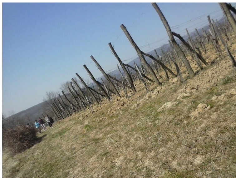
Slika 14: Novi vinograd