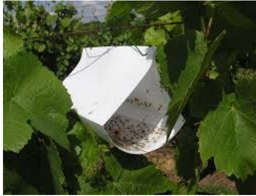
Slika 16: Feromonski mamac u vinogradu