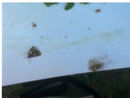
Slika 17: Pepeljasti grozdov moljac na feromonskom mamcu