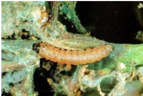
Slika 4: Gusjenica sivog grozdovog moljca