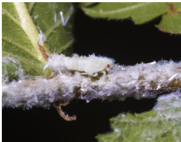
Slika 9: Štete od medećeg cvrčka