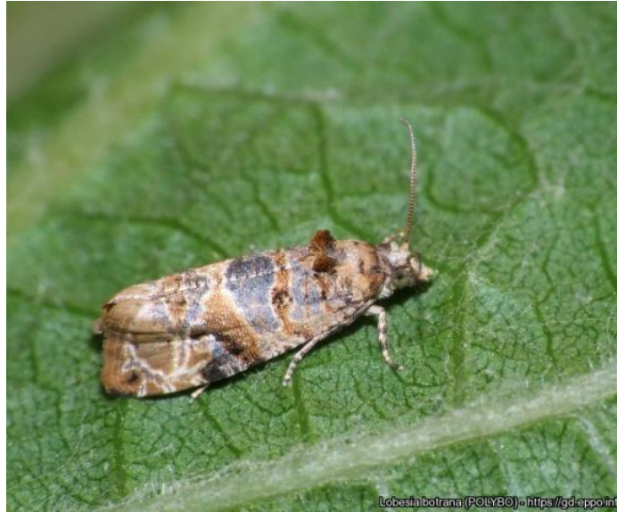
Slika 3: Pepeljasti grozдоб moljac