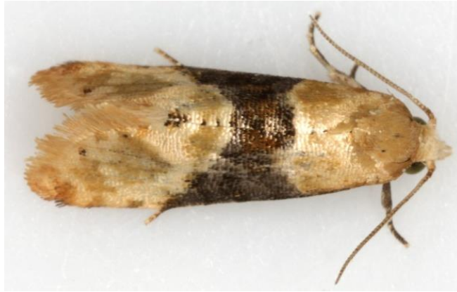
Slika 1: Žuti grozdov moljac