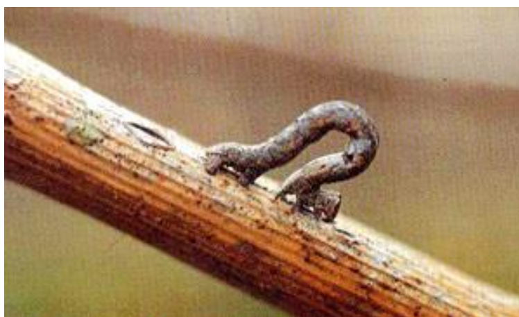
Slika 10: Gusjenica grbe korak

Pomoću feromonskih mamaca možemo prognozirati pojavu štetnika u idućoj godini. Feromonske mamce treba postaviti prije početka leta leptira, početkom svibnja. Međutim to je samo pokazatelj kolika će jačina napada biti u proljeće. Suzbijanje insekticidima se može vršiti za vrijeme zimskog tretiranja. U vegetaciji se mogu koristiti insekticidi koje koristimo za suzbijanje grozdovih moljaca.