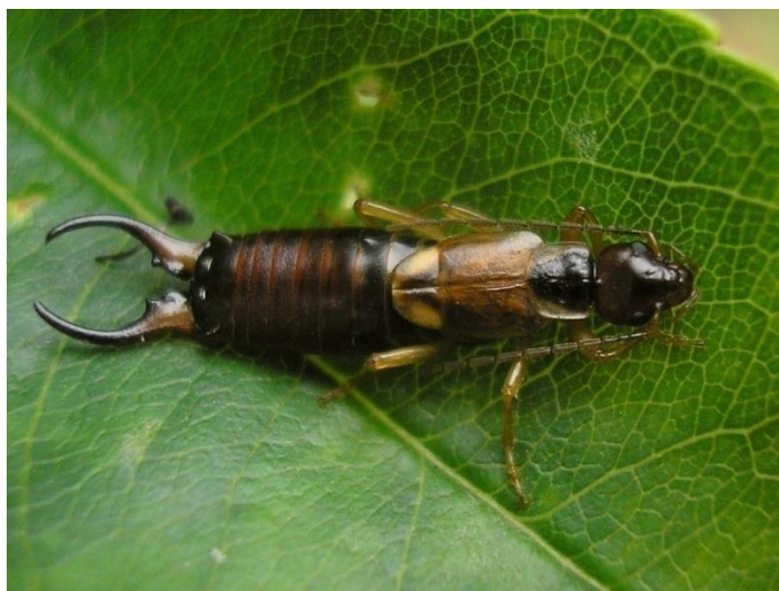
Slika 12: Uholaza