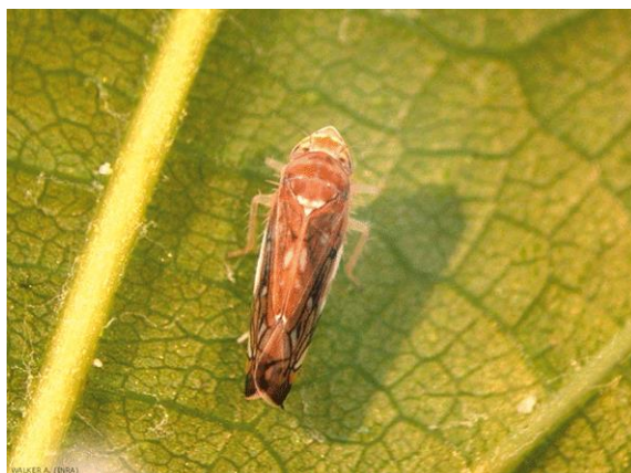
Slika 11: Američki cvrčak