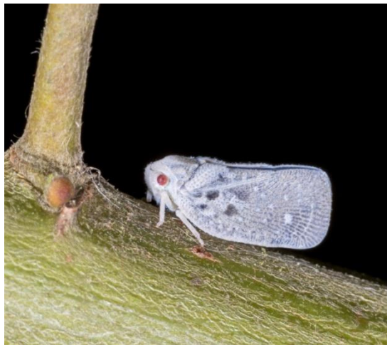
Slika 8: Medeći cvrčak

Pošto se štetnik širi i sadnim materijalom, važno je spriječiti uvoz sadnoga materijala iz rasadnika zaraženih medećim cvrčkom. Štetnik se suzbija insekticidima na osnovi djelatne tvari alfacipermetrin (piretroidi). Osim insekticidima medećeg cvrčka moguće je suzbiti i prirodnim neprijateljima. Prirodni neprijatelji kojima se suzbija medeći cvrčak su parazitne osice Neodrynus typhlocybae (Maceljski i sur., 2006.).