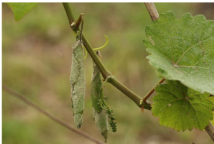
Slika 7: Cigaraš

Cigaraš se lako suzbija uklanjanjem smotuljaka i njihovim uništavanjem. Tim postupcima se smanjuje brojnost štetnika u idućoj godini. Moguće je suzbijanje odraslih pipa u proljeće prije nego što počnu praviti smotuljke. Po potrebi može se kemijski suzbijati insekticidima na bazi alfacipermetrina (Maceljski i sur., 2006.).