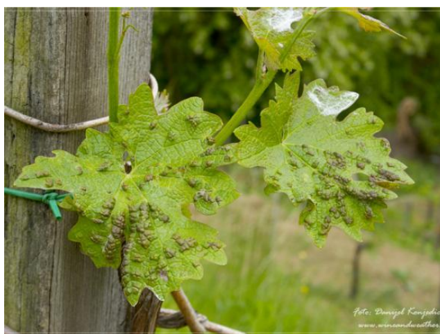
Slika 5: Simptomi grinja šiškarica

Lozine grinje šiškarice se mogu unijeti u nasad sadnim materijalom pošto prezimljuju u pupovima loze. Pojava grinja se može pratiti redovnim pregledom pupova i stavljanjem ljepljivih traka. Ljepljive trake se postavljaju oko reznika i na početak lucnja tik prije početka bubrenja pupova. Pomoću povećala se mogu vidjeti zaljepljene grinje. Kemijskim putem lozine grinje šiškarice mogu se suzbijati na dva osnovna načina: ranim proljetnim (zimskim) tretiranjem i tretiranjem početkom vegetacije. Ranim proljetnim tretiranjem suzbijaju se grinje koje se nalaze u pupu. Za rano proljetno tretiranje koriste se Biljno ulje i Crveno ulje. Za suzbijanje grinja tokom tretiranja početkom vegetacije koriste se insekticidi na bazi sumpora i akaricidi na bazi tebufenpirada (Maceljčki i sur., 2006.).