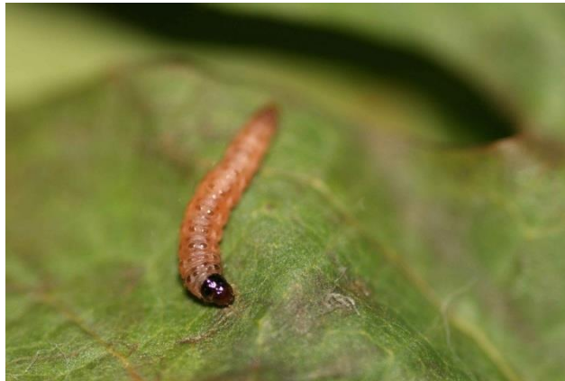
Slika 2: Gusjenica žutog grozdovog moljca