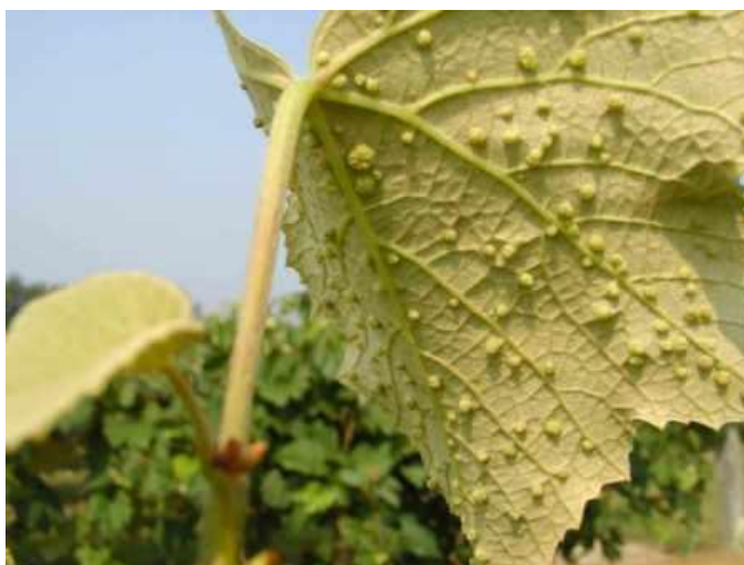
Slika 6: Simptomi filoksere

U matičnjacima američke loze filoksera se suzbija zimskim tretiranjem u vrijeme mirovanja vegetacije. Suzbija se sredstvima na bazi mineralnih ulja i bakra. Na cijepljenoj lozi nije potrebno suzbijanje (Kišpatić i Maceljki, 1984.)