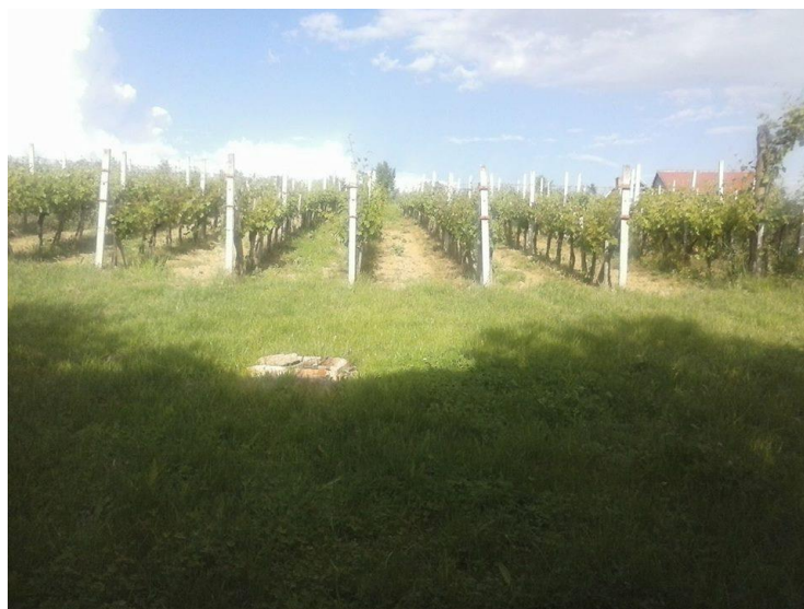
Slika 13: Stari vinograd

Zbog velike količine oborina i vlage, ali i izrazito vrućih dana pojava bolesti u 2016. godini u vinogradima je bila učestalija. U tablici 1. su prikazane mjere zaštite vinove loze primjenjene u 2016. Godini.