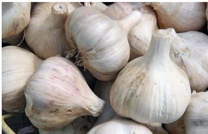
Slika 1. Slavonski češnjak

Češnjak je jednogodišnja ili dvogodišnja biljka koja formira lukovice, a lukovica se sastoji od više češnjeva koji daju novu biljku a jestivi su dio češnjaka. Češnjeve obavija čvrsta ljuska koja ih štiti od oštećenja i gubitka vode. Prepoznatljivi neugodan miris češnjaka dolazi od alilsulfida.