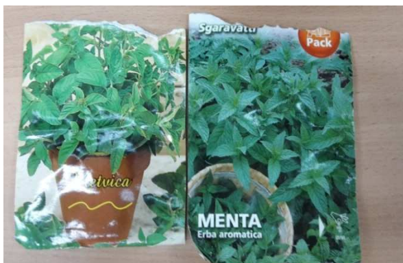
Slika 25. Vrećice sa sjemenom metvice

Berba i vaganje svježe zeleni (Slika 27.) je obavljena 12. kolovoza 2014. između 10 i 15 sati. Nakon određivanja svježe mase, biljke su stavljene na sušenje prirodnim putem. Osušena masa je vagana 25. kolovoza 2014. godine (Slika 30.) digitalnom vagom (Kern & Sohn), a metvica se prije toga sušila ispod nadstrešnice u sjeni i na vjetru u papirnatim vrećicama kako bi se sačuvala njena ljekovitost. (Slika 29.)