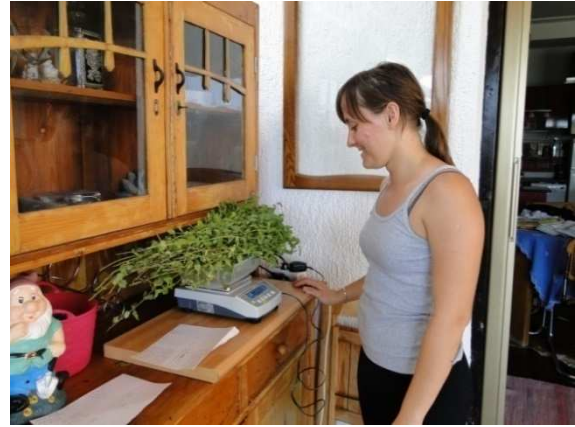
Slika 29. Sušenje metvice u papirnatim vrećicama i vaganje