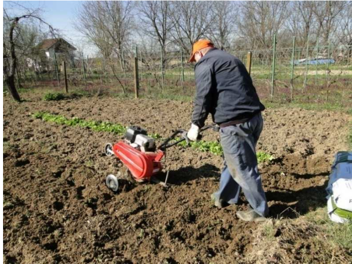
Slika 11. Obrada tla prije sjetve metvice