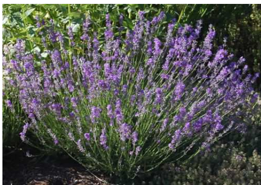
Slika 1. Lavanda (www.proteka.hr)

Porodica Lamiaceae je bogata fitokemijskim svojstvima te se mnoge vrste koriste kao ljekovite i začinske biljke. Biljke koje se koriste u narodnoj medicini i kao začini su: ljekovita kadulja ( Salvia officinalis L.) (Slika 3.), trava iva ( Teucrium montanum L.), bosiljak ( Ocimum basilicum L.), mažuran ( Majorana hortensis Moench), ružmarin ( Rosmarinus officinalis L.), origano ( Origanum vulgare L.), čubar ( Satureja hortensis L.), lavanda ( Lavandula angustifolia Mill.) (Slika 1.), timijan ( Thymus vulgaris L.), matičnjak ( Melissa officinalis L.) (Slika 2.) i metvica ( Mentha spicata L.) (Nikolić, 2013.).