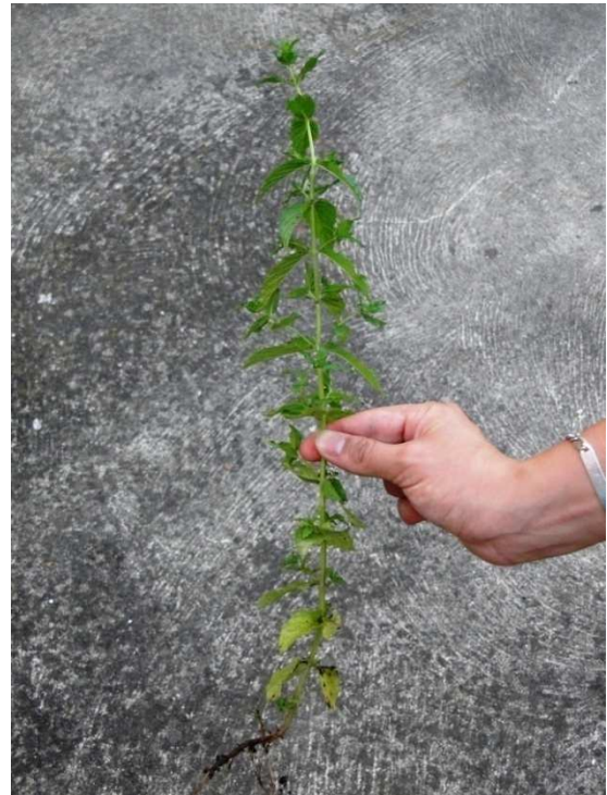
Slika 5. Mentha spicata L.