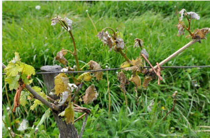
Slika 2. Šteta načinjena pojavom mraza na vinovoj lozi

Advektivno-radijacijski mrazevi javljaju se uslijed prodora hladnog zraka i hlađenja zemljine površine tijekom vedre noći, odnosno uslijed djelovanja dva fizička procesa, a to su advekcija i radijacija.