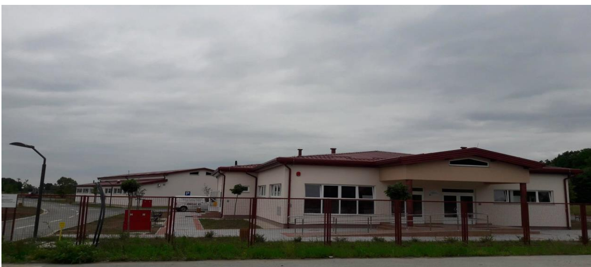
Slika 6. Upravna zgrada PPID