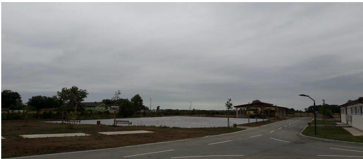
Slika 8. Izložbeni prostor, natkriveni prostor za stoku te interne prometnice i parkiralište