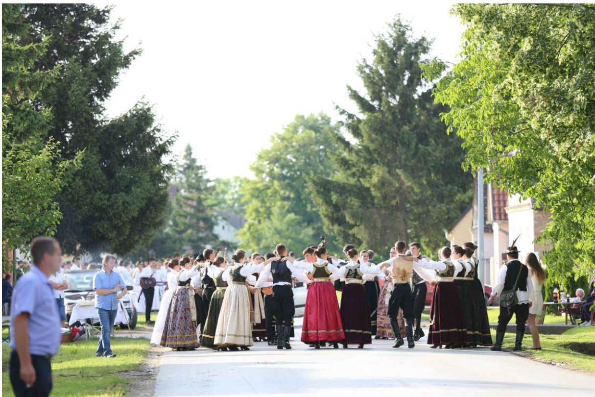
Slika 5. Raspjevana Cvelferija (Drenovci, lipanj 2015.)