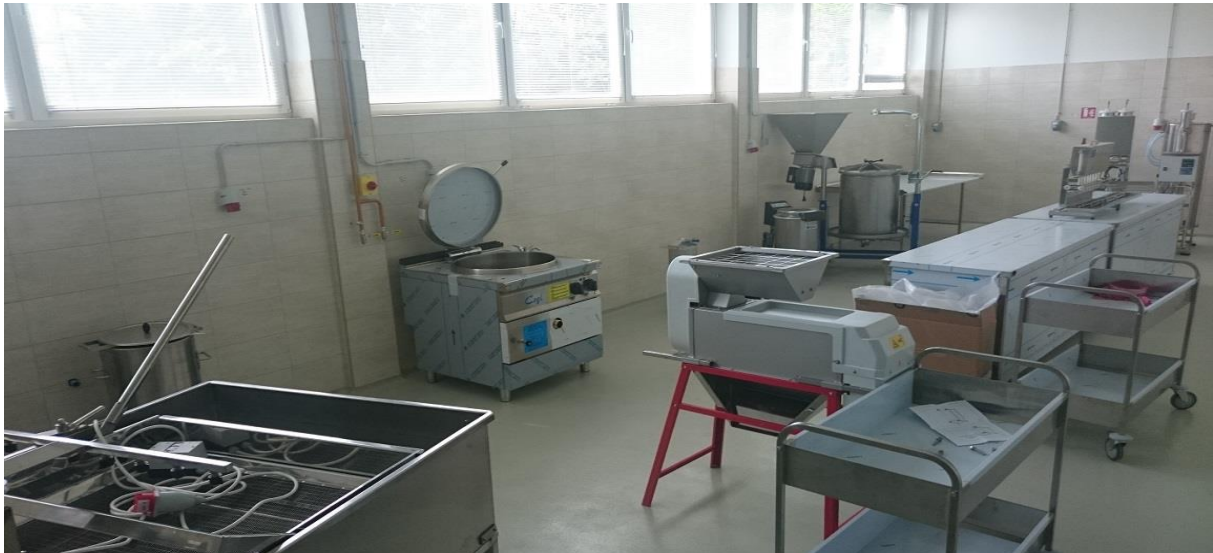
Slika 7. Proizvodna linija u višenamjenskoj hali