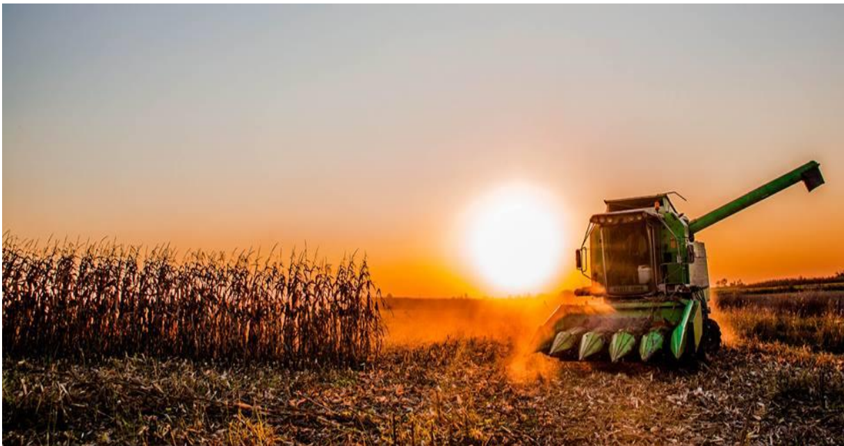
Slika 3. Žetva kukuruza na području Soljana, listopad 2015.

Područje LAG-a Šumanovci posjeduje visoko vrijedne potencijale za razvoj ruralnog turizma. Cjelokupna raskoš i bogatstvo te ljepota izvornih slavonskih običaja, nošnji, kulturne baštine, folklor, narodnog stvaralaštva, ljepote krajobraza, očuvanje tradicionalnih običaja i svega ostaloga čime se ljudi ovog kraja već stoljećima ponose utkano je u kulturno-zabavne, sportske i turističke manifestacije. Manifestacije su popraćene izložbama i nastupima majstora starih zanata, a posebno tradicijskim rukotvorinama. Ove tradicijske djelatnosti sve češće su izvor zarade za lokalno stanovništvo, a vrijedan su element turističke ponude ovog kraja. Izraziti su potencijali rijeke Save, te za različite oblike ponude smještaja u tradicijskom seoskom ambijentu s elementima netaknute prirode. Biciklistička ruta Eurovelo 6 prolazi kroz LAG što je pogodnost za razvoj ciklo turizma. Mogućnosti za ulaganja su prepoznate od strane lokalnog stanovništva što je povećalo interes za ulaganja u razvoj različitih oblika ruralnog turizma. Interes postoji i za druge oblike ulaganja u nepoljoprivredne djelatnosti kao što su radionice za održavanje tradicionalnih zanata i usluge mehanizacije.