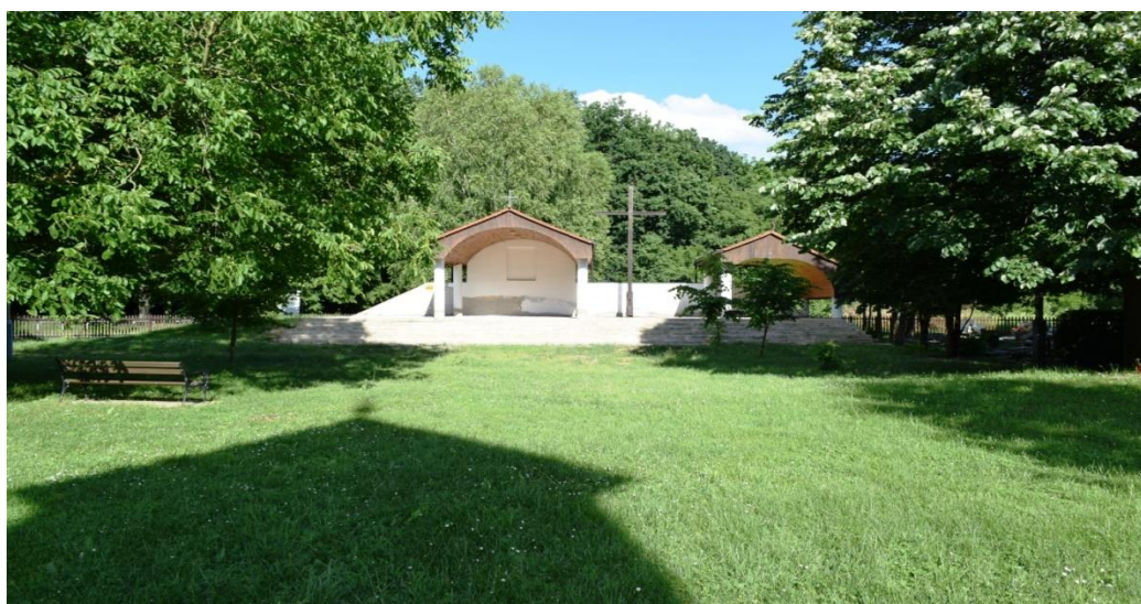
Slika 2. Svetište Šumanovci

Nematerijalnu kulturnu baštinu prvenstveno čini šokačka tradicija s bogatom folklorno-tradicijskom i etnološkom vrijednošću koju njeguju i promoviraju kulturno-umjetnička društva registrirana na području LAG-a, ali i brojne kulturno-tradicijske manifestacije poput Šokačkog sijela , Kruh naš svagdanji – žetve i vršidbe u prošlosti , Raspjevane Cvelferije i drugih . Na području LAG-a Šumanovci nalazi se najstarije svetište u Vukovarsko-Srijemskoj županiji – Svetište Majke dobre nade – Šumanovci po kojem je LAG i dobio ime, ali i brojne crkve te groblja sa značajnom povijesno-kulturnom vrijednošću od kojih su neke i zaštićene kao nepokretni spomenik kulture.