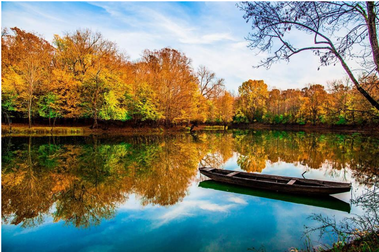
Slika 4. Rijeka Studva, rujan 2015.