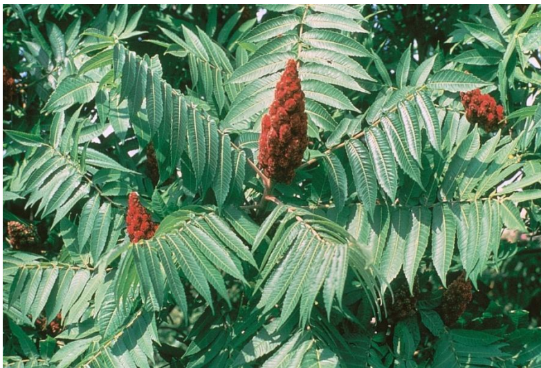
Slika 26. List i plod Rhus typhina

Listovi su naizmjenični, dugi do 50 cm, neparno perasti, sastavljeni od mnogih lancetastih, dugo ušiljenih i grubo pilastih lisaka, na licu su zeleni, naličje je sivozeleno(Slika 26.).