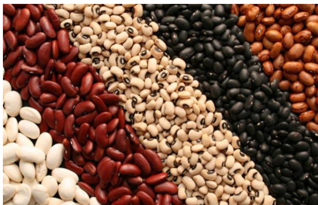
Slika 1. Sjemenka graha

Grah je vrlo ljekovita biljka, smatra se da štiti od raka, smanjuje količinu šećera u krvi i mokraći, jača imunitet, regulira krvni tlak itd.