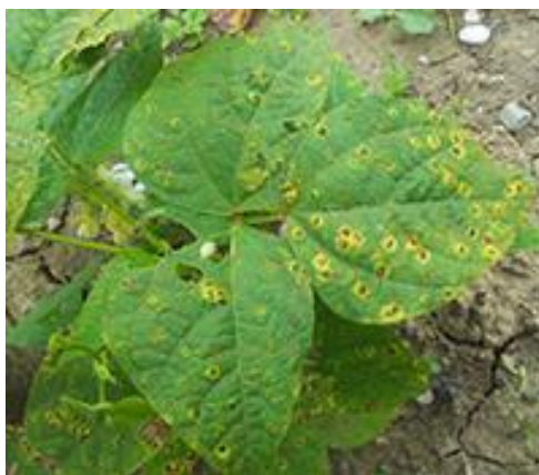
Slika 8. Hrđa graha