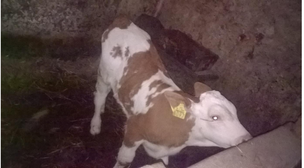
Slika 6. Tele u individualnom boksu na gospodarstvu

pet dana telad se hrani kolostrumom na gospodarstvu. Nakon toga vlasnik ih u dobi od dva do tri tjedna hrani mlijekom, ne koristi mliječnu zamjenu zbog niske cijene mlijeka. Kroz razdoblje od 15 dana i kasnije telad se kreće prihranjivati sijenom i koncentratom kako bi postala preživač nešto ranije od tri mjeseca starosti.