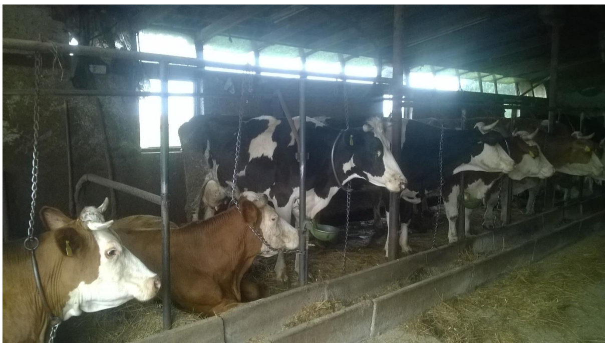
Slika 3. Vezani način držanja krava na gospodarstvu