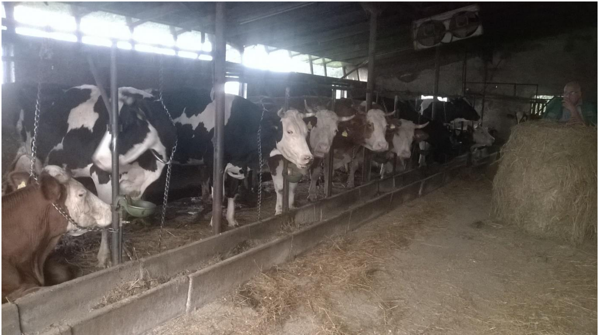
Slika 5. Vlastita slika staje s otvorenom klimom

riješeno sustavom stokiranja gnoja. Gnoj se sezonski izvozi na zemlju. U tijeku je izgradnja lagune za gnoj, s obzirom na afinitete za proširenjem proizvodnje.