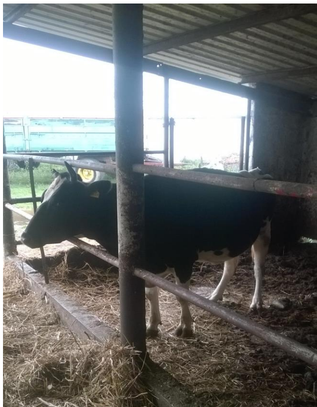
Slika 4. Holstein pasmina na gospodarstvu Šeremešić

intenzitet iskorištavanja. Po svom genotipu, imaju tzv. „plastični genom“ za najglasniju proizvodnju mesa ili mlijeka., ovisno o tržišnim kriterijima. (Caput, 1996)