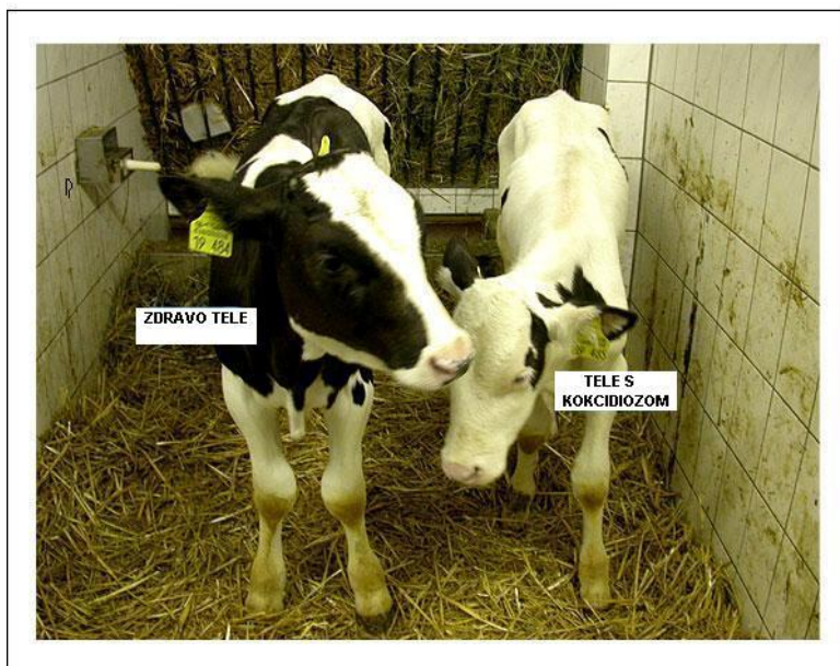
Slika 7. Kokcidioza

tekućom hranom. Između obroka se daje čaj i otopina elektrolita. Najbolje je telad napajati crnim čajem, minimum tri litre dnevno.