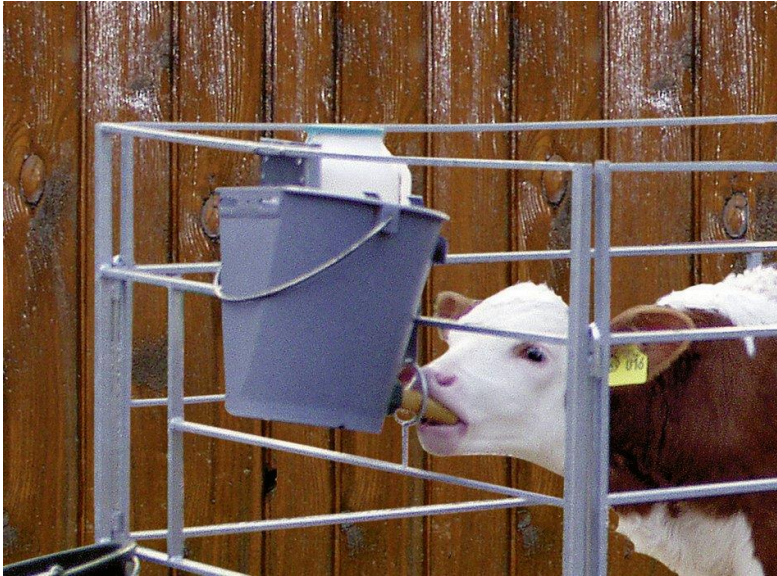
Slika 2. Napajanje teladi