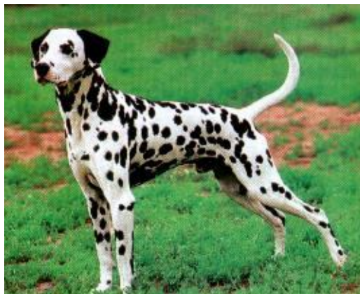
Slika 1. Dalmatinski pas

Dalmatiner (dalmatinac, dalmatinski pas) vrlo je stara pseća pasmina lako prepoznatljiva po bijeloj dlaci s karakterističnim crnim mrljama ili mrljama boje jetre. Živahan, skladno građen, jak i mišićav pas, iako ne grub. Ima vretenasto tijelo. Brz je i uporan. Glava mu je osobita, priljubljenih ušiju, okruglih očiju, potpunog škarastog zubala. Dozvoljena su dva varijeteta: bijeli s crnim točkama i bijeli s jetreno smeđim točkama. Kod crnog oči su tamne, a kod smeđeg smeđe. Sluznice nosa, rubovi očnih kapaka i nokti odgovaraju boji točaka koje su po tijelu veće, a po glavi, nogama i repu manje. Sitne točkice između većih su nepoželjne. Rep je pružen nešto iznad linije leđa, nikad savinut i prebačen prema glavi. Njegovo pjegavo tijelo je već iz daleka oznaka da dolazi nešto posebno (često ga koriste za marketing). Voli trčanje i stoga se dobro osjeća na selu, u velikom vrtu, među djecom ili konjima. Prilagodljiv je i inteligentan pa se preporučuje za pratnju. Lako ga je njegovati i ima izrazito dobar smisao za čistoću. Po prirodi je zdrav, prijatan i osjećajan. Doživi 12 godina.