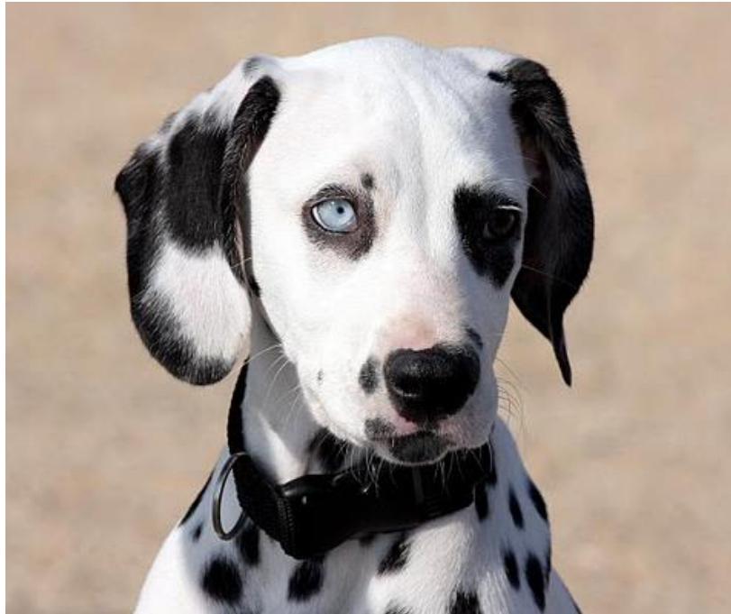
Slika 7. Dalmatinski pas sa plavim okom