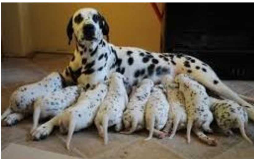
Slika 5. Ženka dalmatinskog psa sa štencima

Skotna ženka štene oko 60 dana (+/- 3). Prvo tjeranje ženki javlja se između šest mjeseci i godinu dana. Prema Uzgojnom pravilniku ženka mora biti stara najmanje 15 mjeseci kako bi ostvarila pravo na leglo s rodovnicama, na izložbi pasa mora biti ocijenjena najmanje ocjenom dobar (3), te je zadovoljila uzgojni pregled. Ženka smije imati jedno leglo na godinu. Kako bi se našao najbolji partner za ženku najbolje se posavjetovati sa komisijom kluba dalmatinskih pasa preko kojega se ostvaruju sva kinološka prava. Dan prije štenjenja ženke često odbijaju hranu i piće. Pri početku prvog štenjenja ženka može biti zbunjena i tražiti da ide van. Nerijetko ženke misle da ih pritiska na obavljanje velike nužde. Prije trudova ženka će ubrzano disati i dahtati. U trenutku truda najčešće leže na boku. Neke ženke kad štene počne izlaziti ustanu i ustima prihvate štene i same maknu posteljicu, pregrizu pupčanu vrpcu, pojedu posteljicu, ustima primaknu štene na sisu i ližu ga. Razmak dolaska na svijet između štenaca može biti i sat vremena pa i više.