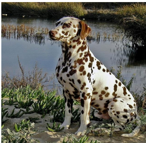
Slika 3. Dalmatinski pas sa smeđim točkama

Ekstremiteti nogu moraju biti proporcionalni sa tijelom, pravilnih kuteva. Ramena: rameni kut iznosi oko 115-120°. Laktovi: dobro priljubljeni uz tijelo. Podlaktica: kosti proporcionalno razvijene i snažne (oble), prednje noge u stavu ravne. Podlaktica okomita. Došaplje: čvrsto i blago iskošeno, elastično. Prednje šape: zatvorenih prstiju, tipična je tzv. mačja šapa. Mekuši su čvrsti i elastični. Stražnji udovi: U proporciji sa tijelom. Vrlo snažnih i dobro razvijenih mišića. Stav stražnjih nogu je paralelan. Bedro: mišićavo i snažno. Koljeno: snažno i dobro oblikovano. Potkoljenica u nagibu na horizontalu pod kutem 40°. Skočni zglob: snažan. Stražnje došaplje: visina skočnog zgloba je oko 20-25 % visine grebena. Kut skočnog zgloba je oko 130°. Stražnje šape: Zatvorenih prstiju, tipična je tzv. mačja šapa. Mekuši su čvrste i elastične. Nokti trebaju biti pigmentirani.