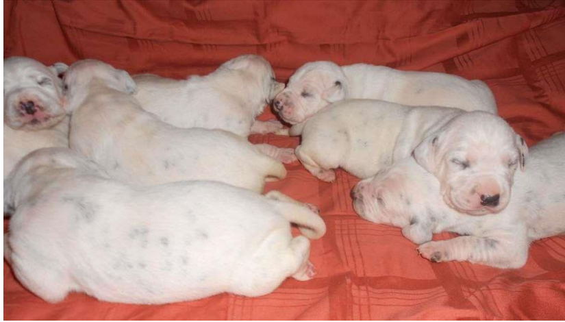
Slika 6. Štenci dalmatinskog psa