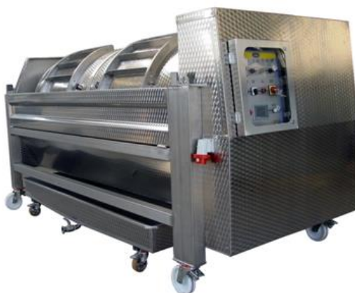
Slika 3: Horizontalna pneumatička preša

Iza muljanja - runjanja slijedi prešanje koje se može obaviti kontinuirano (bez prekida) ili diskontinuirano (s prekidom u radu), a neophodan je tehnološki zahvat koji se posebice koristi u proizvodnji kvalitetnih vina prije samog početka alkoholne fermentacije. Prešanje se odvija u dvije faze: prskanje kožice bobica za oslobađanje samotoka iz sredine bobice i gnječenje bobica pod povećanim pritiskom za oslobađanje soka iz periferne zone siromašne šećerom, a bogatije polifenolima. Samom postupku moramo pristupiti što je moguće brže, a ciklus prešanja mora biti što kraći zbog izbjegavanja nepoželjne oksidacije mošta. Također jako prešanje pod povećanim pritiskom, s ciljem dobivanja veće količine mošta je nepoželjno, jer ide na štetu kakvoće mošta, a kasnije i vina.