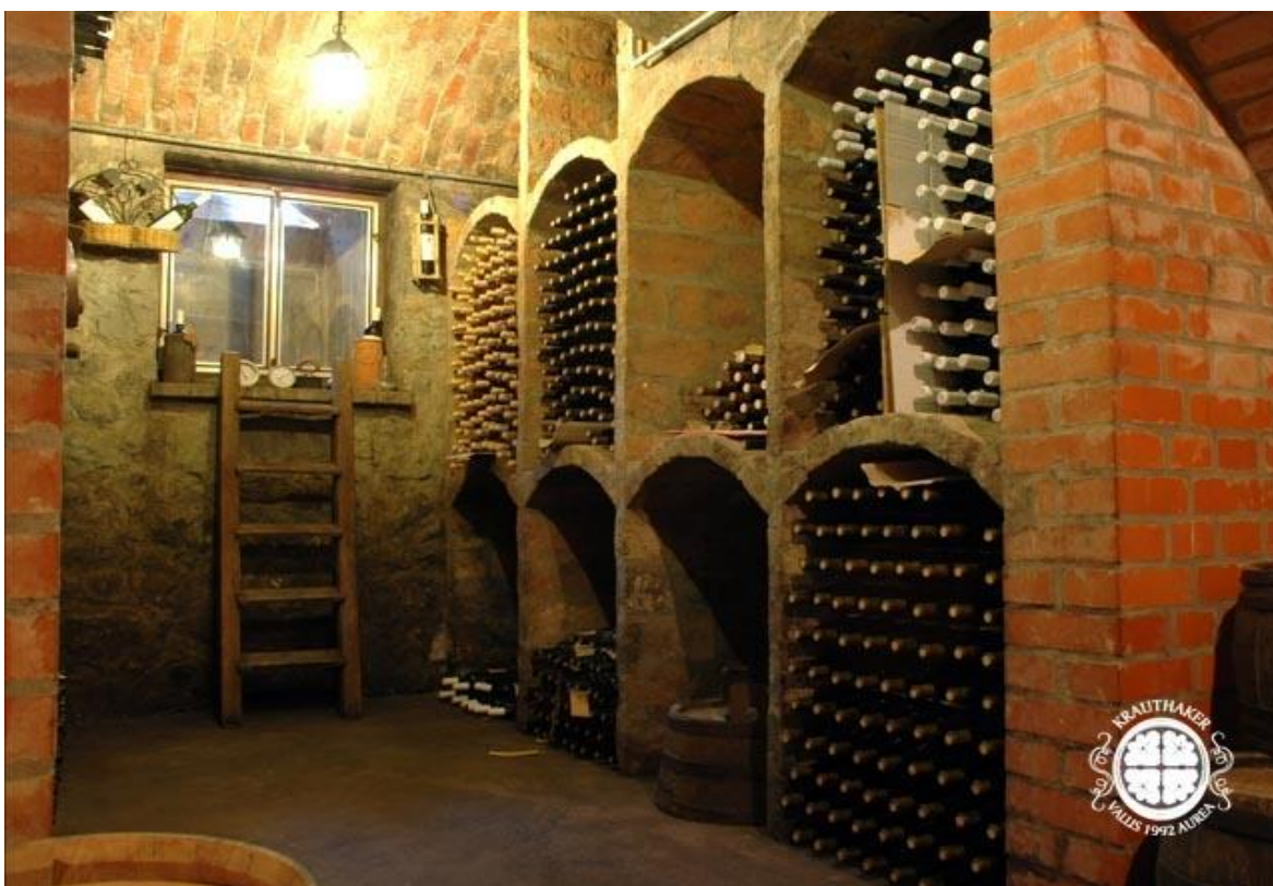
Slika 4: Krauthaker vinarstvo i podrumarstvo – podrum arhivskih vina

Završna faza, nakon završene dorade, stabilizacije i filtracije, je punjenje vina u boce, a proljeće je idealno vrijeme za punjenje kvalitetnih bijelih vina jer su tada potpuno izražene sorte karakteristike. Boce za punjenje prvo treba namočiti u toploj vodi, zatim isprati četkom u 2 % otopini sode, a nakon toga isprati toplom i hladnom vodom te ih pustiti da se iscijede. Treba koristiti nove plutene čepove, a neposredno prije upotrebe držati ih 10 - 12 sati u hladnoj vodi. Danas se prakticira sterilno punjenje u atmosferi inertnog plina kako bi se eliminirao kisik u boci.