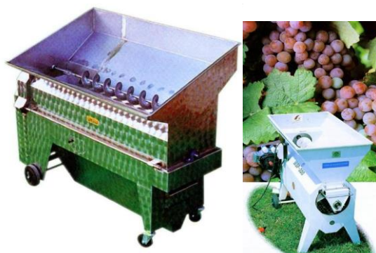
Slika 2: runjača – muljača

drugih tvari koji bi inače prešli iz peteljke u mošt posebice tijekom vrenja, jer svi ti sastojci nisu topivi u moštu nego u alkoholu. Runjača - muljača sastoji se od lijevka za prihvatanje grožđa, rupičastog valjka za odvajanje bobice od peteljkovine i valjaka koji gnječe bobice.