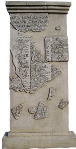
Slika 1: Lombardska psefizma