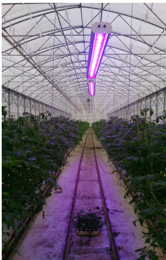
Slika 18. Biljke uz dodatno osvjetljenje (foto original)