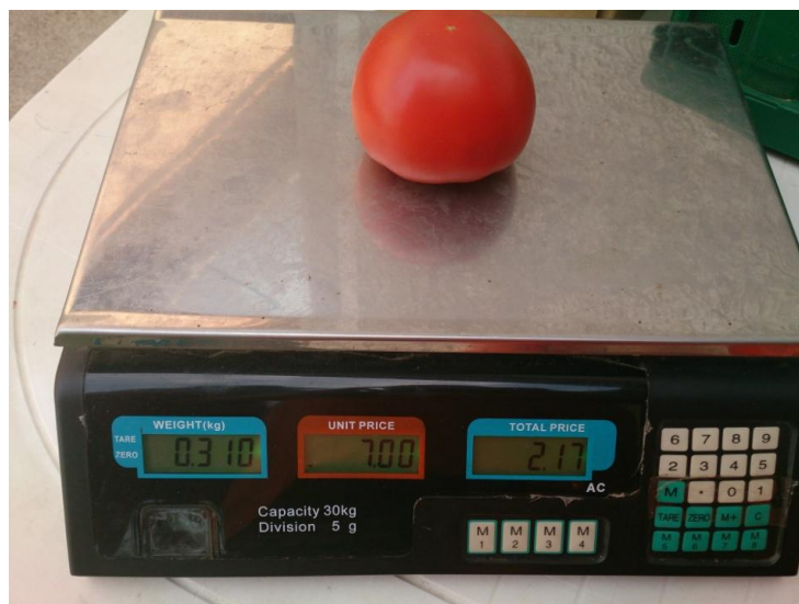
Slika 21. Vaganje plodova