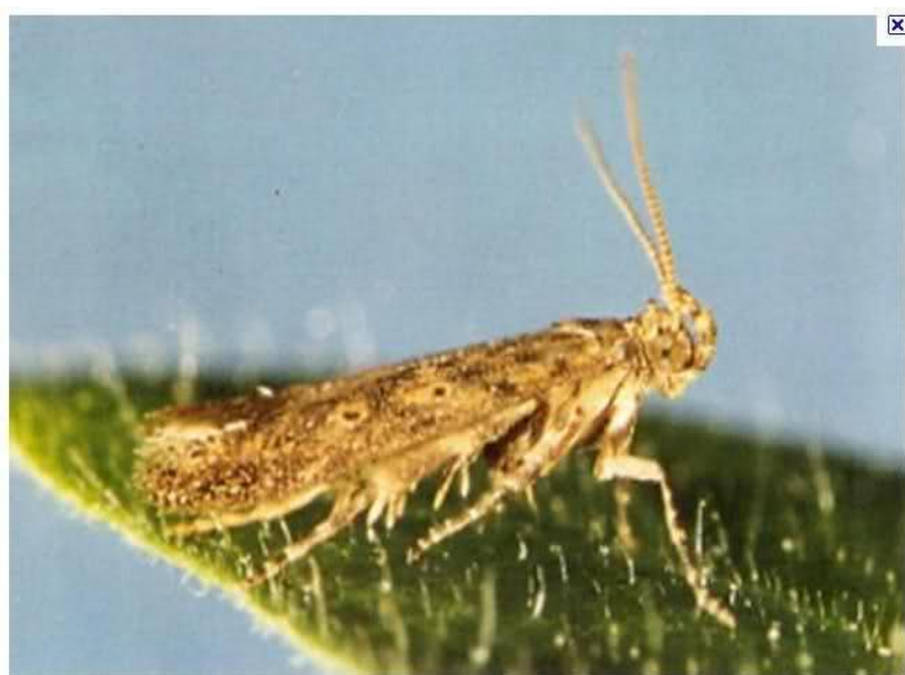
Slika 8. Imago lisnog минера rajčice

Novi štetnik rajčice koji prijete Hrvatskoj kao i okolnim zemljama lisni je miner rajčice ( Tuta absoluta ) (Slika 8). Danas je prisutan u gotovo svim zemljama mediteranskog područja i u Velikoj Britaniji, a podrijetlom je iz Južne Amerike. Štetnik se nalazi na EPPO-voj A2 listi karantenskih štetnika. Štete koje čini na rajčici kreću se u rasponu od 50 do 100 %. Lisni miner rajčice štetnik je rajčice u zaštićenim prostorima i na otvorenom, a štete može činiti i na krumpiru, patliđanu i grahu. Gusjenice se ubušuju u list, plod, stapku ploda i stabljiku, gdje nepravilno izgrizaju tkivo. Listovi na kojima se nalazi veći broj mina mogu se potpuno osušiti. Rajčica može biti napadnuta u bilo kojem razvojnom stadiju, kao presadnica ili kasnije kao već razvijena biljka.