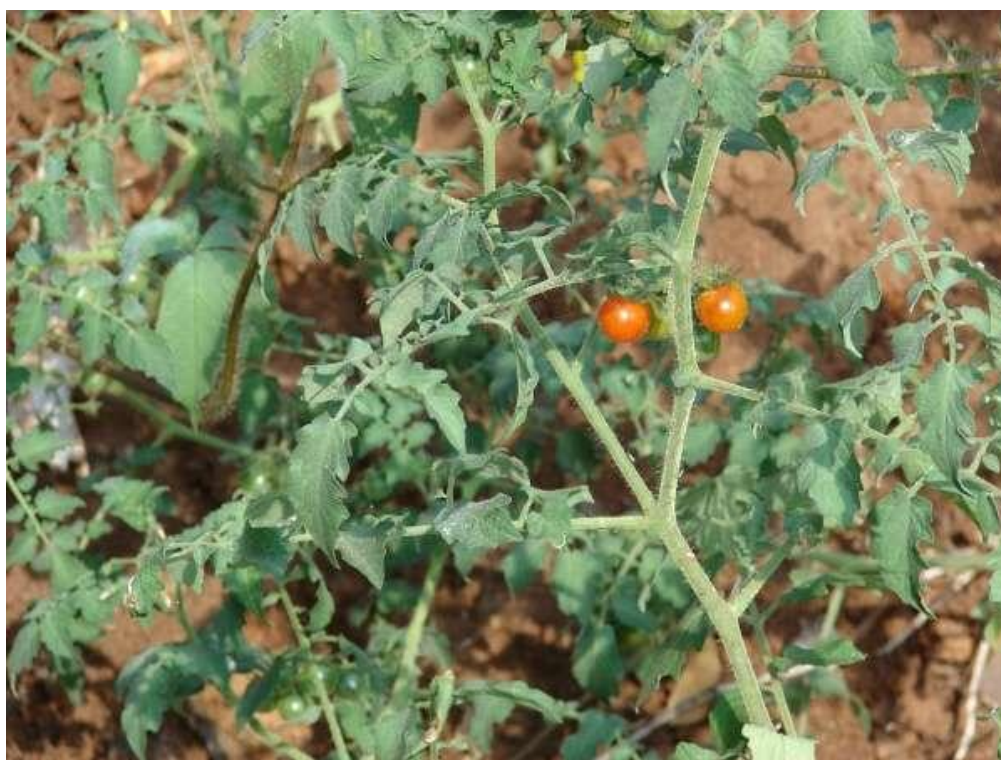
Slika 1. Predak rajčice L. esculentum var. cerasiforme (Izvor : http://luirig.altervista.org/schedenam/fnam . = Solanum+lycopersicum+var.+cerasiforme )

Rod Lycopersicon je dio porodice Solanaceae i obuhvaća oko 80 vrsta. Latinsko ime rajčice kod različitih autora se pojavljuje različito a do danas se najviše upotrebljava upravo naziv Lycopersicon esculentum koje je predložio Miller 1768. Podrijetlo ovog roda je u Južnoj Americi, u Peruu, a uzgoj je vjerojatno započeo u Meksiku od divlje rajčice L. esculentum var. Cerasiforme (Slika 1), koja je i sada rasprostranjena kao korov uz kanale za navodnjavanje i na vlažnim terenima (Lešić i sur., 2002). Od aztečkog naziva „tomathe“, u prijevodu „nabubрили plodovi“, rajčica je dobila ime u mnogim svjetskim jezicima. U Europu ju donosi Kristofor Kolumbo a kao povrće počinje se uzgajati tek početkom dvadesetog stoljeća.