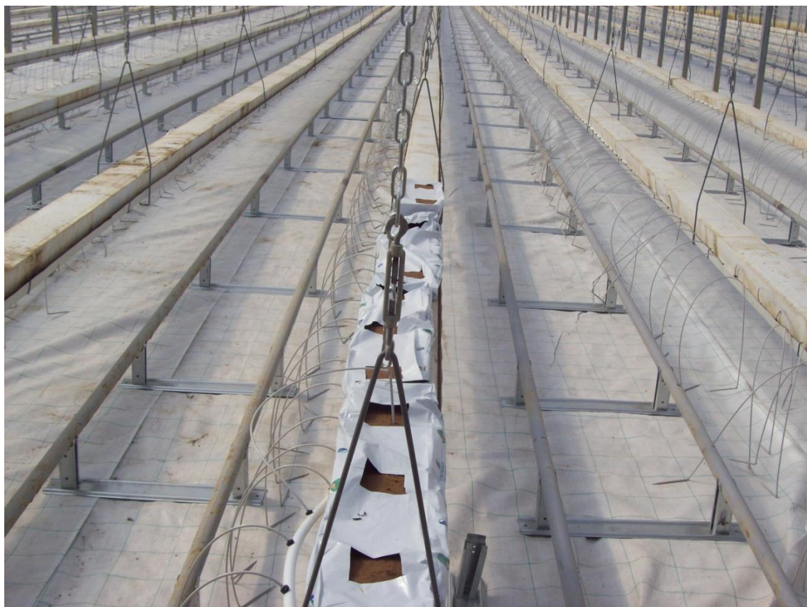
Slika 14. Bijela folija na podu plastenika u hidroponskoj proizvodnji

Količina svjetla u stakleniku ovisi o građevinskim elementima samog staklenika. Ako su tanji, zakrivljeni, uz veći razmak, manje zasjenjuju površinu. Dnevne oscilacije zasjenjenosti plastenika su beznačajne ako se koriste folije s difuznim karakteristikama, jer one daju difuzno svjetlo koje ravnomjerno osvjetljava cijelu površinu. U hidroponskoj proizvodnji se postavlja bijela, reflektirajuća folija na pod kako bi se što više svjetla odbilo nazad do biljaka ( Slika 14).