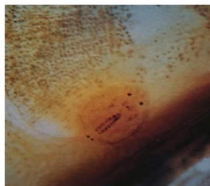
Slika 13. Argulus na koži šarana