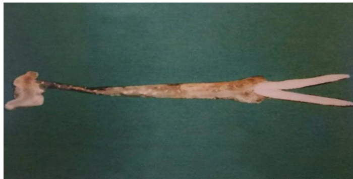
Slika 10. Lerne cyprinacae - mužjak

Parazitarna bolest koju uzrokuju veslonošci iz roda Lerne . Osobinu parazitiranja posjeduju isključivo ženke. Ženke račića oštećuju kožu i dolazi do nastajanja dubokih rana i gubitka ljusaka. Bolesne ribe mršave, te ugibaju od anemije ili sekundarne infekcije bakterijama i plijesnima. U vrijeme složenog razvoja od jajeta do spolne zrelosti, parazit prolazi kroz 8 stadija, od kojih jedan parazitira na škrigama riba (Bojčić i sur., 1982). Dijagnoza se postavlja na osnovu makroskopskog nalaza pregleda kože i mikroskopske determinacije parazita (Jeremić, 2006). Sprječavanje bolesti se može postići kupkom u hipermanganu koje treba primijeniti četiri puta u razmaku od jednog tjedna, te po potrebi ponoviti nakon jednog mjeseca.