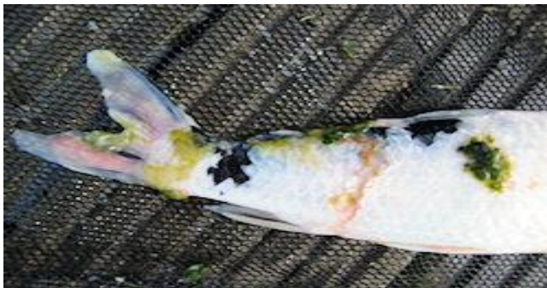
Slika 3. Koža prekrivena česticama mulja