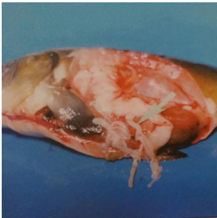
Slika 9. Botriocefaloza šarana

Botriocefaloza je bolest mladunaca i mlađa, koja je izazvana invazijom crijeva trakavicom Botriocephalus acheilognathi . Bolesne ribe zadobivaju upalu crijeva, dolazi do mršavljenja i na posljetku ugibaju. Najčešće obolijeva ovogodišnja i jednogodišnja mlađ šarana. Znakovi bolesti pa i uginuće nastupa kada se u crijevima nađe 50 do 100 parazita. Oboljela mlađ pliva uz površinu vode, gubi apetit, postaje anemična, proširenog trbuha te upalnih očiju. Dolazi do krvarenja te do zapaljenja sluzokože crijeva, a toksini parazita oštećuju jetru i hematopoetske organe. Dijagnoza se postavlja na osnovu kliničkog i patološko-anatomskog nalaza, te utvrđivanja vrste parazita. Liječenje se odvija ljekovitom prehranom, te provođenjem sanitarnih mjera (Jeremić, 2006).