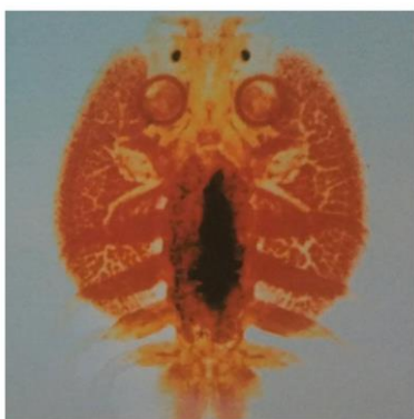
Slika 12. Obojen preparat riblje uši