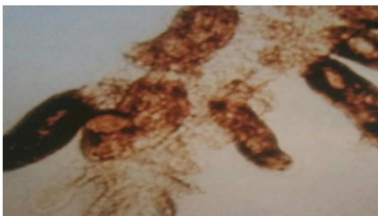
Slika 7. Metilji pričvršćen za škržni filament

Liječenje se provodi kratkotrajnim kupanjem u formalinu razrijeđenom 1:4000 (250 ml/m 3 vode). Pri temperaturi od 15 °C kupka traje sat vremena, a pri većoj temperaturi do pola sata. Isto tako uspješne su kupke s insekticidima: Ortodibrom, Neguvon, Malation (Jeremić, 2006). Sprječavanje bolesti također se provodi i zoohigijenskim i sanitarnim mjerama.