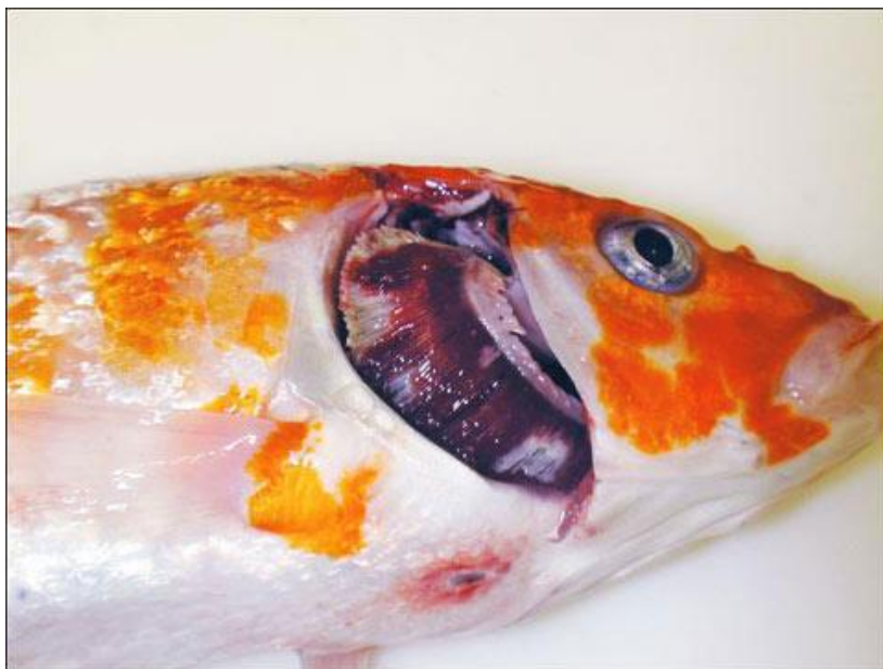
Slika 2. Pigmentiranost škrga