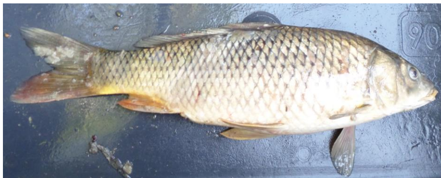
Slika 1. Šaran