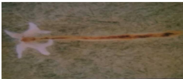
Slika 11. Lerna cyprinaea - ženka