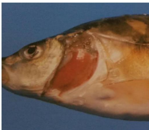
Slika 5. Nekroza škrge