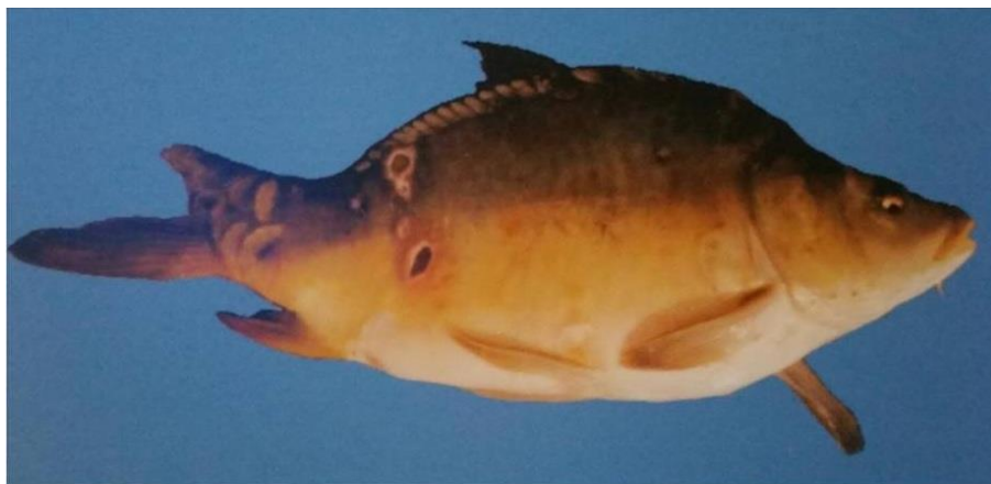
Slika 4. Multiple ulceracije okruglog oblika sa demarkacionim hiperemično-hemoragičnim rubom

Eritrodermatitis šarana se sprječava sanitarnim mjerama posebno sprečavanjem ulaženja divlje ribe, sprečavanjem ozljeda, skraćivanjem trajanja manipulacije ribom, naročito dodira ribe izvan vode (Bojčić i sur., 1982).