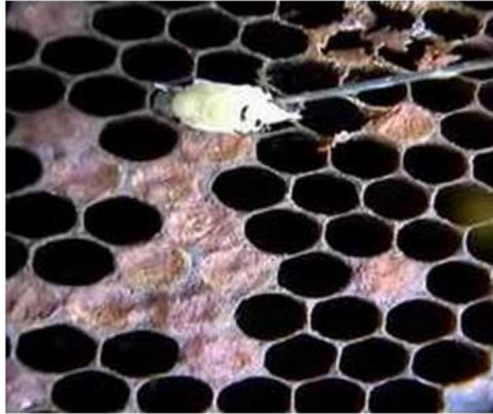
Slika 6. Prikaz oštećenja voštanih kapa na leglu uslijed napada voštanog moljca