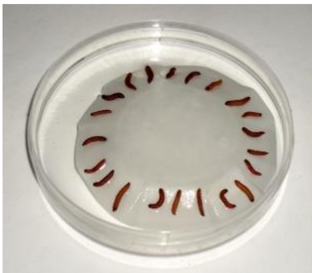
Slika 9. Prikaz „White trap“ metode za utvrđivanje prisustva EPN u ličinkama voštanog moljca.