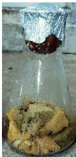
Slika 8. In vitro uzgoj EPN sa spužvom