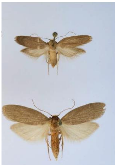
Slika 1. Mužjak imaga malog voštanog moljca (gore), ženka imaga malog voštanog moljca (dolje)

Ženka leptira je duga oko 11 mm, dok je mužjak nešto manji i dužine oko 9 mm (Slika 1.). Sive je boje te je mužjak nešto tamniji od ženke. Raspon krila im je oko 20 mm. Životni vijek imaga nije dug, ženka živi oko 12 dana i nakon odlaganja jaja ugiba, dok mužjak prosječno živi 21 dan.