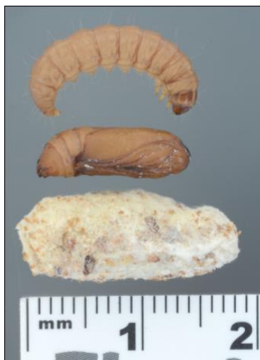
Slika 3. Ličinka (gore), kukuljica (sredina) i čahura (dolje) voštanog moljca