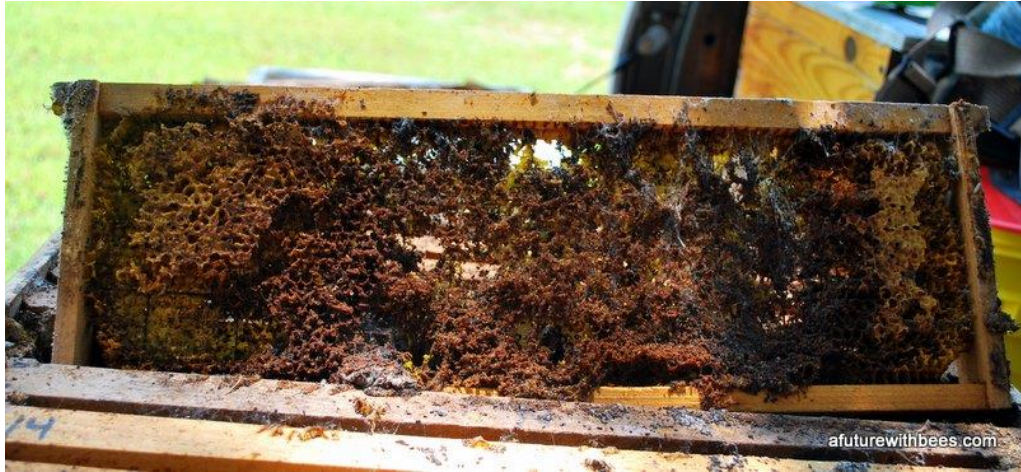
Slika 4. Prikaz potpuno uništenog okvira uslijed napada voštanog moljca