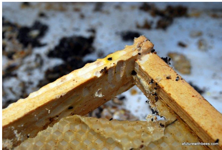
Slika 5. Štete od voštanog moljca na drvenom dijelu okvira