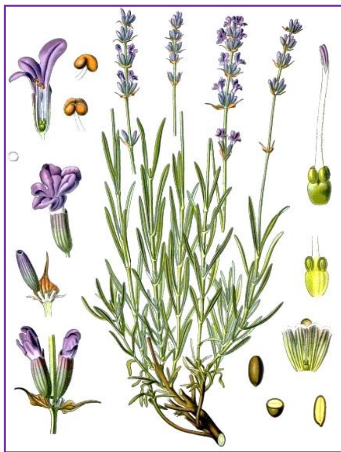
Slika 1. Shematski prikaz dijelova biljke lavande

Grane lavande su u donjem dijelu odrvenjele, a u gornjem dijelu zeljaste, četverouglaste i nadignute te završavaju cvatima (Slika 1.).