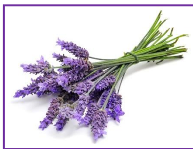
Slika 5. Cvjetne stabljike lavande