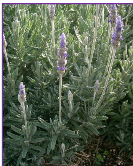
Slika 8. Francuska lavanda

Baš kao i španjolska lavanda, nije otporna na niske temperature, iako je poznata kao izdržljiva višegodišnja biljka. U toplijim područjima obično cvate neprekidno.