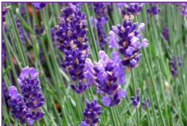
Slika 4. Cvjetovi lavande

Cvjetne stabljike lavande dugačke su od 20-40 cm, a na vrhovima tih dugačkih stabljika javljaju se sitni, mirisni usnati cvjetovi (Slika 5.).