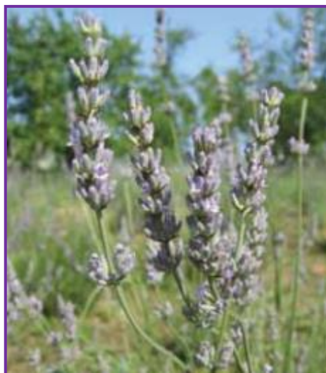
Slika 10. Budrovka

Lako je prepoznatljiva zbog svojih tamnozelenih listova i plavih mirisnih cvjetova na vrhu stabljike, te se zbog toga još naziva i plava lavanda ili morulja (Slika 10.).