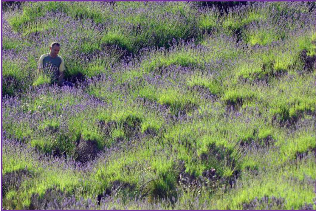
Slika 15. Uzgoj lavande na Hvaru