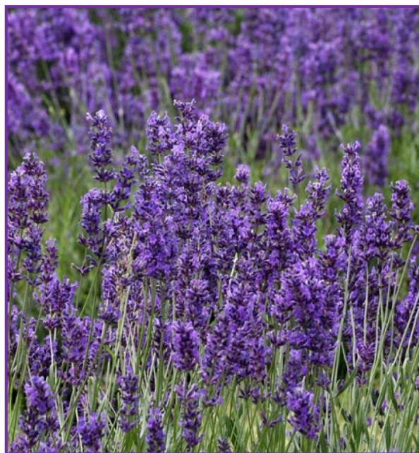
Slika 6. Prava lavanda