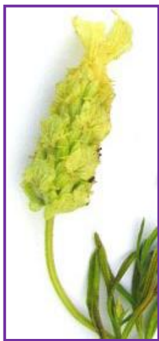
Slika 13. Žuta lavanda

Žutu lavandu odlikuju vrhovi cvjetova koji su jarko žute boje. Listovi su joj, isto tako, žućkasto-zelene boje (Slika 13.). Poznato je da ova vrsta lavande raste više u visinu.