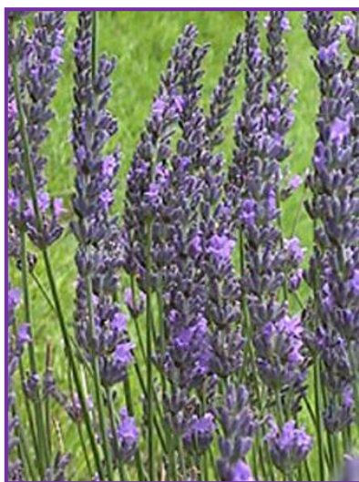
Slika 11. Lavandin Grosso

Uzgaja se za dobivanje ulja koje se koristi najviše u kozmetičkoj industriji. Djeluje smirujuće, poput prave lavande, ali nešto slabije, pa se koriste u masaži i u kupkama te za redovnu njegu kože.