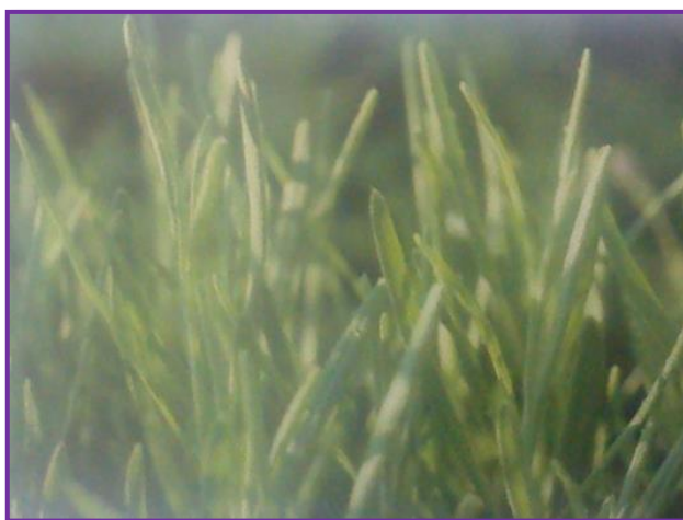
Slika 2. Mladi listovi rubova uvijenih prema donjoj strani

Mladi listovi su zelene boje, dok su stariji sivo-zeleni (Slika 2. i 3.). Donji su listovi obrasli dlačicama, a na naličju listova nalaze se sitne uljne žlijezde koje ispuštaju osebujuć miris lavandinih listova (Šilješ, 1992.). Kod ove biljke javlja se raznolikost u građi listova. Neke vrste imaju listove nazubljenih rubova, dok su kod drugih peroliki ili rascijepljeni.