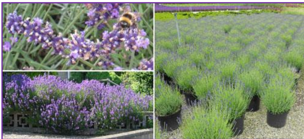
Slika 12. Hidcote lavanda