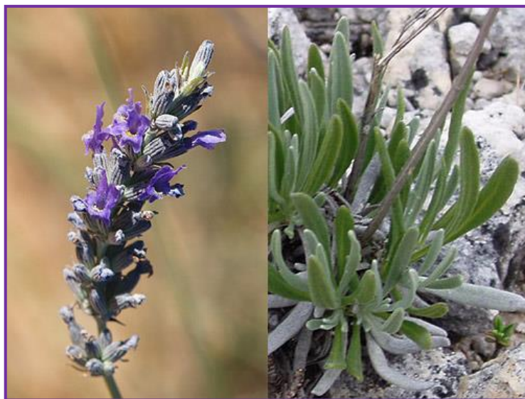
Slika 9. Širokolisna lavanda

Najčešće se primjenjuje u kozmetičkoj industriji zbog svog blagotvornog djelovanja na kožu. Iako se mnoge vrste lavandi koriste kod blažih opekotina, za širokolisnu lavandu se smatra da je najdjelotvornija.