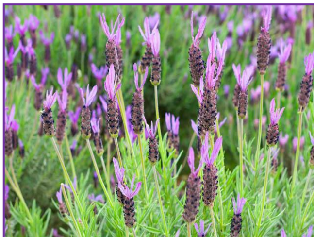
Slika 7. Španjolska lavanda