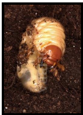
Slika 12. Ličinka običnog hrušta hidrofilni kukac