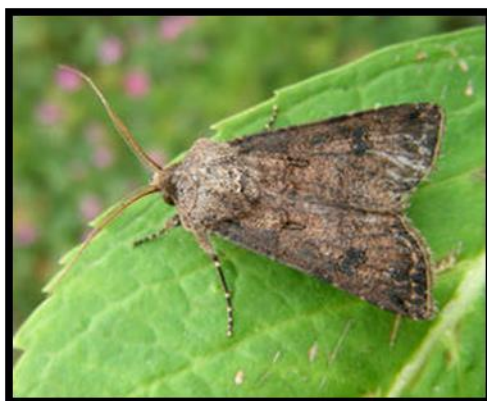
Slika 22. Agrotis segetum Schiff., usjevna soвица noćni kukac, negativna fototaksija

Razlika između dnevnih i noćnih kukaca vidljiva je i po bojama njihova tijela. Kukci koji imaju pozitivnu reakciju na utjecaj svjetla imaju izraženije boje, dok su boje kukaca koji imaju negativu reakciju na utjecaj svjetla, zagasitije (npr. leptiri – na temelju boje vrlo jednostavno se može raspoznati razlika između dnevnih i noćnih).