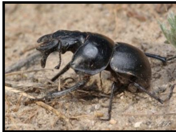
Slika 19. Lethrus apterus L.

U tlu žive kukci, štetnici, organizmi i životinjske vrste koje većinu ili čitav život provode u tlu. Dobar primjer su nematode (Ivezić, 2008.). Nematode (slika 20.) su organizmi dužine tijela najčešće od 0,2 do 2 mm. Tijela nematoda različitih su oblika i uglavnom su blijedolike boje. Većina vrsta zadržava se u tlu. Nematode najčešće možemo naći u tlima koja su bogata humusom (Maceljski, 2002.). Postoje određene vrste kukaca čije se ličinke nalaze samo u tlu (žičnjaci, grčice). Najveći broj kukaca nalazi se u lakim tlima jer je tamo pogodan odnos vlage i zraka a dok neke vrste nalazimo samo u pjeskovitim tlima. Makazar ( Lethrus apterus L.) (slika 19.) je primjer kukca koji živi u pjeskovitom tlu (Tanasijević i Simova-Tošić, 1987.).