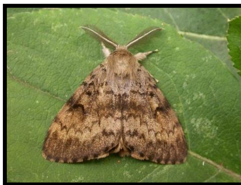
Slika 8. Lymantria dispar L, Gubar

Temperaturna utječe i na produkciju jaja kod kukaca. Zanimljiv primjer je gubar ( Lymantria dispar ) (slika 8). Optimalna temperatura koja odgovara gubaru za odlaganje jaja kreće se od 20 do 30°C. Na temperaturi od 14°C do 17°C gubar odlaže veću količinu, a kada temperatura prijeđe iznad 32°C kukac odlaže manju količinu jaja.