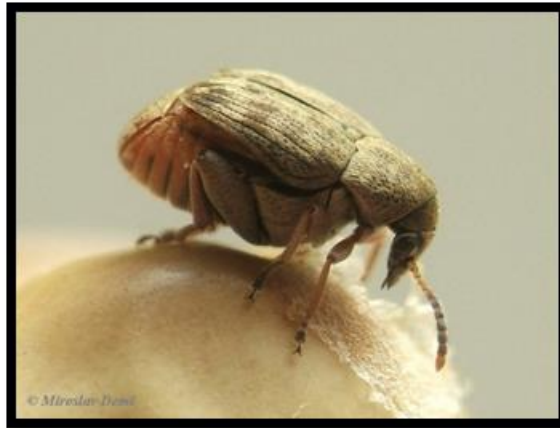
Slika 16. Acanthoscelides obtectus