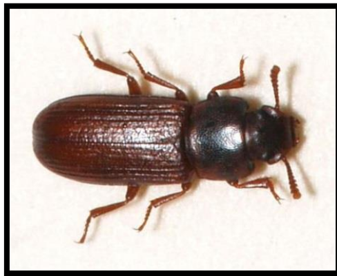
Slika 3. Tribolium confusum

Sposobnost vezivanja vode fizikalnim putem kod nekih kukaca, omogućuje im preživljavanje na vrlo niskim temperaturama. Zona topline, hladnoće i biološka zona postoji za svaku vrstu kukaca (Ivezić, 2008.). Na temperaturama nižim od -10 i višim od 45°C nastupa smrt nekih vrsta kukaca. Na primjer, mali brašnar ( Tribolium confusum ) (slika 3.) ugiba ako je nekoliko tjedana izložen temperaturi od 7°C. Kod nekih vrsta danjih leptira (slika 4.), ukočenost tijela, a koja je posljedica hladnoće, nastupa na temperaturi od 15°C ( https://www.scribd.com/doc/153705235/ekologija-kukci ).