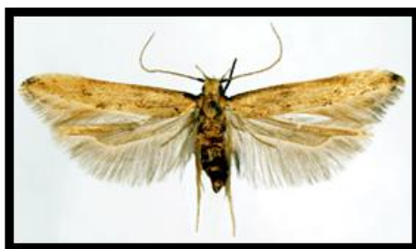
Slika 5. Sitotroga cerealella Oliv, Žitni moljac