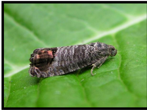
Slika 7. Cydia pomonella , Jabučni savijač

Osim na kretanje i širenje kukaca temperatura utječe i na broj njihovih generacija. Tako na primjer, jabučni savijač ( Cydia pomonella ) (slika 7.) u našim umjerenim klimatskim uvjetima ima dvije generacije, u sjevernoj Njemačkoj i sjevernoj Americi ima jednu generaciju, a u našim južnim krajevima ili južnim područjima sjeverne Amerike četiri generacije tijekom godine. Pojava većeg broja generacija također ovisi o temperaturi, jer što je temperatura veća razvoj generacija kod kukaca traje kraće.