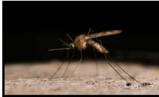
Slika 9. Anopheles maculipennis L.

Prema tome koliko kukci mogu podnijeti velike temperaturne razlike, dijelimo ih na stenotermne i euritermne. Euritermni kukci mogu podnijeti velike razlike u temperaturi, a stenotermni podnose male temperaturne razlike. Euritermna vrsta je na primjer, komarac malaričar - Anopheles maculipennis L. (slika 9.) koji može podnijeti od visokih temperatura pa do vrlo niskih. U stenotermne svrstavaju se na primjer, termiti (Isoptera) (slika 10), obalne muhe (Plecoptera), grabežljive muhe (Diptera).