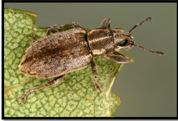
Slika 15. Sitona humeralis