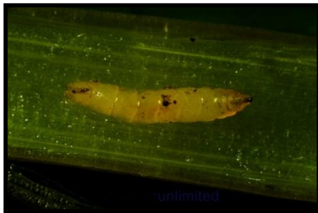
Slika 17. Oscinella frit L., ličinka švedske mušice u biljci

Takav primjer je ličinka švedske mušice ( Oscinella frit L.) (slika 17.) koja živi u biljci, a odrasla jedinka (imago) boravi na osunčanim mjestima (Ivezić, 2008.).