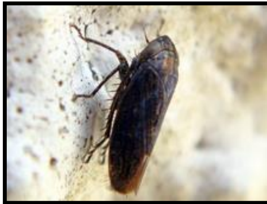
Slika 18. Euscelis plebejus Fall., vrsta cikade

Tako su na primjer rađeni pokusi sa cikadom ( Euscelis plebejus Fall.) (slika 18.) Ustanovljeno je kako uzrok djelovanja svjetlosti kratkog dana u proljeće i jesen ima za posljedicu razvoj manjih cikada tamne boje, a tokom ljetnih mjeseci, kada je osvjetljenje dugog dana, razvija se krupnija cikada svjetlije boje. Prilikom izvođenja navedenog pokusa vjerojatno se uzeli u obzir osim čimbenika svjetlosti i drugi čimbenici poput vlage i količine hrane (Tanasijević i Simova-Tošić, 1987.).