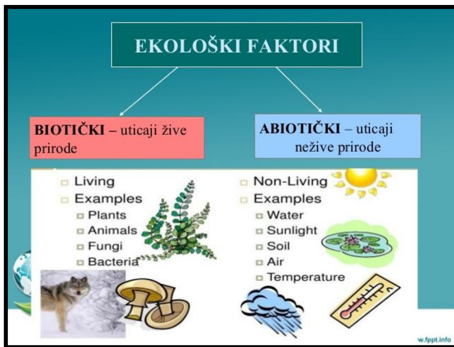
Slika 1. Podjela ekoloških čimbenika

Na slici 1. može se vidjeti podjela ekoloških čimbenika koju čine dvije grupe. Podjeljeni su u biotske i abiotske čimbenike. Biotski čimbenici djeuju pod utjecajem žive prirode, dok abiotski čimbenici djeluju pod utjecajem nežive prirode. Svi ti čimbenici djeluju zajedno i imaju utjecaj na sve žive organizme u prirodi pa tako i na kukce.