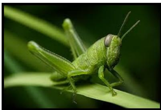
Slika 21. Caelifera, skakavac dnevni kukac, pozitivna fototaksija