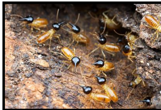
Slika 10. Isoptera – termiti