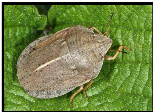
Slika 14. Eurygaster austriaca Schrank.