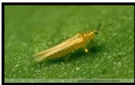
Slika 6. Frankliniella occidentalis Perg, Kalifornijski trips