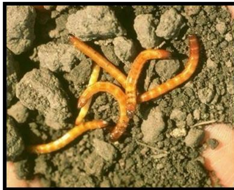
Slika 24. Žičnjaci

Vrstu pokretnog refleksa koja kod kukaca izaziva kretanje prema optimalnoj vlažnosti nazivamo hidrotaksija. Poznati primjer su žičnjaci (Elateridae) (slika 24.) koji se u tlu kreću horizontalno prema izvoru vlažnosti, budući su oni hidrofilni (najveća potreba za vlagom) kukci te ih najčešće možemo naći u vlažnijim tlima.