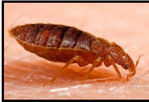
Slika 23. Cimes lectularies , kućna stjenica

Kretanje kukaca koje je uvjetovano mijenjanjem temperature okoline nazivamo termotaksija. Kukci reagiraju na različite stupnjeve temperature krećući se prema njihovu optimumu. Na primjer kućna stjenica ( Cimex lectularies ) (slika 23.) kreće se prema izvoru topline od 27 do 35°C (Tanasijević i Simova-Tošić, 1987.). Termotaksija je takva reakcija koja kukcima omogućava preživljavanje na način da oni pronađu pogodna mjesta za život, tj. ona je čimbenik prostornog rasporeda.