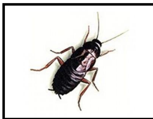
Slika 13. Blatta orientalis , crni žohar kserofilni kukac