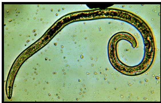
Slika 20. Nematoda