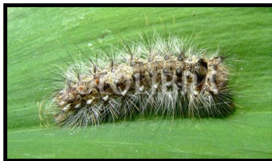
Slika 2. Lymantria monacha L.

Prilagodba kukaca različitoj temperaturnoj razlici može se vidjeti kod skakavca. Temperatura tijela skakavca na suncu je 40°C, a njegovim premještanjem u hlad, nakon nekoliko trenutaka, temperatura njegova tijela se snizi na 20°C. Već na temperaturi od 10°C, tj. preko noći, skakavci su ukočeni od hladnoće, odnosno onemogućena im je mišićna aktivnost. Tijekom jutra, kada se temperatura okoline poveća, skakavci se počinju kretati. Prije podneva oni mogu letjeti. Najveća aktivnost kod skakavaca je na temperaturi od 25 do 32°C prilikom koje se oni intenzivno hrane. Kada se temperatura zraka poveća iznad 32°C, skakavci odlaze u smjeru osunčanih mjesta, a ako temperatura dosegne čak 45°C, skakavci miruju. (Tanasijević i Simova-Tošić, 1987.). Drugi primjer je gusjenica smrekova prelca ( Lymantria monacha L.) (slika 2.), kojoj je optimalna temperatura zraka 36°C, kada je najaktivnija ( https://www.scribd.com/doc/153705235/ekologija-kukci ).