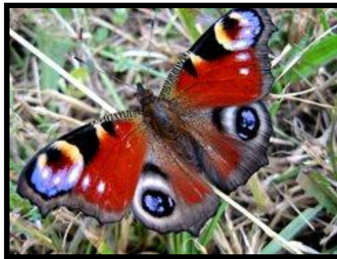
Slika 4. Danje paunče