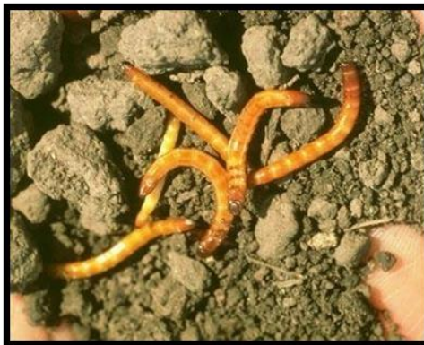
Slika 24. Žičnjaci

Vrstu pokretnog refleksa koja kod kukaca izaziva kretanje prema optimalnoj vlažnosti nazivamo hidrotaksija. Poznati primjer su žičnjaci (Elateridae) (slika 24.) koji se u tlu kreću horizontalno prema izvoru vlažnosti, budući su oni hidrofilni (najveća potreba za vlagom) kukci te ih najčešće možemo naći u vlažnijim tlima.