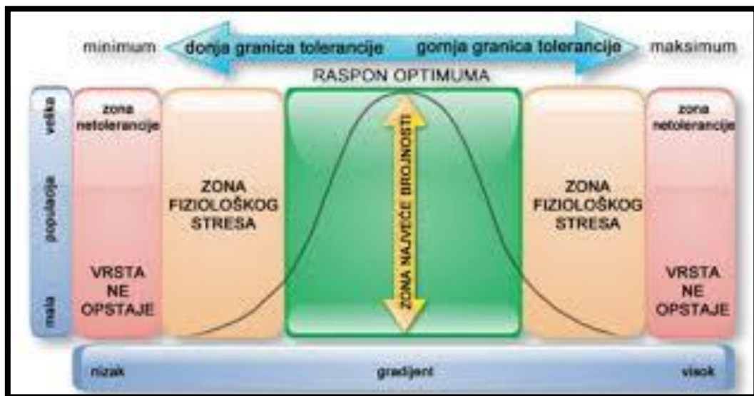
Slika 11. Intenzitet djelovanja ekoloških čimbenika na razvoj kukaca

Na slici 11. prikazan je grafikon iz kojega se može vidjeti intenzitet djelovanja ekoloških čimbenika na komarce. Kod temperatura koje su povoljne za opstanak komaraca u prirodi, ekološki raspon je od -30 do -35°C, ekološki optimum iznosi od 20 do 30°C i vlažnost zraka mora biti iznad 60%. Ako se temperatura povisi na 35°C, a vlažnost zraka padne ispod 25%, komarac ugiba.