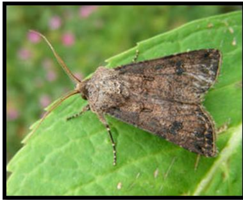
Slika 22. Agrotis segetum Schiff., usjevna soвица noćni kukac, negativna fototaksija

Razlika između dnevnih i noćnih kukaca vidljiva je i po bojama njihova tijela. Kukci koji imaju pozitivnu reakciju na utjecaj svjetla imaju izraženije boje, dok su boje kukaca koji imaju negativu reakciju na utjecaj svjetla, zagasitije (npr. leptiri – na temelju boje vrlo jednostavno se može raspoznati razlika između dnevnih i noćnih).