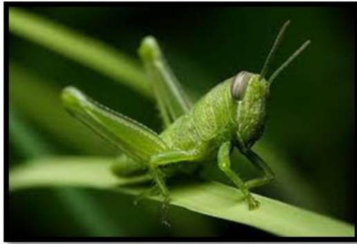
Slika 21. Caelifera, skakavac dnevni kukac, pozitivna fototaksija