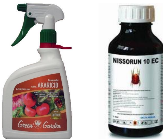
Slika 1. Akaricidi u poljoprivrednim ljekarnama

Akaricidi (Slika 1.) su kemijska sredstva koja svojim djelovanjem suzbijaju grinje. U njihovoj podjeli nailazimo na insekticide i fungicide koji svojim djelovanjem utječu na sve stadije grinja dok selektivni akaricidi prvenstveno djeluju na pokretne stadije grinja (Tablica 2.). U nekim slučajevima selektivni akaricidi mogu djelovati i na odrasle grinje (Raspudić i sur., 2014.).