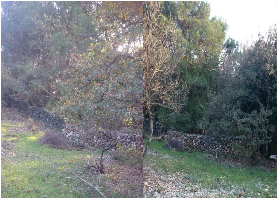
Slika 7. Suhozid na pašnjaku „Pere“

najveću prijetnju predstavljaju mladoj janjadi tijekom zimskih mjeseci koju kolju i pojedu. U prošlosti bilo je dosta pokušaja križanja creske ovce s Awassi i Istočno frizijskom ovcom radi povećanja proizvodnje mlijeka te Karakul radi proizvodnje krzna ali ti zahvati nisu ostavili značajan trag (Pavić i sur., 2006.; Mioč i sur., 2009.). Većinu janjadi vlasnik prodaje na vlastitom gospodarstvu a manji dio mesnicama. Kupci su zadovoljni i ponovo se vraćaju.