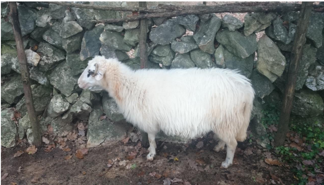
Slika 10. Creska ovca u „Mergaru“