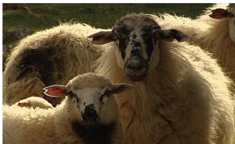
Slika 6. Creske ovce