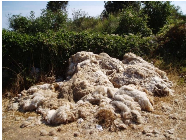
Slika 4. Vuna bačena u prirodi

Nekada je vuna bila glavni proizvod jer su se domaćinstva na Cresu bavila preradom vune i tekstilnom proizvodnjom. U zadnjih 10 godina ista ta vuna više predstavlja problem nego korist. Zbog problema u otkupu i iskorištavanju vune, ona se baca i predstavlja opasnost za okoliš jer je sporo razgradiva, a u Hrvatskoj nije razvijena nikakva proizvodnja koja bi adekvatno iskoristila vunu te samim time i pomogla stočarima oko otkupa iste. Godišnji nastrig vune po ovci je od 1-1,5 kg a ovna od 2-3 kg (HPA, 2015.).