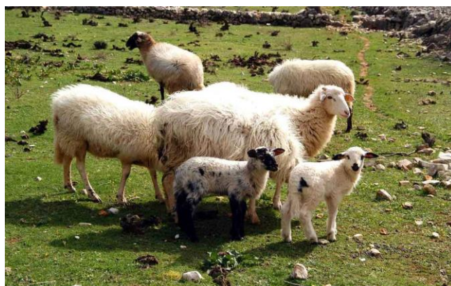
Slika 2. Creske ovce i janjad na paši

Na otoku Cresu je provedeno nekoliko zapisanih mjerenja creskih ovaca. Usporedbom mjerenja iz starijih istraživanja sa novijim mjerenjima jasno se vidi napredak te da je današnja creska ovca tjelesno razvijenija. Današnja creska ovca je u odnosu na svoje pretke dublja i šira, razlog sigurno leži u kvalitetnijoj hranidbi današnjih ovaca. Prosječna visina grebena odraslih ovaca je 60,62 cm, duljina trupa 67,83 cm, širina prsa 17,75 cm, dubina prsa 29,34 cm, opseg prsa 83,10 cm, opseg cjevanice 7,93 cm i tjelesna masa 41,58 kg (Mioč i sur., 2011.). Tijelo ovaca prekriveno je poluotvorenim, najčešće bijelim runom. Prosječni promjer vlakana iznosi od 28 do 35 \mu\text{m} . Runo je grubo i kada se razvije, razdvaja se u pramenove.