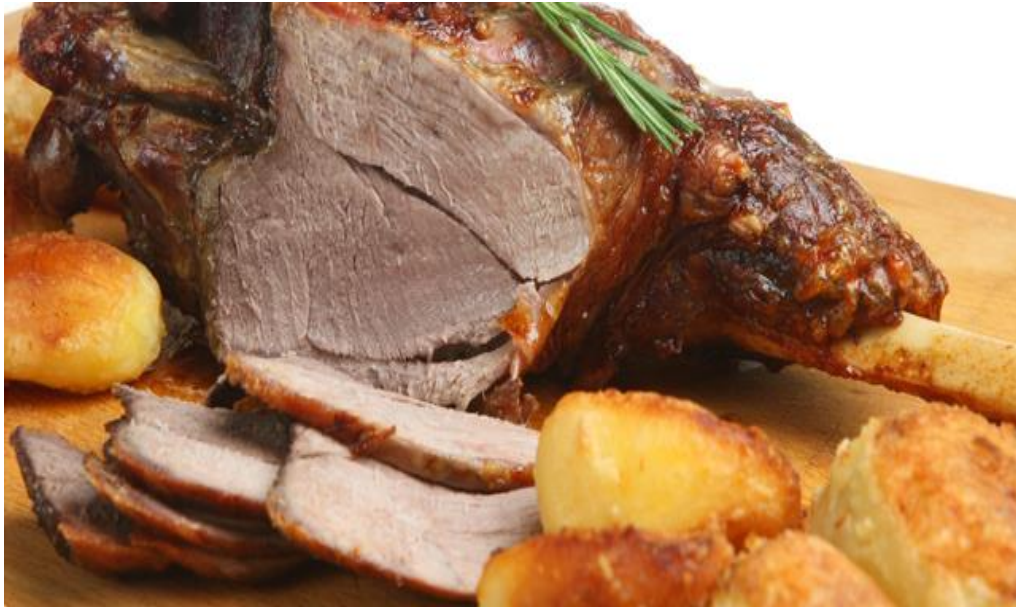
Slika 5. Pečena creska janjetina

creske ovce smjestila je cresku janjetinu u sam vrh kvalitete ovčjeg mesa u Republici Hrvatskoj i u svijetu. Prema Šimpragi, (2013.) na otocima cresko-lošinjske skupine nalazi oko 1 500 vrsta biljaka, što je za 300 više nego na cijelom području Velike Britanije. Upravo zbog znatnog udjela aromatične i ljekovite flore, creska janjetina i sir imaju specifičan okus i iznimnu kvalitetu.