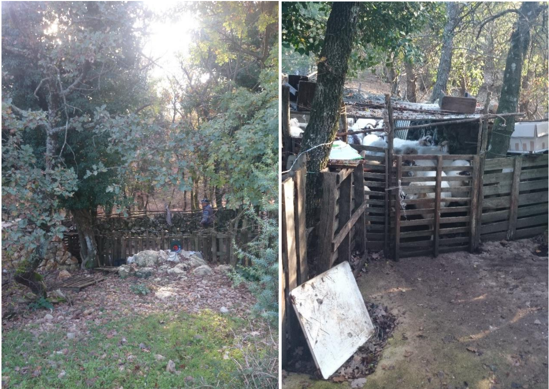
Slika 9. „Mergar“