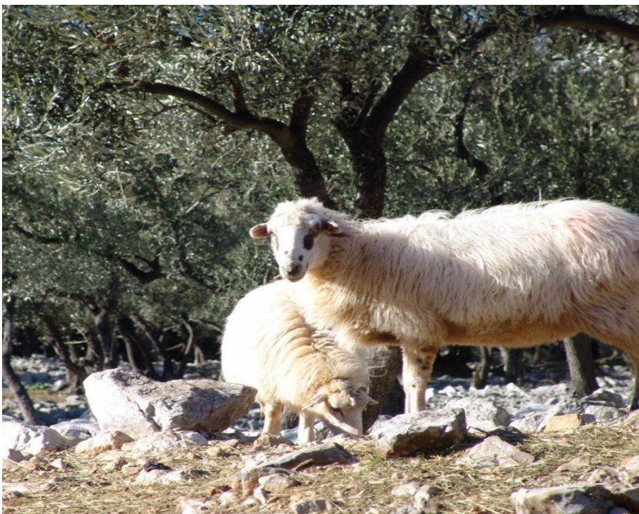
Slika 1. Creska ovca

Creska ovca je izvorna hrvatska pasmina koja se uzgaja na području Cresko-lošinjskog arhipelaga. Otok Cres je dugi niz godina prepoznatljiv po svojoj ovčarskoj tradiciji koje karakterizira držanje ovaca na otvorenim otočkim pašnjacima tijekom cijele godine. Naime, ovčarstvo je imalo povoljnije uvjete za razvoj od drugih oblika stočarstva, ali i poljoprivrede, pa je još u prvoj polovici 20. stoljeća bilo jedan od glavnih oblika privređivanja većine otočana (Horvath, 2003.; Rebrović, 2009.). Prvi pisani podaci o broju ovaca na otoku su iz 16. stoljeća kada se na području otoka Cresa uzgajalo 120 000 ovaca. U drugoj polovici 18. stoljeća govori se o 70 000 ovaca, a početkom prošlog stoljeća prema dostupnim podacima na otoku je bilo 35 000 ovaca. Ovčarstvo je ostavilo veliki utjecaj na kulturu te na samu bioraznolikost otoka. Sam krajolik otoka Cresa je prepoznatljiv po suhozidima (gromačama), koji predstavljaju svojevrsnu turističku atrakciju, a građeni su da bi zaštitili obradive površine od ovaca. Ovce se na otoku Cresu tradicionalno (pregonski) napasuju u maslinicima, sprječavaju zakorovljavanje pri čemu se postiže brža regeneracija maslinika, te samim time i povećava urod maslina. Osim toga, interakcija među vrstama je vidljiva i u postojećem lancu ekosustava otoka Cresa te suživot ovce i ugrožene vrste bjeloglavih supova kojima su uginule ovce izvor hrane. Kako je ovca utjecala na okoliš tako je i okoliš ostavio utjecaj na ovcu.