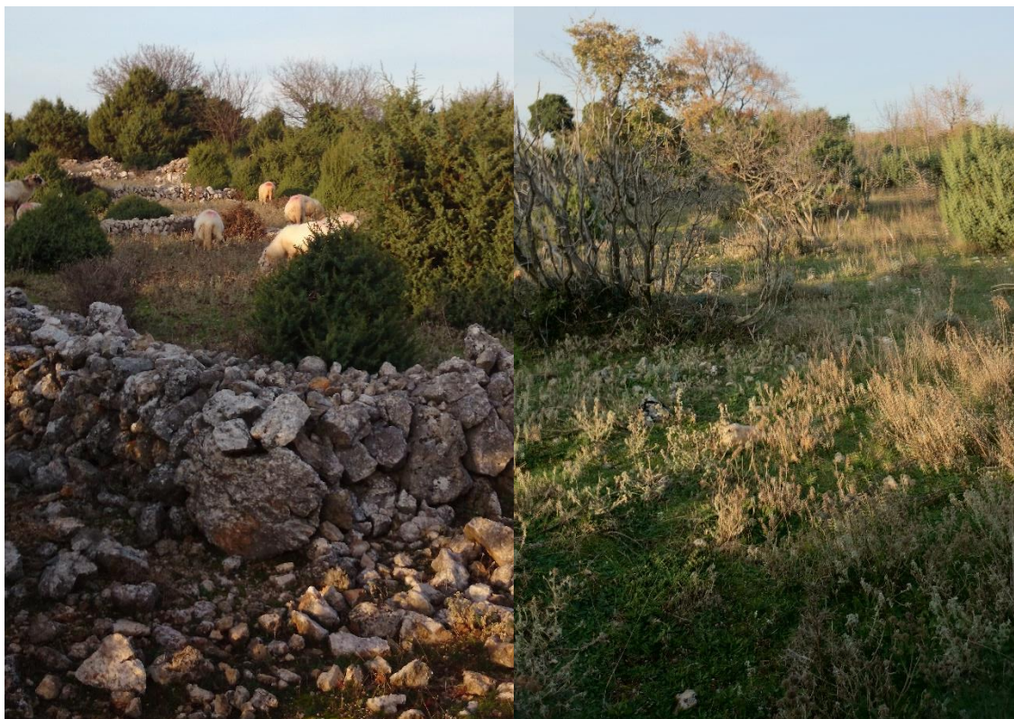
Slika 8. Vegetacija na pašnjaku „Pere“