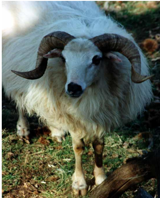
Slika 3. Ovan Creske pasmine

Na noge creske ovce značajan utjecaj je ostavio teren na kojem se kreće. Noge su duge ali čvrste sa dobro razvijenim papcima prilagođenim za kretanje po nepristupačnom terenu otoka Cresa. Stav prednjih nogu je pravilan dok je stav stražnjih nogu najčešće "kravljji" (HPA, 2015.). Glava ove pasmine je relativno mala s prosječnom dužinom od oko 23 cm. Oblik glave je prilagođen terenu na kojem živi te je uska radi lakšeg uzimanja hrane na kamenitom terenu.