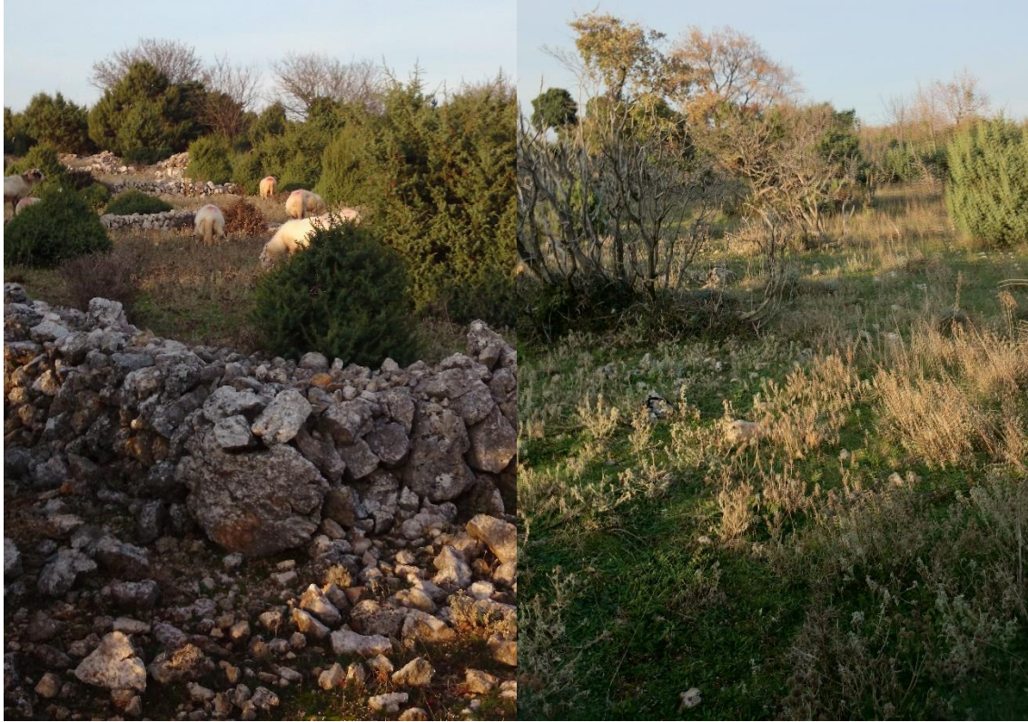
Slika 8. Vegetacija na pašnjaku „Pere“