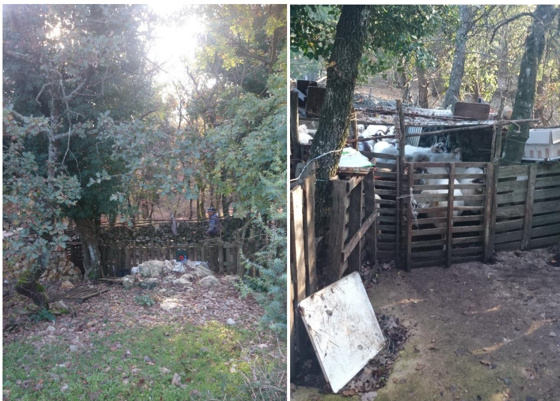
Slika 9. „Mergar“