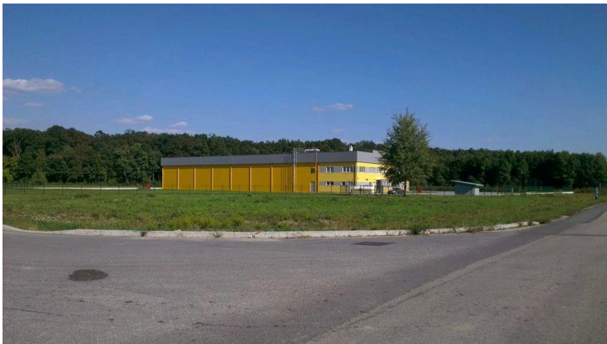
Slika 1. Zgrada Distributivnog centra za voće i povrće d.o.o.