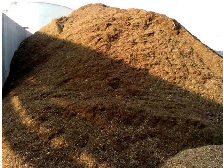
Slika 11. Otpadna biljna tkiva