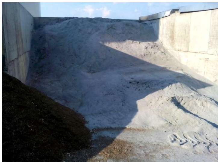
Slika 12. Pepeo iz kotlovnice