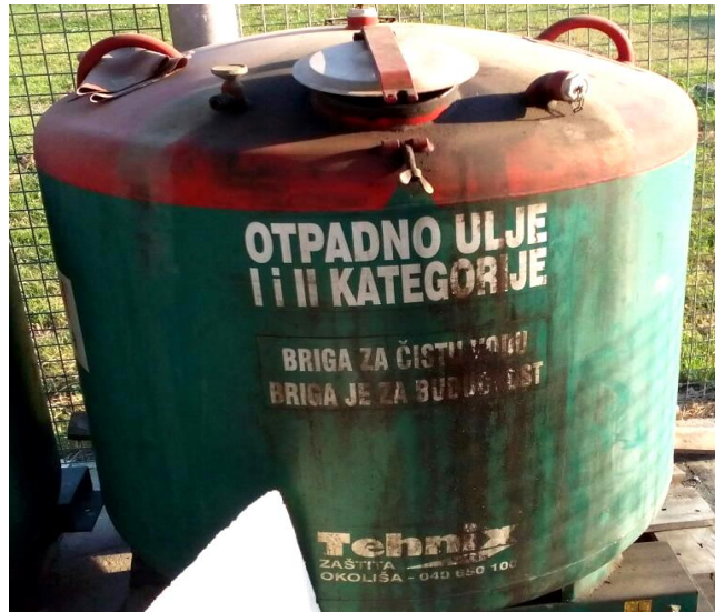
Slika 5. Spremnik otpadnog ulja