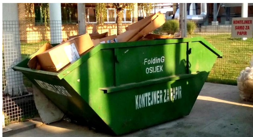
Slika 8. Kontejner za papir