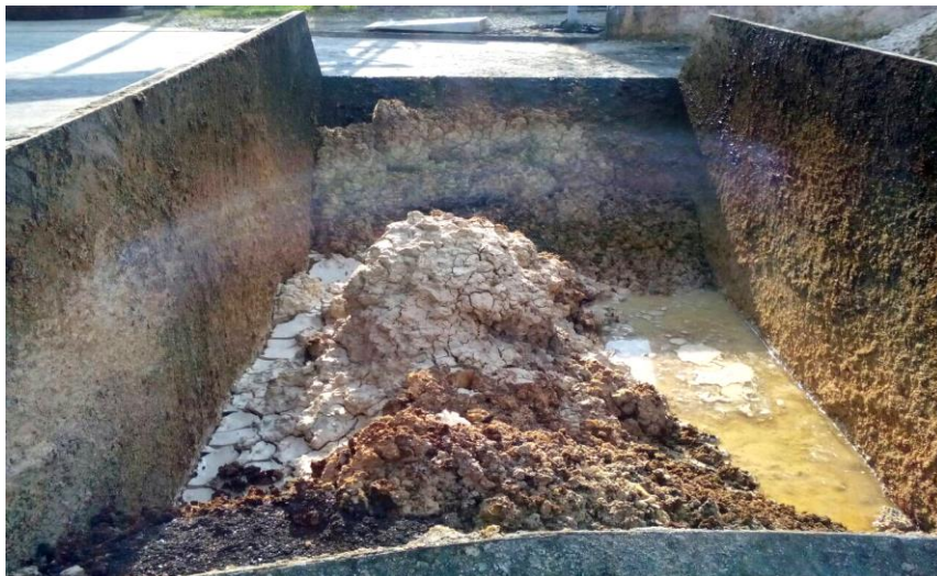
Slika 10. Mulj od otpadnih voda