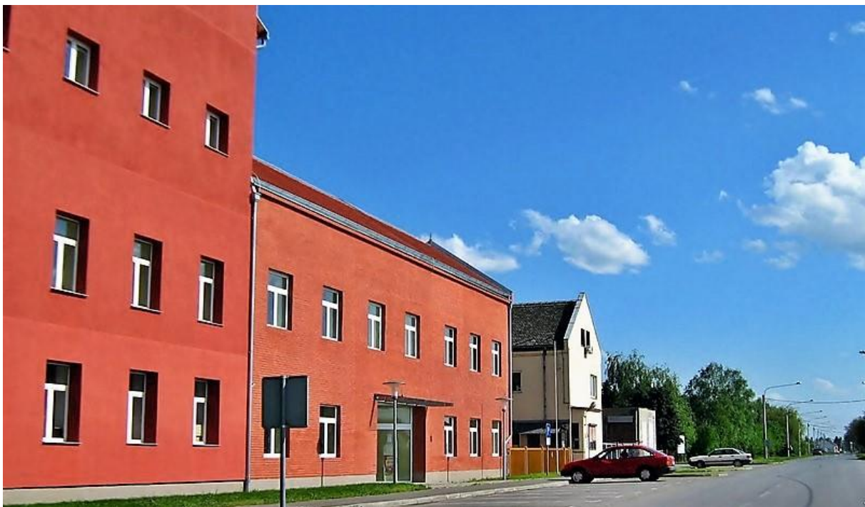
Slika 1. Tvornica ulja Čepin d.d.

Cilj rada je utvrditi stanje gospodarenja otpadom u tvrtki „Tvornica ulja Čepin d.d.“, te usklađenost s mjerodavnim propisima u istom području.