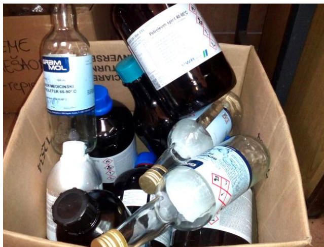
Slika 6. Ambalaža koja sadrži ostatke opasnih tvari