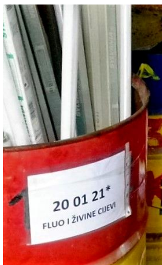
Slika 7. Prikupljanje otpadnih fluorescentnih i živinih cijevi