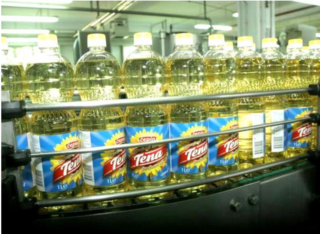
Slika 4. Linija punjenja boca ulja od 1 l

ne sadrži HOS – eve. Nakon lijepljenja etikete na bocu se ispisuje datum punjenja i LOT. Za razrijeđivanje tinte koja se upotrebljava za označavanje ambalaže, koristi se brzosušće otapalo Tip 1512. Prema STL–u, proizvod nije klasificiran kao opasan za okoliš. Napunjena boca se pakira u kartonsku ambalažu na stroju za upakivanje. Formirana paleta se omata sa folijom na stroju za omatanje paleta. Paleta se prevoze sa viličarom u skladište gotovih proizvoda.