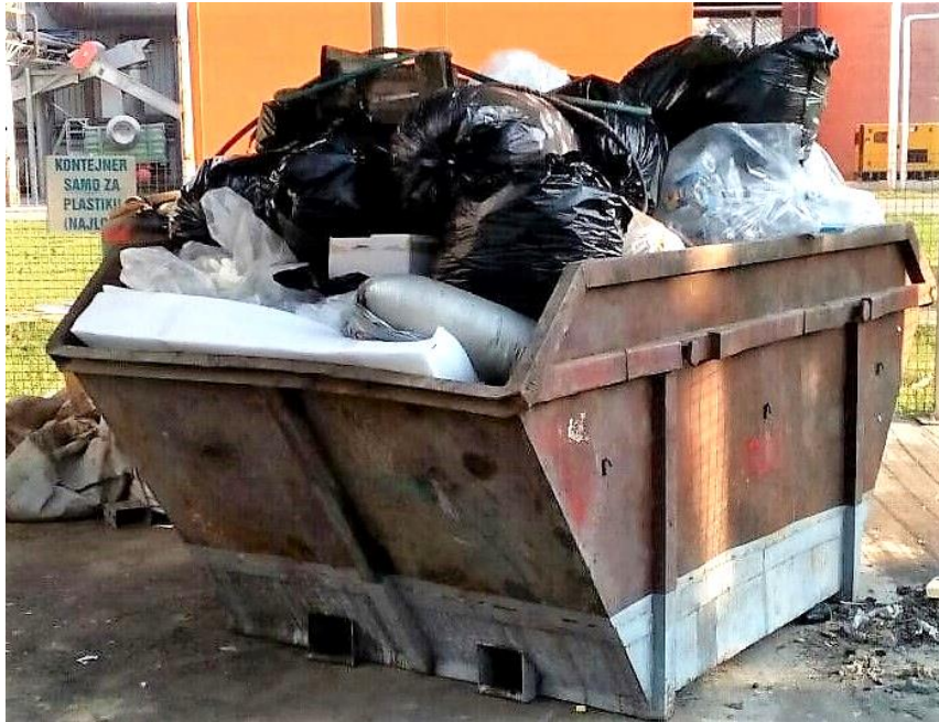
Slika 9. Kontejner za plastiku