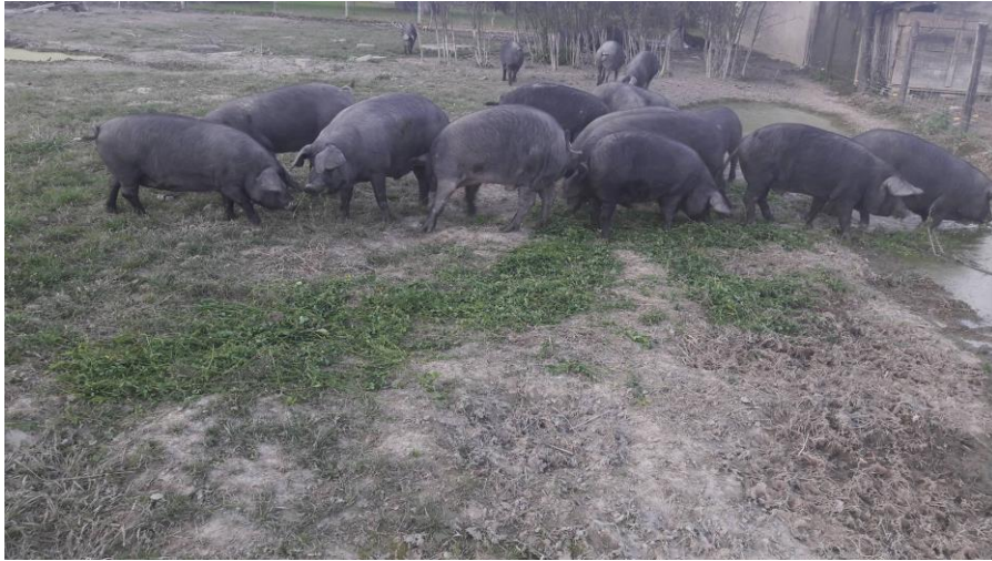
Slika 14. Hranidba tovljenika zelenom lucernom

Nakon završetka tova svinje su zaklane u klaonici (Slika 15, 16), a na liniji klanja utvrđena su slijedeća svojstva svinjskih trupova i svinjskog mesa: