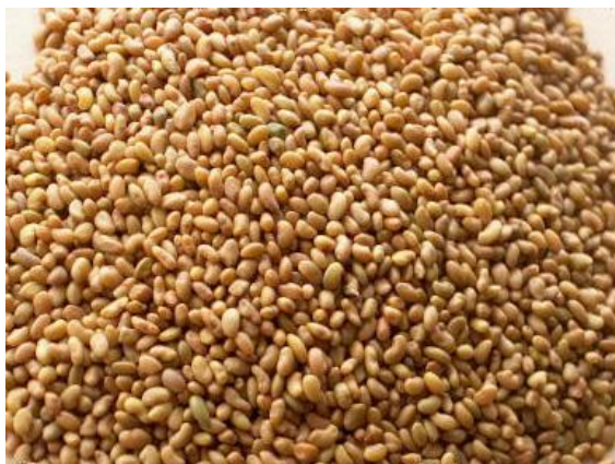
Slika 4. Sjeme lucerne

Najčešće se sije 18-25 kg/ha sjemena lucerne sa međurednim razmakom 12 - 20 cm.