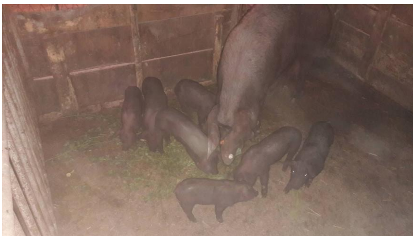
Slika 13. Lucerna u hranidbi dojnih krmača

Drugi dio istraživanja proveden je na 40 tovljenika crne slavonske svinje koji su bili podijeljeni u dvije skupine po 20 komada. Prva (kontrolna) skupina dobivala je u zadnjih 6 mjeseci tova standardni obrok (Tablica 2) bez dodatka zelene lucerne, a druga (pokusna) skupina dobivala je tijekom zadnjih 6 mjeseci tova, uz standardni obrok, još i zelenu lucernu po volji (Slika 14). Prosječna dnevna količina zelene lucerne iznosila je 4,1 kg po tovljeniku.