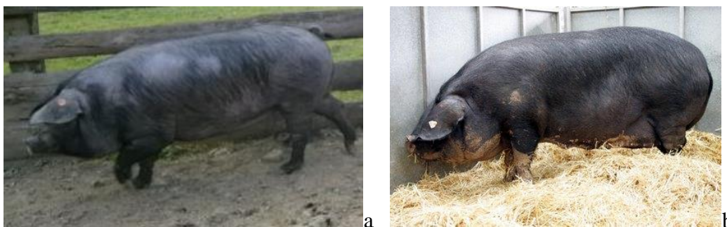
Slika 10. Fajferica(a) i kornvol(b) danas

„Posljedice“ koje je križanje s velikom crnom engleskom svinjom ostavilo na fajfericu najbolje su vidljive usporedbom današnje fajferice s ovom engleskom pasminom. Upravo zbog toga trebalo bi i u opisu i u literaturi početi koristiti nazive „stara fajferica“ i „nova fajferica“.