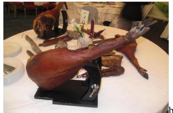
Slika 11. Zaklani trupovi (a) i šunka od fajferice (b)