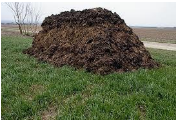
Slika 2. Stajnjak

Da bi lucerna ostvarila visoke prinose, mora biti bogato opskrbljena hranjivim tvarima kao što su dušik, fosfor, kalij, kalcij, molibden, bor, mangan, magnezij. Gnojiva koja se primjenjuju mogu biti organskog ili mineralnog podrijetla. Stajsko gnojivo koje se primjenjuje mora biti potpuno zrelo kako bi se brže razlagalo i bolje inkorporiralo s organskim mineralnim kompleksom zemljišta (Mišković, 1986.). Korištenjem stajnjaka unosimo velike količine biljnih hraniva, obogaćujemo tlo organskim tvarima i mikroorganizmima, što dovodi do popravka strukture, toplinskog, zračnog i vodnog režima.