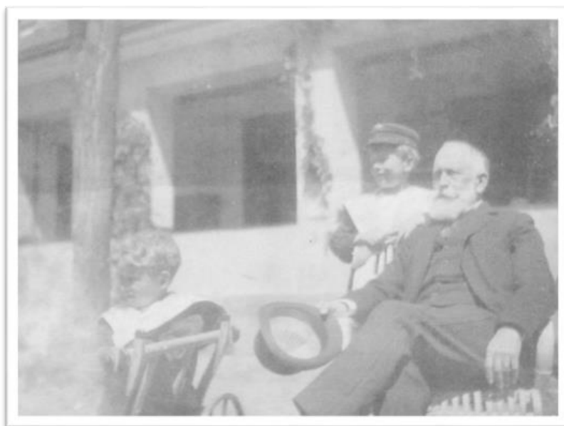
Slika 8. Grof Pfeiffer (1896.) (Foto: Nicholas de Pfeiffer)

Crna slavonska svinja ubraja se u tzv. prijelazne ili kombinirane pasmine svinja (za proizvodnju mesa i masti). Nastala je u drugoj polovici 19. stoljeća, a postupci oplemenjivanja i poboljšanja ove pasmine provedeni su i početkom 20. stoljeća. Ova pasmina nastala je na pustari Orlovnjak u blizini Osijeka, na imanju grofa Karla Pfeiffera te se zbog toga često u narodu naziva i fajferica. Grof Pfeiffer pokušao je stvoriti svinju koja će biti bolja od tadašnjih pasmina svinja, prije svega u pogledu ranozrelosti, plodnosti te u boljoj mesnatosti.