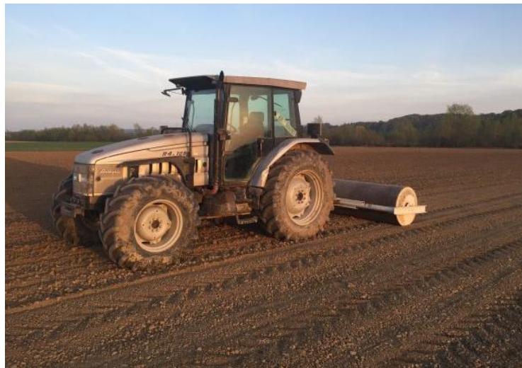
Slika 5. Valjanje nakon sjetve

Važna mjere njege je valjanje. Lucernom zasijana površina trebala bi se valjati odmah nakon sjetve. Valjanjem se postiže bolji dodir sjemena s vodom (bolje i brže upija vodu), osigurava se kapilarni uspon vode do sjemena, sjeme brže i bolje niče (Gagro, 1998.). Obavezna mjera njege je i suzbijanje korova, naročito u mladom lucerištu koja se može obavljati mehaničkim ili kemijskim putem. Korovi se mehanički mogu suzbijati košnjom lucerišta, drljanjem teškim drljačama nakon prihrane lucerišta u kasnu jesen ili u proljeće. Osim što se uništavaju korovi, drljanjem se i prozračuje te razrahljuje tlo. Kemijskim putem korovi se suzbijaju primjenom herbicida. Herbicidi se mogu koristiti prije sjetve, poslije sjetve, prije nicanja, nakon nicanja, za vrijeme mirovanja vegetacije, kada je lucerna razvila 2- 4 lista.