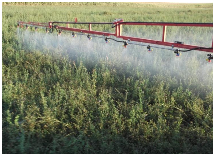
Slika 6. Prskanje lucerne