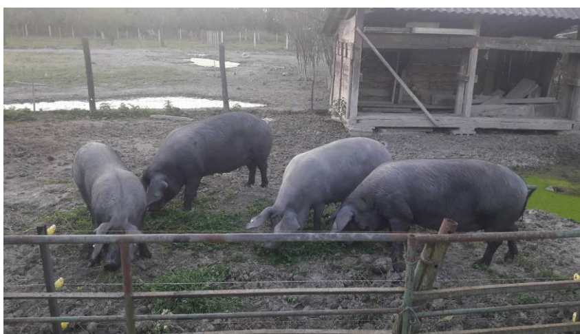
Slika 12. Lucerna u hranidbi suprasnih krmača