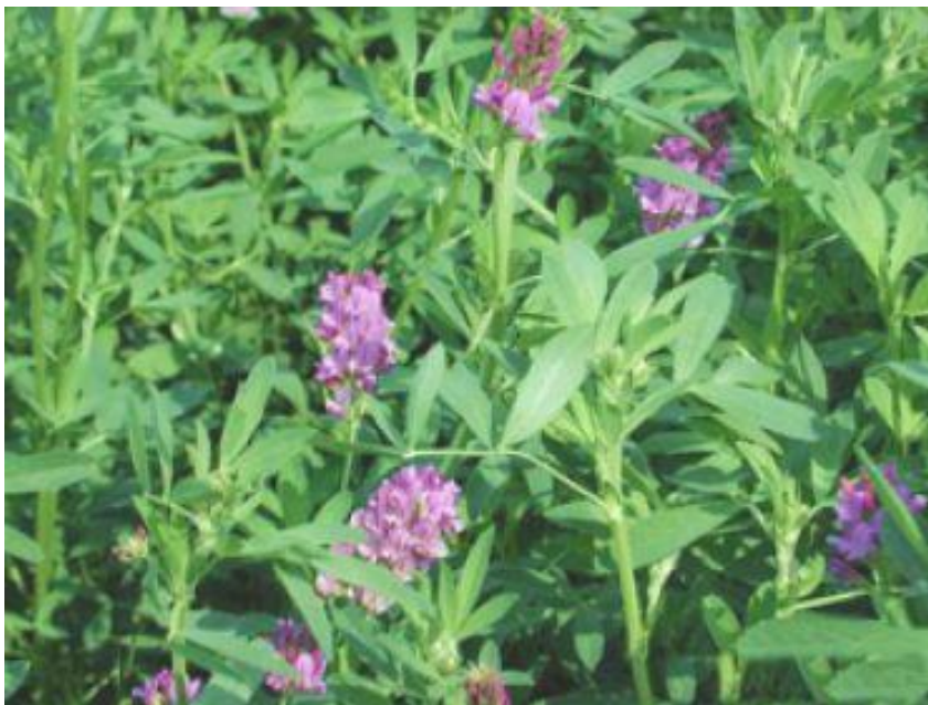
Slika 1. Lucerna u cvatu

Zbog svih navedenih pozitivnih karakteristika za lucernu slobodno možemo reći da je „kraljica krmnih kultura“ i od velike važnosti u stočarstvu.