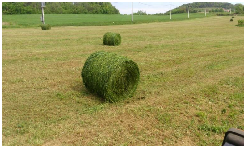
Slika 7. Sijeno lucerne