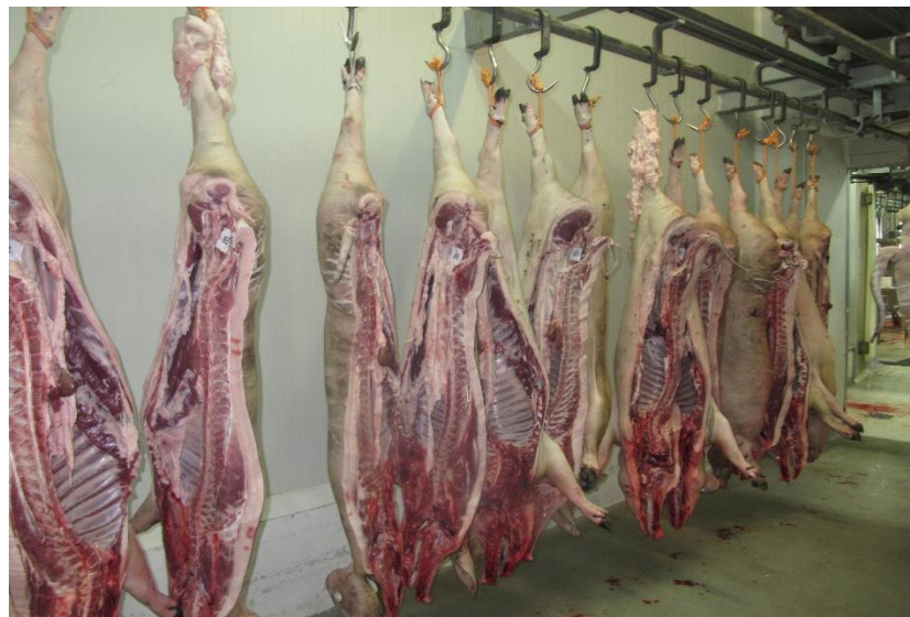
Slika 15. Zaklani trupovi tovljenika crne slavonske svinje