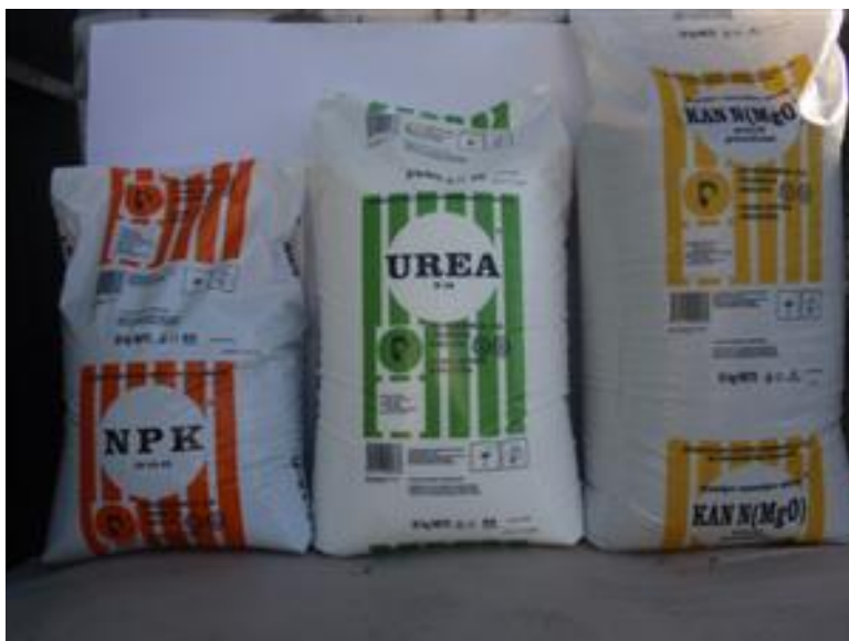
Slika 3. Mineralno gnojivo

Prihrana lucerne provodi se po potrebi, na lošijim tlama i u proljeće nakon prvog otkosa.