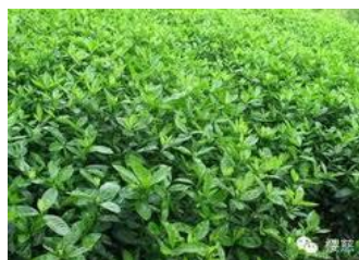
Slika 3. soja