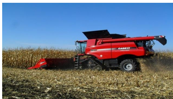
Slika 8. kombajn CASE