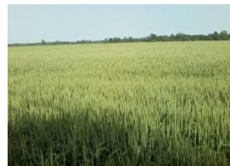
Slika 2. pšenica