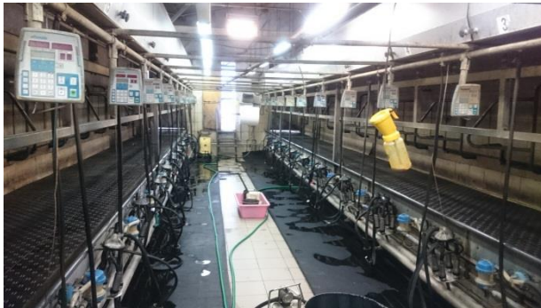
Slika 13. izmuzište

stakalca. Nakon mužnje muzna jedinica se automatski skida i tada se na sise stavlja zaštita jodom. Mlijeko iz 2 spremnika pomoću automatske pumpe ide u laktofriz, pumpa se pali kada dostigne određenu količinu u spremnicima. Mora se paziti na čistoću vimena da se ne bi zaštopali filteri. Tada pumpe ne mogu automatski povući mlijeko u laktofriz i mlijeku u tom slučaju može ući u vakum i može doći do kvara pumpe. Mlijeko se odvozi svaki dan nakon jutarnje mužnje. Tijekom večernje mužnje u proljeće i ljeto bitno je uključiti hladnjaču na laktofrizu da mlijeko ne bi prokislo. Temperatura hladnjače iznosi oko 4 °C i noćni radnik tijekom noći obilazi laktofriz i provjerava temperaturu.