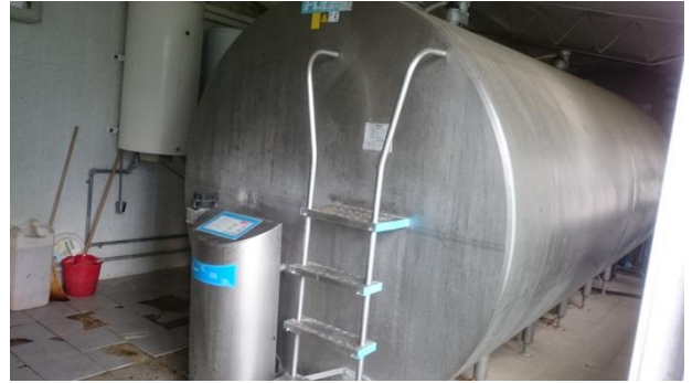
Slika 14. laktofriz