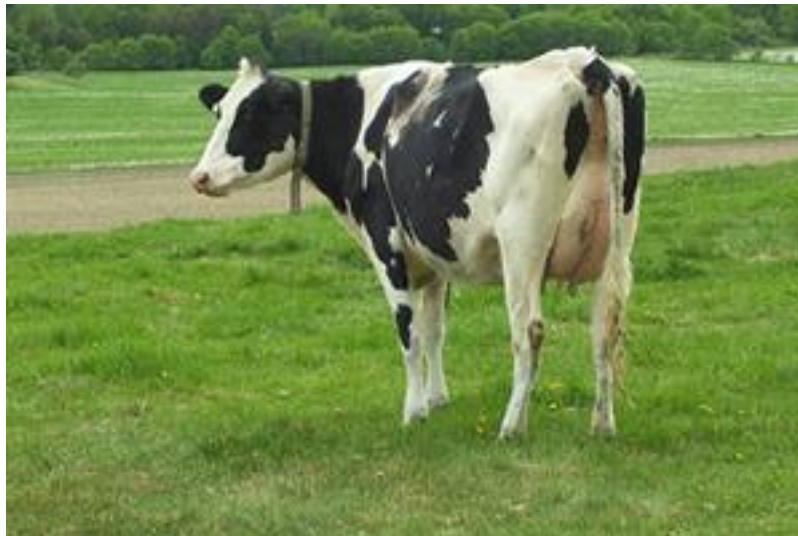
Slika 9. Holstein pasmina