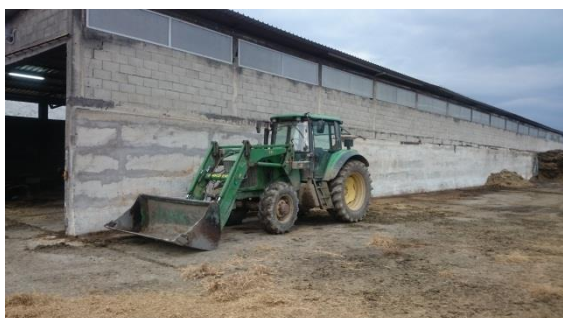
Slika 7. traktor John Deere utovarivač