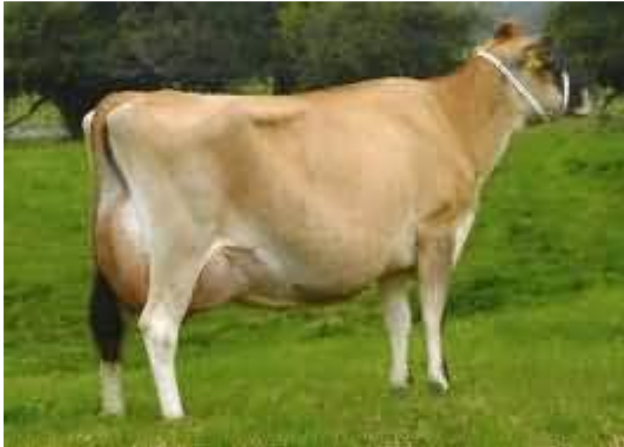
Slika 10. Jersey pasmina