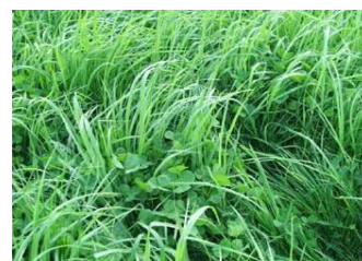
Slika 4. talijanski ljulj