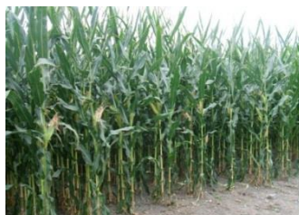
Slika 1. kukuruz