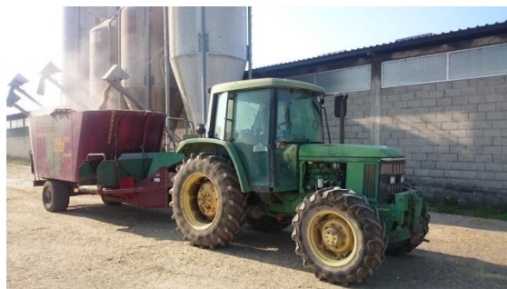
Slika 6. traktor John Deere s miksericom Verti mix Strautmann