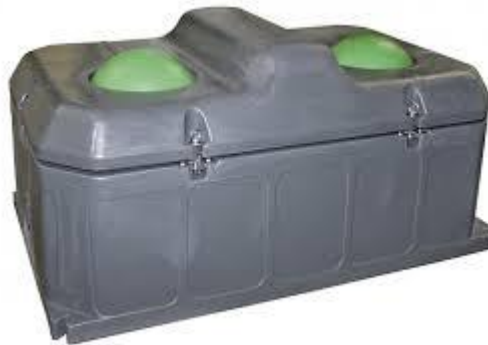
Slika 12. pojilica

U svakoj štali ugrađenje su 2 plastične pojilice koje imaju 2 otvora prekrivena kuglom. Funkcioniraju tako da krave dođu do pojilice i njuškom gurnu kuglu unutra da bi došle do vode. U pojilice je ugrađen plovak i kad voda padne do određenog nivoa ona se automatski sama počene puniti.