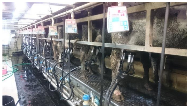
Slika 15. krave na mužnji