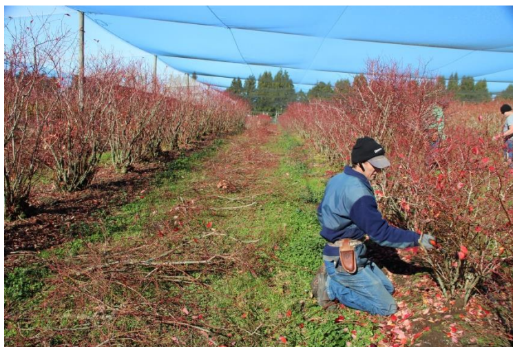
Slika 17. Rezidba odraslog grmlja

će grane od 7 godina starosti zamijeniti one starije koje su odrezane. Redovito obnavljanje grma orezivanjem omogućit će dugoročnu produktivnost borovnice (Slika 17.).