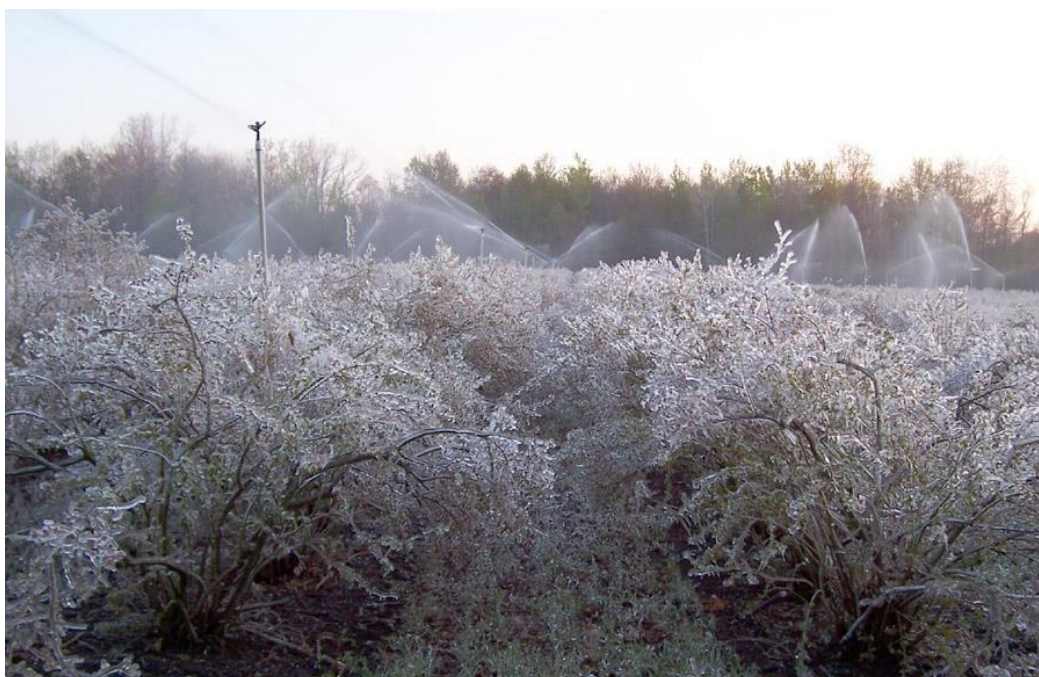
Slika 19. Zaštita od smrzavanja upotrebom prskalica

Prskalice bi trebali koristiti samo kada je temperatura u rasponu od 0 °C do -5 °C. Jedino u tom rasponu temperatura biljke možemo zaštititi od mraza prskanjem. Ako se temperatura spusti ispod predviđene, tada će šteta biti veća nego da nismo koristili prskalice. Ako se prognozira nepovoljna temperatura i jak vjetar, tada prskalice ne treba uključivati.