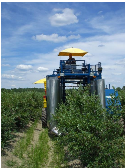
Slika 22. Strojna berba borovnice

Glavna prednost strojne berbe u odnosu na ručnu je znatna ušteda troškova i vremena. Ušteda troškova je od 30 % do 45 % u odnosu na ručnu berbu, a jedan stroj za branje borovnice može zamijeniti čak do 100 berača. Stroj kojim se beru borovnice prelazi preko grmova u redu i trese grmove (Slika 22.). Plod tako padne na uređaj za hvatanje bobica i transporter, kojim dalje odlazi do gajbica koje su poslagane na stroju.