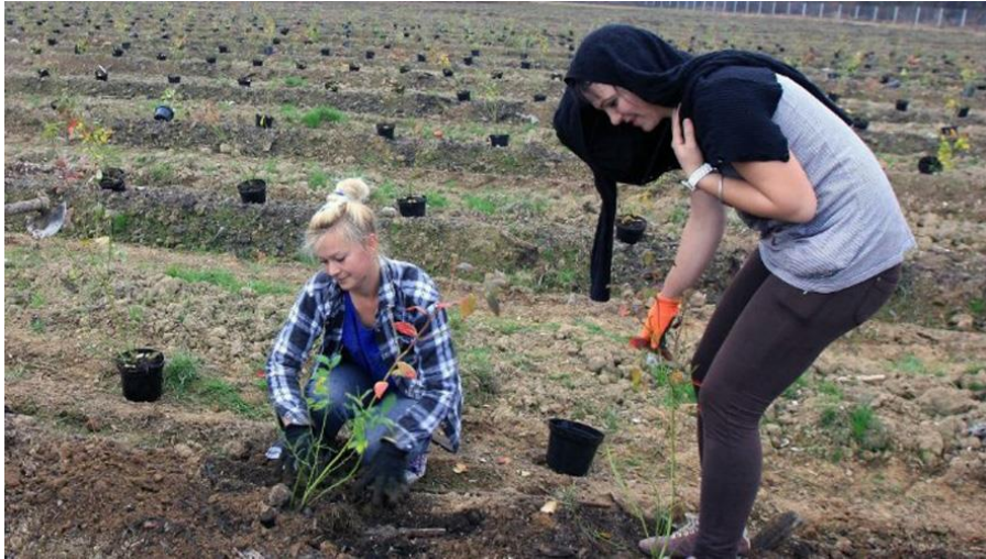
Slika 10. Sadnja borovnice