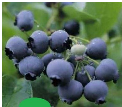
Slika 3. Bluecrop

Bluecrop – je srednje rana sorta. Ima visok prinos, bobice su srednje veličine, čvrste i dobrog su okusa (Slika 3.). Pogodne su za strojnu berbu. Grm je vrlo otporan na bolesti, sušu i niske temperature (do -25 °C). Ima odlične skladišne i transportne sposobnosti, stoga je opravdano vodeća sorta borovnice.