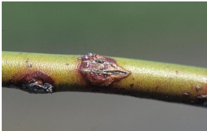
Slika 14. Rak stabljike borovnice - Botryosphaeria corticis

truleži bobica američkih borovnica je Switch WG, a koristi se 1 kg po hektaru toga pripravka. Tijekom sezone borovnicu tretiramo 3 puta, a karenca iznosi 10 dana. ( http://www.savjetodavna.hr )