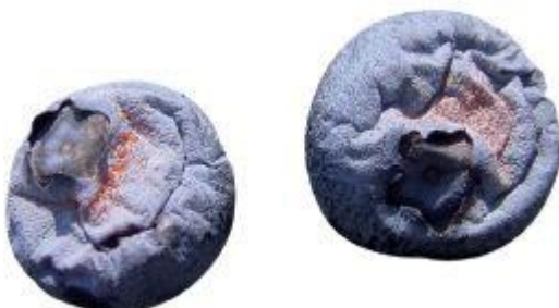
Slika 13. Antraknoza - Colletotrichum gleosporioides ( http://www.gospodarski.hr/Publication/2013/7/bolesti-borovnica-i-brusnica/7792#.V9krYfl96M8 )