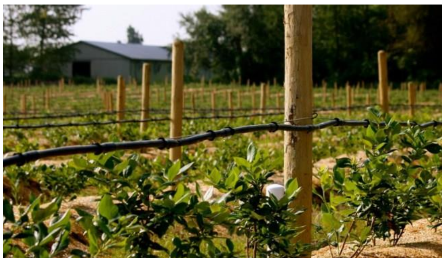
Slika 15. Navodnjavanje sistemom „kap po kap“ ( http://www.jainsusa.com/Growing+Blueberries )

Dovoljna opskrba borovnice vodom utječe na vegetativni rast, veličinu i kvalitetu ploda. Za maksimalan prinos osim padalina, potrebno je i dodatno navodnjavanje jer se kiša tijekom godine javlja neredovito. Najracionalnije je navodnjavanje sistemom „kap po kap“, jer se uz razmjerno mali utrošak vode osigurava ravnomjerno vlaženje zemljišta u nasadu borovnice (Slika 15.). Osobito su kritična sušna razdoblja tijekom godine. Na promjenu vlažnosti, posebno je osjetljiv korijen.