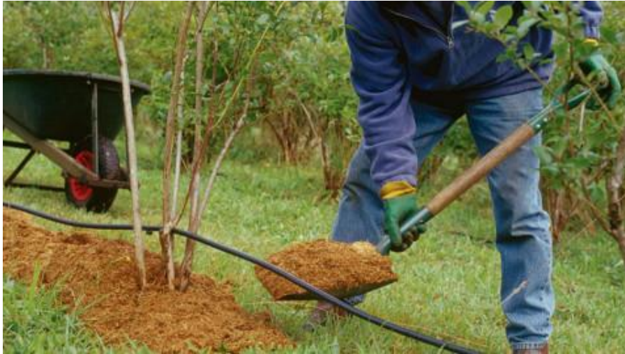
Slika 11. Posipanje malča

( http://ideas.homelife.com.au/media/article-steps/2/6/0/0/26057-1_asl.jpg? )