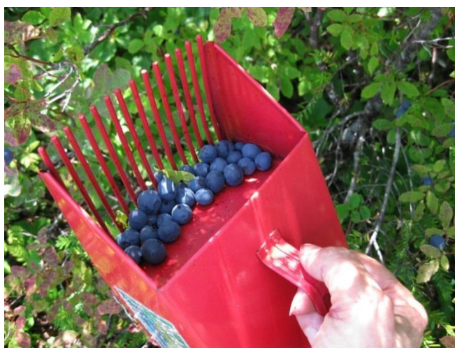
Slika 21. Ručna berba borovnice upotrebom češlja

Ubrane borovnice ne bi trebalo ostavljati na suncu. Tamne bobice lako apsorbiraju toplinu, a tople bobice lakše se kvare. Ako bobice beremo u kante, one ne bi smjele biti veće od 5 litara kako bi spriječili gnječenje.