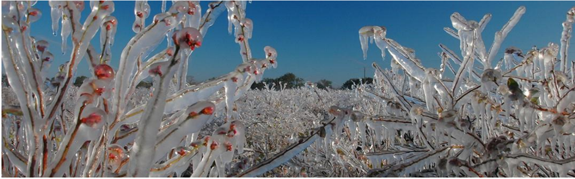
Slika 20. Pravilno funkcioniranje sustava

( http://blogs.ifas.ufl.edu/edis/2015/12/02/improving-the-precision-of-blueberry-frost-protection-irrigation/ )