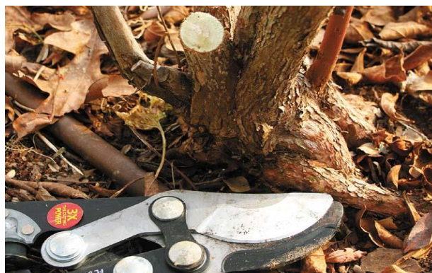
Slika 18. Podmlađivanje starog nasada

U starim i slabo održanim nasadima, neki uzgajivači režu sve grmove do razine tla, a berba započinje tri godine kasnije. Međutim, umjesto toga najbolje bi bilo grm prorijediti tako da ostavimo 6 – 10 najsnažnijih grana.