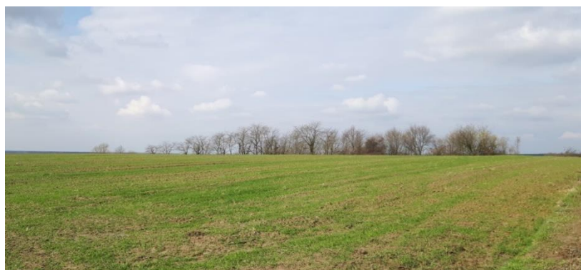
Slika 1. Zemljište odabrano za sadnju borovnice – Grabrov Potok

Kako bi povećali sadržaj organske tvari u tlu te potisnuli klijavost sjemena korova, sijemo predusjev. Predusjev može biti posijan u jesen ili proljeće prije sadnje. Osim zaoravanja predusjeva (npr. uljane repice, rauole, ječam i sl.) korisno je u tlo dodati treset ili kompost.