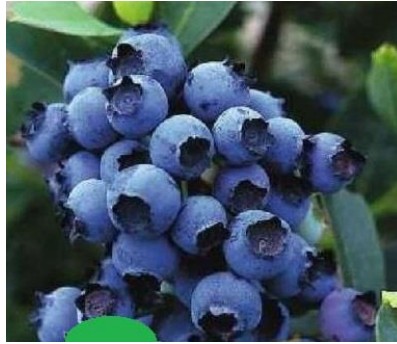
Slika 2. Bluetta

( http://www.limburgplant.nl/assortiment/fruit/VACBLUET )