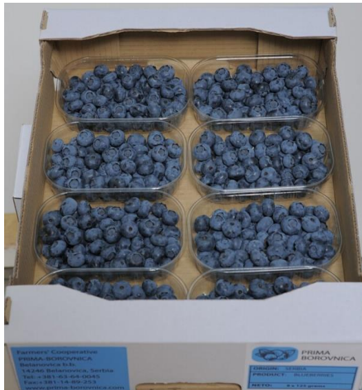
Slika 24. Posudice kapaciteta 125g ( http://prima-borovnica.com/ )

Borovnice pohranjene u takvu hladnjaču bez ventilacije koja širi hladan zrak, nekoliko sati prije isporuke neće se dovoljno ni ravnomjerno ohladiti, a prijevozna sredstva sa prostorom za hlađenje u tom slučaju neće biti od velike pomoći.