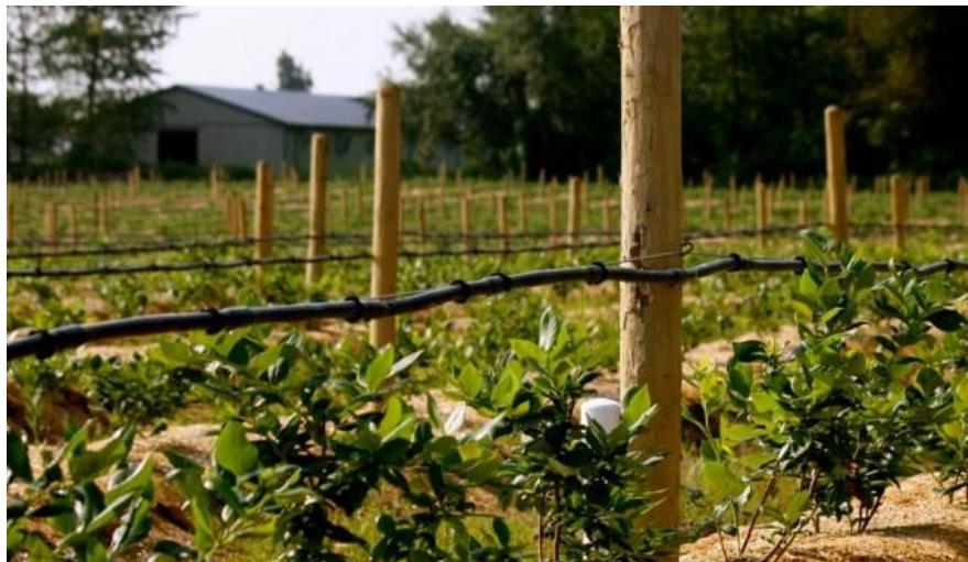
Slika 15. Navodnjavanje sistemom „kap po kap“ ( http://www.jainsusa.com/Growing+Blueberries )

Dovoljna opskrba borovnice vodom utječe na vegetativni rast, veličinu i kvalitetu ploda. Za maksimalan prinos osim padalina, potrebno je i dodatno navodnjavanje jer se kiša tijekom godine javlja neredovito. Najracionalnije je navodnjavanje sistemom „kap po kap“, jer se uz razmjerno mali utrošak vode osigurava ravnomjerno vlaženje zemljišta u nasadu borovnice (Slika 15.). Osobito su kritična sušna razdoblja tijekom godine. Na promjenu vlažnosti, posebno je osjetljiv korijen.