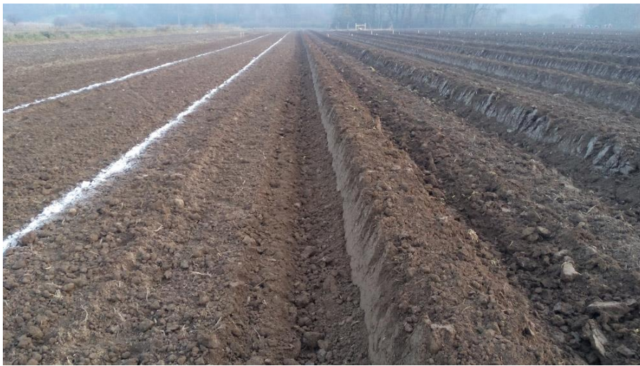
Slika 9. Izrada gredica

priprema tla. Ona se u novije vrijeme sadi na način da se otvore rovovi i u njih se nasipa treset (najčešće litvanski) koji se oblikuje u humak tako da se ocijede oborinske vode. Taj se humak prekrije sa slojem komposta od borovine koji je kiselijeg pH i potom se kompost pomalo razgrađuje i prihranjuje grm borovnice. Svake godine ili dvije dodaje se sloj novog komposta koji ujedno i služi kao malč za korove. Moguće je postaviti i foliju, ali tada korijen ostaje na površini te je više podložan stresu suše. Navedenom tehnologijom danas se borovnica sadi bilo gdje bez obzira na kvalitetu domicilnog tla.