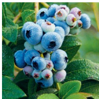
Slika 4. Blueray