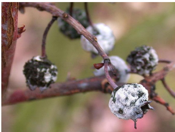
Slika 12. Siva pljesanj - Botrytis cinerea

Vrlo osjetljivo razdoblje rasta i razvoja američkih borovnica traje od otvaranja pupova, tijekom cvatnje do stadija zelenih razvijenih plodova. U ta dva mjeseca voda, hranjiva i temperatura imaju najveći izravan utjecaj na količinu i kakvoću godišnjeg uroda, a navedeni čimbenici određuju uravnoteženi rast i zdravstveno stanje borovnica.