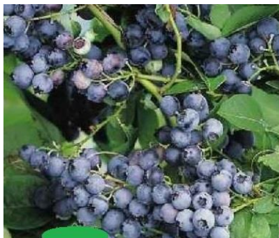
Slika 5. Berkley

Berkley - je srednje rana sorta koja daje svjetlo plave, čvrste i vrlo velike bobice (Slika 5.). Okus ploda je kiselkast i slabo izražene arome. Sorta je osjetljiva na zimske mrazeve. Grm je umjereno visok i raširen. Potrebno je orezivati grm kako bi sačuvao pogodan oblik. Otporna je na temperature do -25^{\circ}\text{C} . Ima vrlo dobru skladišnu sposobnost