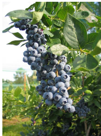
Slika 7. Duke

Duke - se smatra najboljom poznatom ranom sortom (Slika 7.). Kasnim cvatom izbjegava mrazeve i tako daje rani rod. Veličina ploda i kvaliteta je vrlo dobra, ali može izgubiti okus ako je prekasno ubran. Može se brati strojno. Tolerantnost na mraz i zimu je dobra. Otporna je na temperature do -25 °C.