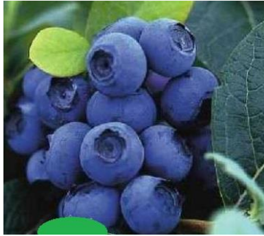
Slika 6. Spartan

( http://www.limburgplant.nl/assortiment/fruit/VACSPART )