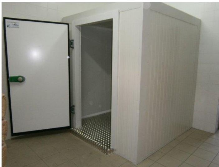
Slika 23. Hladnjača za skladištenje plodova borovnice

Poželjno bi bilo borovnice pohraniti u hladnjaču unutar 4 sata od berbe. To komplicira i poskupljuje transport, radi čestog prijevoza ubranih plodova do hladnjače, ali je isplativo zbog povećanja trajnosti i ukupne kvalitete plodova.