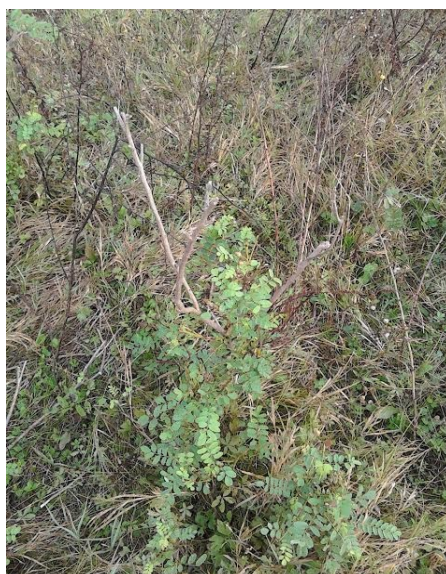
Slika 7: Amorfa ( amopha fruticosa )

Pašnjacima Gaje prijete opasnost od amorfe (čivitnjača), strane invazivne vrste koja uništava prirodnu floru pašnjačkih površina. Amorfa je agresivna biljka, kao medonosna, u Europu je iz Amerike unesena u 18. stoljeću, a krajem 1960-ih primjećena je i u Hrvatskoj. Nezaustavljivo se širi po svim zapuštenim površinama. Prekriva neobrađene oranice, travnjake, kanale uz ceste i pruge stvarajući neprohodnu šikaru isprepletenu granama visokim po tri-četiri metra. Zbog svoje visine i intenzivnog rasta pa sprečava pošumljavanje ili opstanak travnjaka.