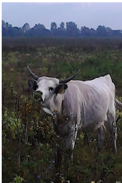
Slika 6: Podolac u ispaši na pašnjaku Gajna

U sklopu brojnih projekata, na Gajni su nabavljeni primjerci hrvatskih autohtonih pasmina: slavonsko-srijemsko podolsko govedo, crna slavonska svinja i posavski konj. Također se na Gajni mogu vidjeti hrvatski ovčari koji su nezaobilazni element ravničarskih područja.