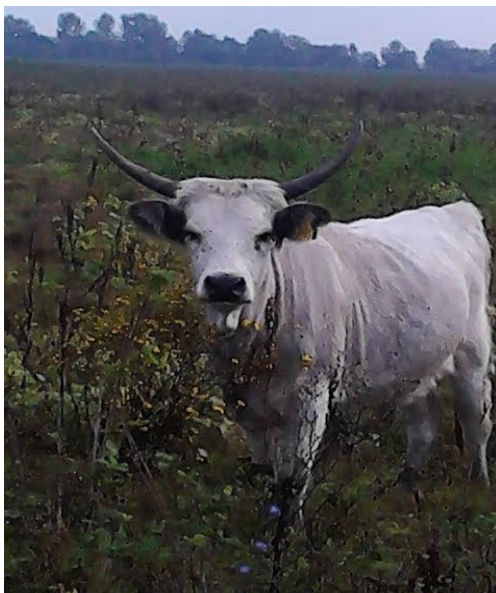
Slika 4: Krava s rogovima u obliku vila

Rogovi su glavna značajka ove pasmine, izrazite su duljine, često koso položeni s vrhovima koji strše na stranu, te velikim rasponom između vrhova, imaju oblik lire. Drugi tip rogova su rogovi postavljeni više okomito, a vrhovi povinuti unatrag pa takvi rogovi imaju oblik vila. Jedna trećina do dvije trećine rogova su tamno pigmentirani.