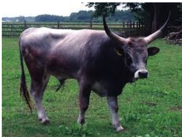
Slika 10: Bik slavonsko-srijemski podolac

Strateški cilj nacionalnog programa je očuvati i unaprijediti postojeću raznolikost zavičajnih udomaćenih pasmina životinja i sorti kultiviranih biljaka svim prikladnim metodama očuvanja.