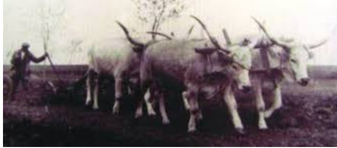
Slika 3: Obrada zemlje volovima slavonsko-srijemskog podolca