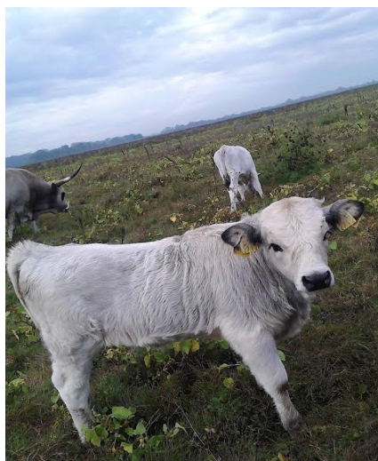
Slika 8: Tele Slavonsko-srijemskog podolca na pašnjaku Gajna

Većina grla njih četrdesetak je u vlasništvu BED-a, njih devet pripada Braniteljskoj udruzi Eko Gajna koja je osnovana zbog udruživanja s mještanima koji žele sačuvati autohtone pasmine i obnoviti pašnjak Gajna. Čuvar Šimo tako ima 17 grla podolaca, a još desetak grla pase u Poljancima, pa se njihov ukupan broj na Gajni od popeo na preko 70 grla. Oko dvije trećine goveda slavonsko-srijemskog podolca boravi na području Brodsko-posavske županije.