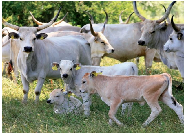
Slika 2: Krave i telad slavonsko.srijemskog podolca

„Prema zakonu o stočarstvu NN70/97, 36/98, 156/03, 132/06 : izvorne i zaštićene pasmine i sojevi domaćih životinja nastalih na teritoriju Republike Hrvatske predstavljaju dio nacionalne biološke baštine. Očuvanje i iskorištavanje pasmina i sojeva obavlja se prema posebnim programima za pojedine pasmine i sojeve. Zaštita izvornih pasmina i sojeva ostvaruje se držanjem potrebitog broja životinja za održavanje uzgoja i čuvanjem njihova genetskog materijala. Popis izvornih i zaštićenih pasmina i sojeva domaćih životinja te potrebiti broj grla određuje ministar.“ ( http://www.zakon.hr/z/707/Zakon-o-sto%C4%8Darstvu )