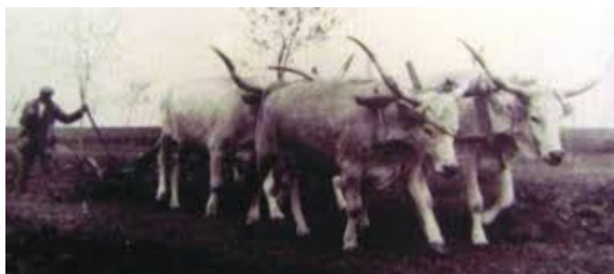
Slika 3: Obrada zemlje volovima slavonsko-srijemskog podolca