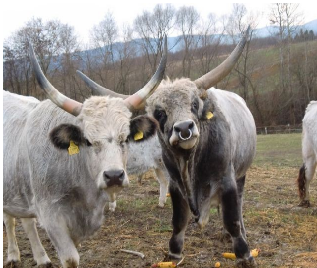
Slika 1. Stado slavonsko-srijemskog podolca

Izvorne i zaštićene pasmine su jedinstveno genetsko naslijeđe stvarano stotinama i tisućama godina, te kao takvo u određenoj mjeri neponovljivo. One pružaju sigurnost za održivu proizvodnju hrane u budućnosti. Zbog suživota sa podnebljem i čovjekom one su važna sastavnica genetskog i kurtuloškog nasljeđa. Izvorne i zaštićene pasmine domaćih životinja poticaj su oživljavanja dijela ruralnih područja, osiguravajući lokalnoj populaciji dodatni prihod. Autohtone pasmine pogodne su za korištenje i održavanje pašnjačkih površina, sprječavanje devastacije i sukcesije staništa, uključivanje u programe ekološke proizvodnje i razvijanje prepoznatljivih tradicionalnih robnih marki. Čine sastavni dio ekosustava o kojem ovise brojne druge biljne i životinjske vrste. Tijekom suživota s čovjekom postale su dio tradicijskog i običajnog nasljeđa.