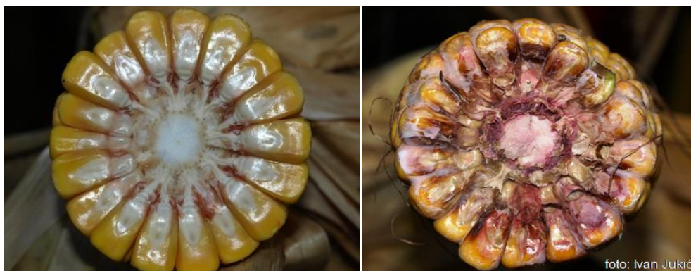
Slika 6. Presjek zdravog i fuzarioznim plijesnima zahvaćenog kukuruza