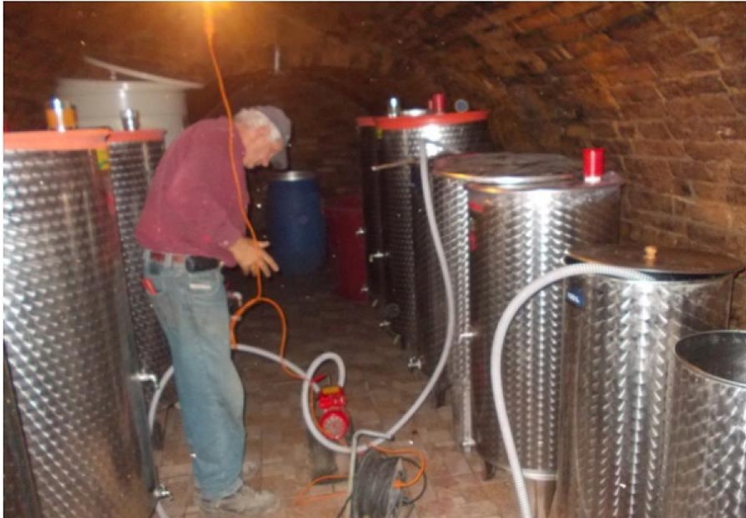
Slika 9. Pretakanje vina, izvor : ( http://agrotehnika-hrvatska.hr/podrum )