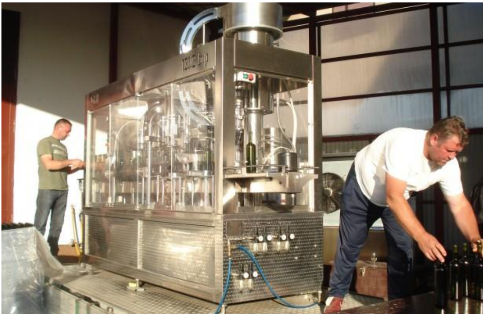
Slika 11. Punjenje vina u boce, izvor : ( http://www.soundset.hr/ )

Punjenje vina predstavlja završnu fazu, završetak svih postupaka s vinom (njege, dorade i stabilnosti vina) (Slika 11.). Vino koje se puni mora biti stabilno kako u boci ne bi stvaralo talog, iako spomenuli smo (vidi filtracija) da u posljednje vrijeme postoji jedna nova tendencija, koja tolerira određeni talog u boci, što je obično popraćeno i obrazloženo na kontra etiketi, a sve u cilju maksimalnog očuvanja kvalitete vina. Međutim to se sve odnosi na zrelija i odležanija vina, dok se vina koja idu relativno mlada na tržište, dorađuju i stabiliziraju (kako je i opisano) i pune u uvjetima maksimalne zaštite i sterilnosti. Vino u boci mora dugo vremena ostati isto ili dobivati na kvaliteti, pa je zato važno da se tijekom punjenja ne degradira, kao i da se u boci osiguraju uvjeti (SO 2 , O 2 i dr.) za kvalitetno čuvanje vina. Ovo se posebno odnosi na mlada bijela vina, koja su puno „osjetljivija“ i „zahtjevnija“ od crnih vina. Važno je nadalje odabrati pravo vrijeme punjenja.