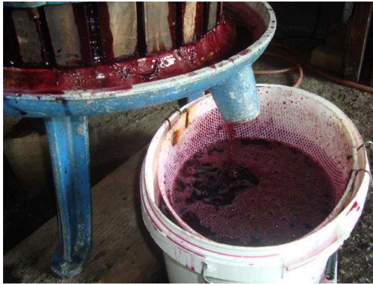
Slika 8. Prešanje masulja, izvor :( http://www.mojnet.com/korisnik/edo/slika/presanjemasulja )

Osim svojstava sorte (kultivara), kao i kakvoće grožđa, možemo reći: Tiještenje kao radnja proizvodnje mošta osnova je buduće kakvoće vina.