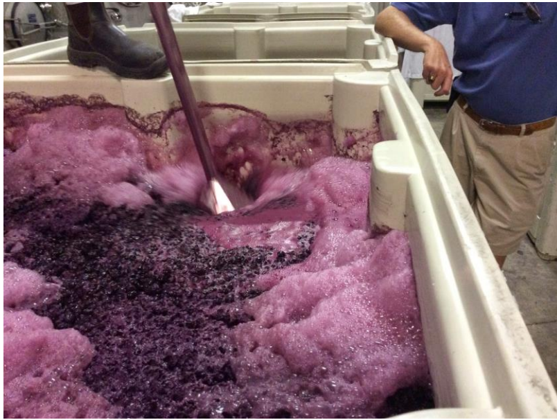
Slika 5. Aktivna fermentacija

Izmuljano grožđe - masulj - u kojem se sok pomiješan s kožicama i sjemenkama, sumpori se dodavanjem kalijeva metabisulfita 8 - 10 g/hl ili sumporaste kiseline 0,8 - 1,0 dl/hl. Sumporenje je neophodno jer je i boja crnih vina podložna oksidaciji, jače se izlučuje boja i uništavaju se octne bakterije. Nekoliko sati nakon sumporenja masulju se dodaje vinski kvasac. Vrenje masulja provodi se na nekoliko načina, odnosno, dva su osnovna postupka: hladni postupak i toplinski (Slika 6.). Toplinski se radi u većim vinarijama, dok se hladni provodi u vinarijama malih proizvođača. Taj postupak, odnosno vrenje, može se provoditi otvoreno - sa ili bez rešetke i zatvoreno - s rešetkom ili bez nje.