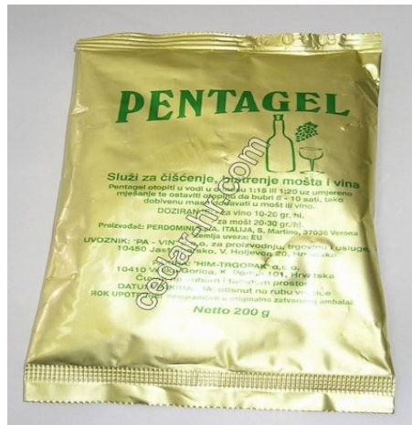
Slika 10. Petnagel, izvor : ( http://shop.cedar-agro.hr/catalog/product/view )