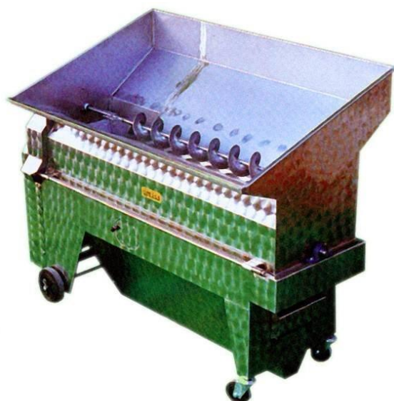
Slika 2. Muljača-ruljača