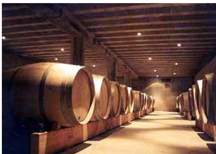
Slika 12. Skladištenje vina, izvor : ( http://poljoprivreda.info/?oid=5&id=395 )

Tipiziranje vina, jedna je od najvažnijih ali sigurno i najdelikatnijih radnji koje obavljamo u proizvodnji vina. Tipiziranjem (kupažom) možemo izvršiti određene korekcije vina (umjesto dodavanja kemijskih sredstava), kao npr. korekcije u pogledu ostatka šećera, kiselosti i dr.. Međutim tipiziranjem vina postizemo ili bar težimo postići jedan kontinuitet kvalitete, što je s aspekta potrošača jako važno (možda i najvažnije). Naime potrošači se naviknu na pojedini tip vina i očekuju da svaka boca (svake godine) bude ista ili približno ista. S druge strane proizvođač je uvjetovan berbom (dobra-loša, sušna-kišovita i dr.), propisima i dr., te je vrlo teško iz godine u godinu zadržati visoku kvalitetu vina. Zato pravi vinski znalci kupažom različitih serija vina postižu potrebnu harmoniju i kvalitetu vina. Doduše tipiziranje vina može se izvršiti i ranije, tijekom dorade ili njege vina, dakle prije same finalizacije, međutim u koliko se radi o vinima koja su narazličite načine njegovana (inox, drvo, na talogu i dr.) tada tipiziranje ide na kraju faze sazrijevanja, dakle neposredno prije punjenja u boce.