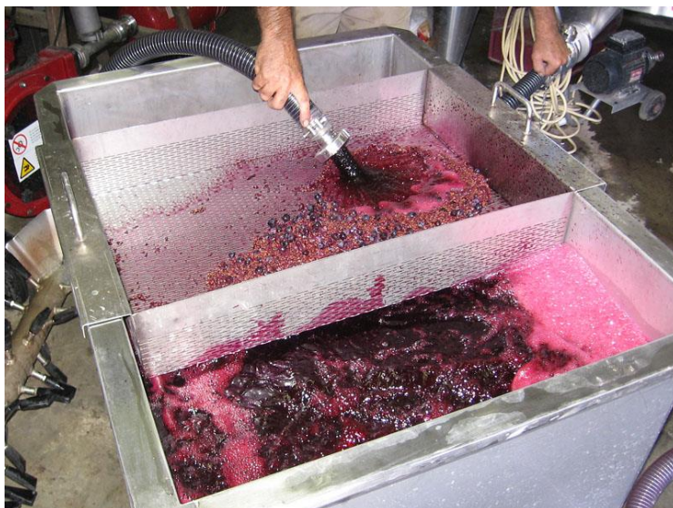
Slika 6. Fermentacija