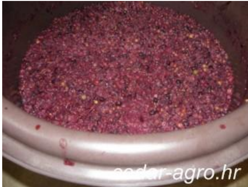
Slika 4. Maceracija i vrenje masulja, izvor : ( http://www.cedar-agro.hr/index. )