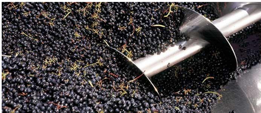
Slika 3. Muljanje grožđa