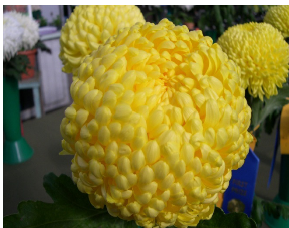
Slika 5. Žuta lopta “Shoeshmit“

“Golden Spider“ , 10 tjedni kultivar srednje brzog rasta(slika 6).