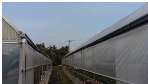
Slika 14. Rine na plastenicima za prikupljanje vode