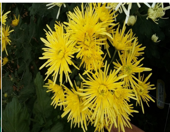
Slika 6. Žuta špina “Golden Spider“