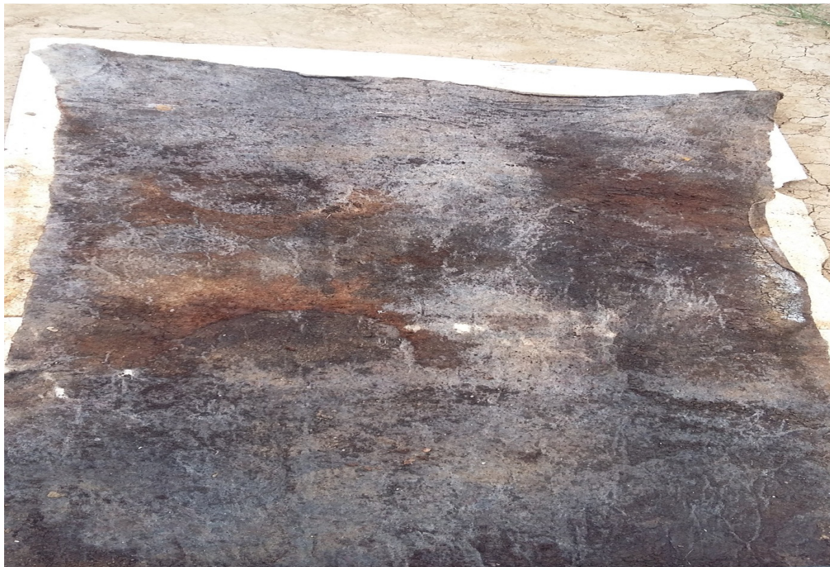
Slika 25. Postavljanje filca u red

Filc se postavljan na stiropor duž reda(slika 25), filc zadržava vlagu i štiti krizanteme u loncima od isušivanja i sprječava prodiranje korijena na stiropor.