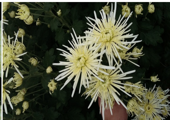
Slika 4.Bijela špina „White Spider“