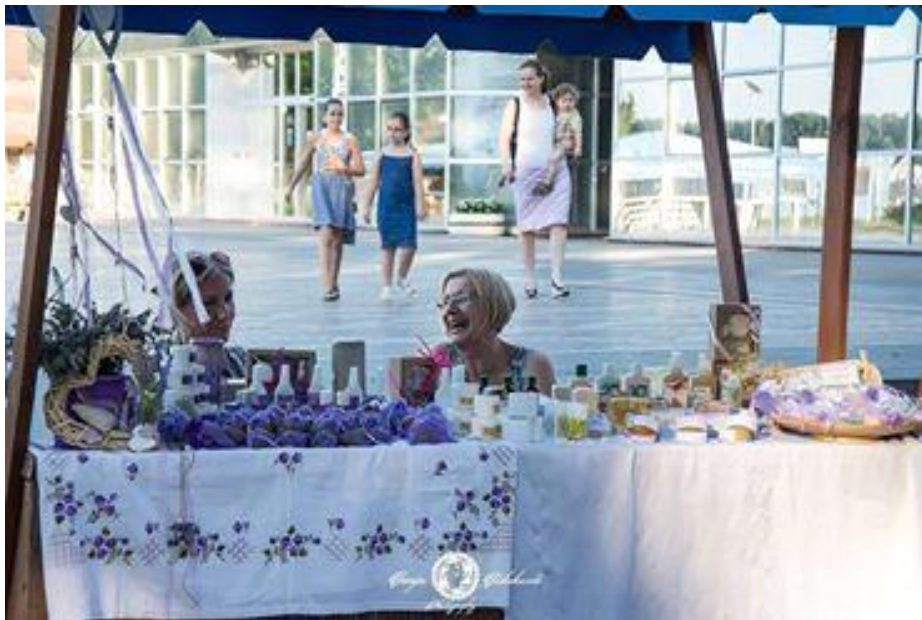
Slika 11. Događaj "Čekam te na korzu" u Vukovar