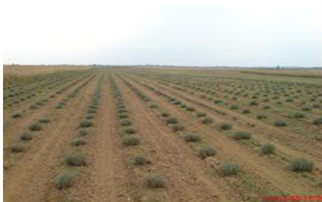
Slika 2. Lavanda godinu dana nakon sjetve