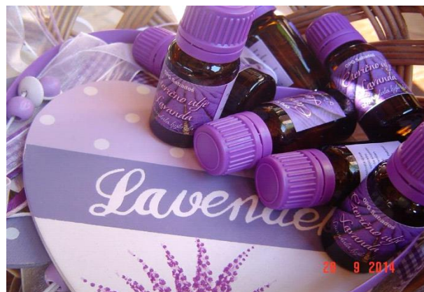
Slika 9. Ulja od lavande u pakiranju od 10 ml

Ulje ima također umirujuća svojstva, neke od "čudesnih" svojstava, osim umirujućeg djelovanja, su to da smanjuju probleme sa kožnim iritacijama, manjim opekotinama, opekotinama od sunca i . Također će pomoći kod ugriza kukaca i modrica te pomoći će tako i kod zacjeljenja te kod opuštanja napetih mišića.