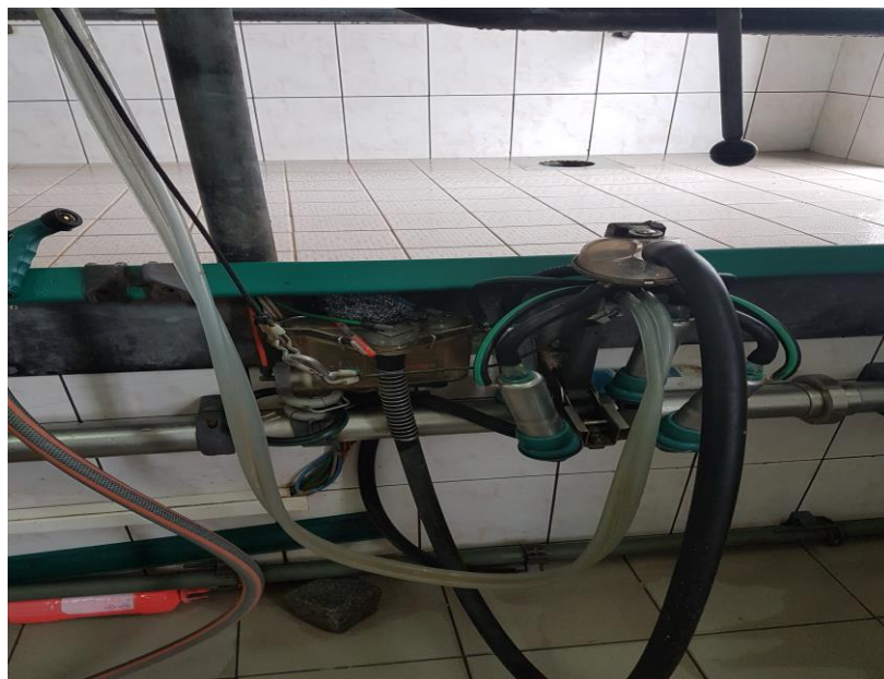
Slika 17. Prikaz sisaljki i sisnih guma