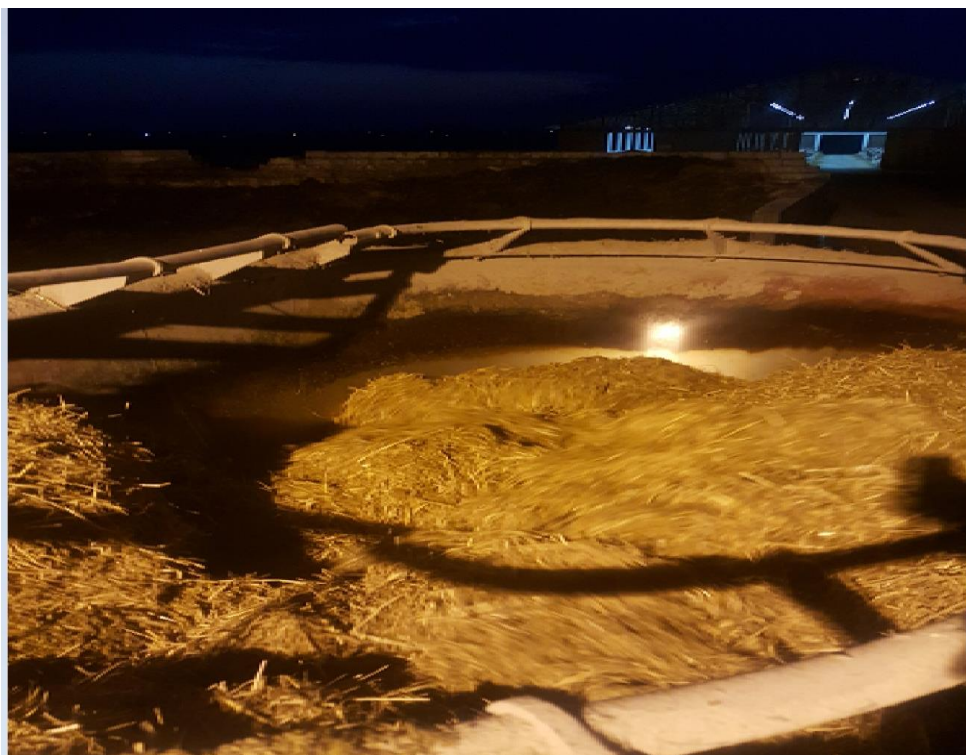
Slika 13. Prikaz rada mikser prikolice

Hranjenje se vrši mikser prikolicom koja je namijenjena za to a izvodi se dva puta dnevno. Prvo hranjenje počinje u 5 h a drugo u 17 h. ukupno dnevno se miješa oko 7,5t hrane. Većina krmiva koja se nalazi u obrocima za muzne krave, junice, bikove i telad je naša vlastita uzgojena na polju dok određene dodatke kupujemo kao što su suncokretova pogača, vitamini i minerali i sol. Sustav držanja stoke je slobodan pa se hrana raspodjeljuje na tzv. hranidbeni stol pa stoka sama dolazi jesti i kada je sita odlazi leći. Mikser prikolica pokreće se putem kardanskog vratila na traktoru koji ima snagu od 150 KS. Za pripremu jedne mikserice potrebno je oko 30 do 40 min od početka ubacivanja krmiva u nju pa do potpuno isjeckanog i pomiješanog obroka koji se raspodjeljuje životinjama.