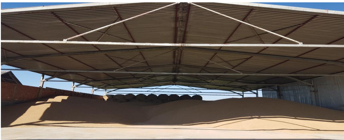
Slika 3. Prikaz skladišta žitarica