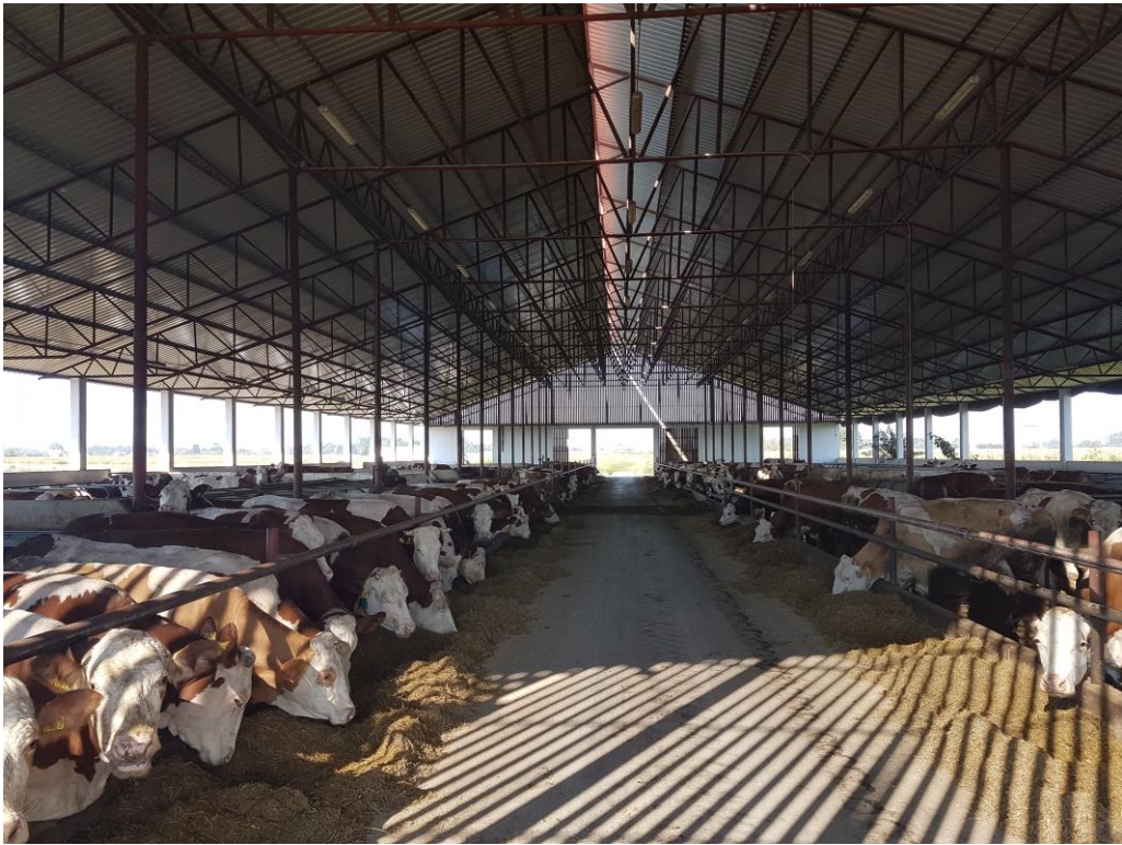
Slika 12. Prikaz simentalске farmе Bokun