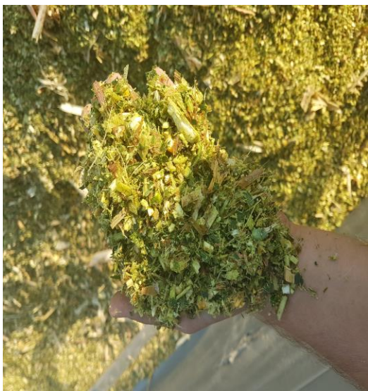
Slika 5. Prikaz silaže u toku siliranja

Silaža se odvija silo kombajnom koji kukuruznu stabljiku siječe na dužinu od 2 cm. Te se ista sprema u silo trapove, a mogu i u tzv. bagove. Silaža mora biti kvalitetno pripravljena i dobro uskladištena što znači da mora prilikom punjenja trapa biti dobro ugažena i mora biti istisnuti sav zrak kako ne bi došlo do kvarenja i razvoja plijesni. Kada se trap počne puniti treba održati kontinuitet do zatvaranja kako isto ne bi došlo do kvarenja, po završetku silaža se pokriva prvo podfolijom zatim silofolijom te se najlon pričvrsti vrećama ili gumama. Da bi se silaža mogla konzumirati treba proći oko 30-tak dana kako bi vrenje odradilo svoje tek tada silaža se normalno koristi u hranidbi goveda kao glavno kabasto krmivo u koje se dodaju dodaci. Na gospodarstvu Bokun siliramo oko 70 ha kako bi zadovoljili potrebe za silažom tokom cijele godine, a samo siliranje traje 10ak dana. Nastojimo što kvalitetnije pripremiti hranu kako bi se rezultati vidjeli na stočarskoj proizvodnji.