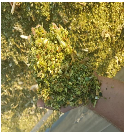
Slika 5. Prikaz silaže u toku siliranja

Silaža se odvija silo kombajnom koji kukuruznu stabljiku siječe na dužinu od 2 cm. Te se ista sprema u silo trapove, a mogu i u tzv. bagove. Silaža mora biti kvalitetno pripravljena i dobro uskladištena što znači da mora prilikom punjenja trapa biti dobro ugažena i mora biti istisnuti sav zrak kako ne bi došlo do kvarenja i razvoja plijesni. Kada se trap počne puniti treba održati kontinuitet do zatvaranja kako isto ne bi došlo do kvarenja, po završetku silaža se pokriva prvo podfolijom zatim silofolijom te se najlon pričvrsti vrećama ili gumama. Da bi se silaža mogla konzumirati treba proći oko 30-tak dana kako bi vrenje odradilo svoje tek tada silaža se normalno koristi u hranidbi goveda kao glavno kabasto krmivo u koje se dodaju dodaci. Na gospodarstvu Bokun siliramo oko 70 ha kako bi zadovoljili potrebe za silažom tokom cijele godine, a samo siliranje traje 10ak dana. Nastojimo što kvalitetnije pripremiti hranu kako bi se rezultati vidjeli na stočarskoj proizvodnji.