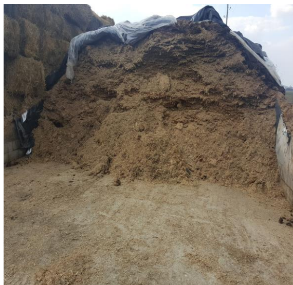
Slika 6. Prikaz silaže koja se koristi u hranidbi