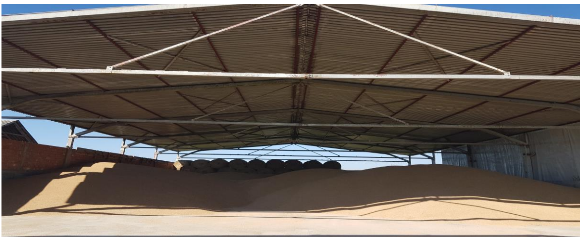
Slika 3. Prikaz skladišta žitarica