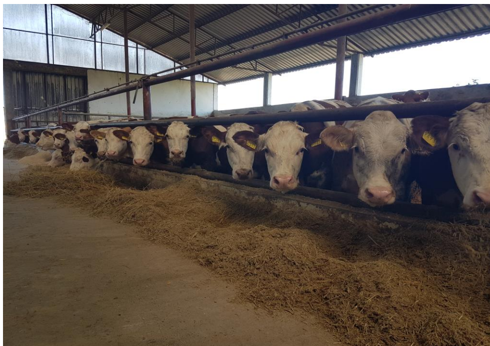
Slika 14. Prikaz servirane hrane