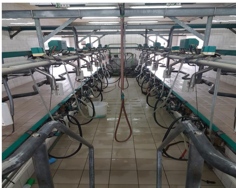
Slika 15. Prikaz izmuzišta riblja kost 2x8

Da bi se sintetizirala litra mlijeka kroz krvožilni sustav vimena mora proteći od 400-500 litara krvi. Primarni značaj za laktaciju krava ima hormon zadnjeg režnja hipofize – oksitocin. Funkcija oksitocina se veže za mehanizme i istiskivanja mlijeka, tj. pražnjenja vimena pri mužnji i sisanju. Mužnja se može vršiti ručno i strojno. Na gospodarstvu Bokun zastupljeno je posebno montirano izmuzište. Izmuzište se sastoji od vakum pumpe, cjevovoda za vakum, pulsatora, sisaljki, posude za mlijeko, cjevovoda za mlijeko, mliječne pumpe, čelične konstrukcije, laktofriza, sustav za pranje sistema mužnje, kompjuteri koji nadziru proces mužnje. Sustav izmuzišta koji je zastupljen na gospodarstvu je kapaciteta 16 krava, riblja kost 2x8. Sam sustav je odvojen od farme i ima zasebnu zgradu u kojoj je smješteno izmuzište, strojarnica te čekalište za krave koje čekaju mužnju. Higijena izmuzišta mora biti na najvišem nivou kako ne bi došlo do povećanja somatskih stanica, upali vimena i sl. a samim time i pada proizvodnje ali i kvalitete mlijeka. Mlijeko po izlazu iz sise nema nikakav kontakt sa zrakom kako ne bi došlo do toga da mlijeko ima miris po staji, pazi se na svaki detalj. Kako bi higijena bila zadovoljena topla voda je broj jedan u tome, jednostavno rečeno bez tople vode nema higijene u izmuzištu i muznom sistemu.