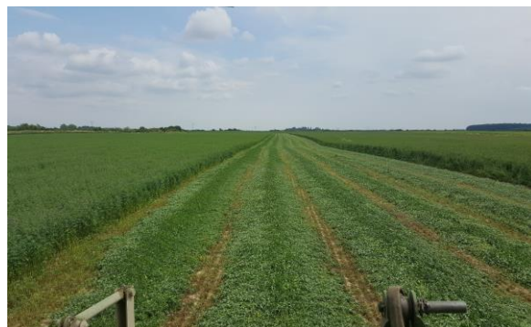
Slika10. Prikaz košnje lucerne