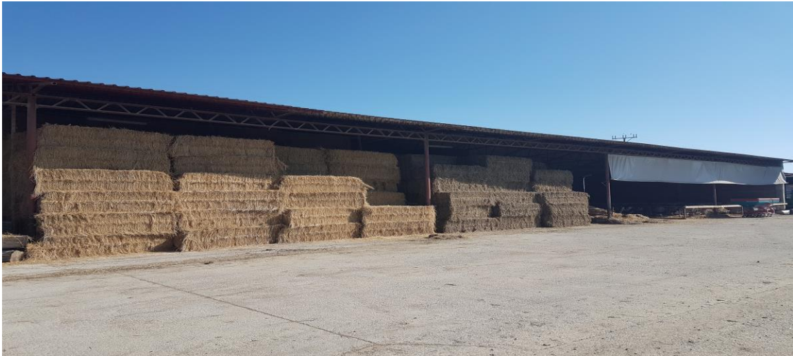
Slika 2. Prikaz skladišta lucerne

sklopu gospodarstva sto se tiče gospodarskih objekata nalaze se dvije farme te teličnjak i nekoliko spremišta za hranu. Jedna farma a ujedno i ona starija je na principu kose deke i u kojoj je moguć različit uzgoj od krava pa sve do teladi. Kod toga objekta karakterizira ga kruti stajski gnoj koji je pomiješan sa steljom. Farma koja je kasnije građena rađena je na principu liga boksova gdje svaka krava ima mjesto za leći a ujedno se i slobodno kreću, moja je kapaciteta 300 UG a nju karakterizira tekući stajski gnoj tj. gnojovka.