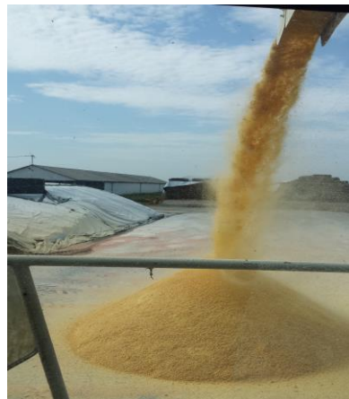
Slika 8. Prikaz siliranja VVK