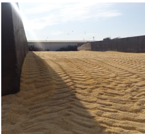
Slika 7. Prikaz VVK u trenč silosu

Visoko vlažno zrno također služi kao energetska krmivo a priprema se na način da se kukuruzno zrno vrši sa 30- 35 % vlage te putem mlina čekićara ili silokombajna koji na sebi ima ugrađen konkrek koji vlažno zrno drobe te ga spremamo u silo trapove poput silaže, on isto mora biti dobro ugažen i konzerviran kako ne bi došlo do kvarenja, VVK koji još nazivamo i kiseli šrot na Opg-u koristimo u tovu junadi kao dodatak silaži, vrlo je zahvalno krmivo jer daje dobre rezultate a i lagano je čuvanje u odnosu na suho zrno gdje može doći do kvarenja, skladišnih štetnika i slično.