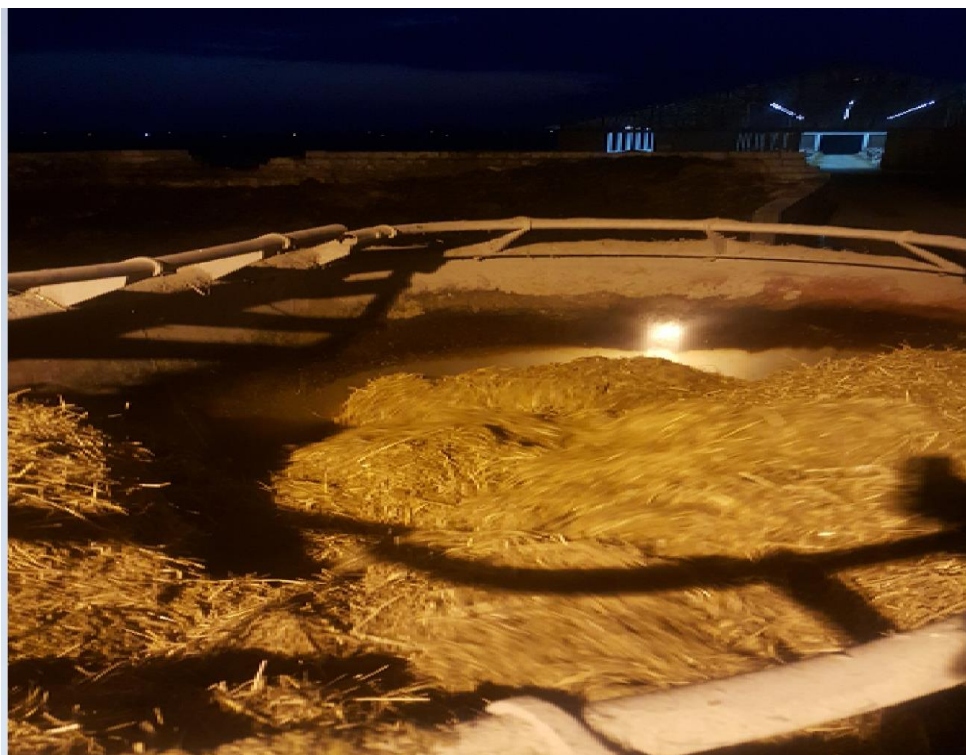
Slika 13. Prikaz rada mikser prikolice

Hranjenje se vrši mikser prikolicom koja je namijenjena za to a izvodi se dva puta dnevno. Prvo hranjenje počinje u 5 h a drugo u 17 h. ukupno dnevno se miješa oko 7,5t hrane. Većina krmiva koja se nalazi u obrocima za muzne krave, junice, bikove i telad je naša vlastita uzgojena na polju dok određene dodatke kupujemo kao što su suncokretova pogača, vitamini i minerali i sol. Sustav držanja stoke je slobodan pa se hrana raspodjeljuje na tzv. hranidbeni stol pa stoka sama dolazi jesti i kada je sita odlazi leći. Mikser prikolica pokreće se putem kardanskog vratila na traktoru koji ima snagu od 150 KS. Za pripremu jedne mikserice potrebno je oko 30 do 40 min od početka ubacivanja krmiva u nju pa do potpuno isjeckanog i pomiješanog obroka koji se raspodjeljuje životinjama.