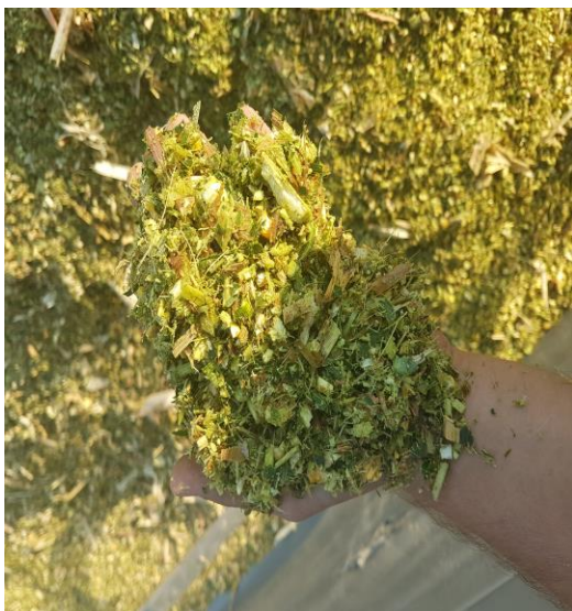
Slika 5. Prikaz silaže u toku siliranja

Silaža se odvija silo kombajnom koji kukuruznu stabljiku siječe na dužinu od 2 cm. Te se ista sprema u silo trapove, a mogu i u tzv. bagove. Silaža mora biti kvalitetno pripravljena i dobro uskladištena što znači da mora prilikom punjenja trapa biti dobro ugažena i mora biti istisnuti sav zrak kako ne bi došlo do kvarenja i razvoja plijesni. Kada se trap počne puniti treba održati kontinuitet do zatvaranja kako isto ne bi došlo do kvarenja, po završetku silaža se pokriva prvo podfolijom zatim silofolijom te se najlon pričvrsti vrećama ili gumama. Da bi se silaža mogla konzumirati treba proći oko 30-tak dana kako bi vrenje odradilo svoje tek tada silaža se normalno koristi u hranidbi goveda kao glavno kabasto krmivo u koje se dodaju dodaci. Na gospodarstvu Bokun siliramo oko 70 ha kako bi zadovoljili potrebe za silažom tokom cijele godine, a samo siliranje traje 10ak dana. Nastojimo što kvalitetnije pripremiti hranu kako bi se rezultati vidjeli na stočarskoj proizvodnji.