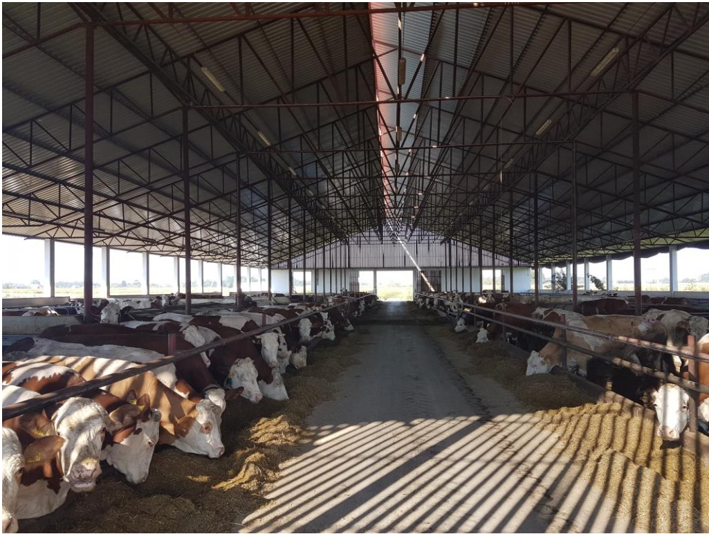
Slika 12. Prikaz simentalске farmе Bokun