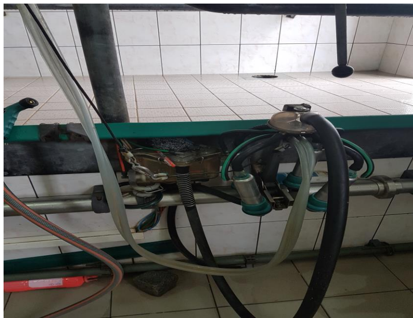
Slika 17. Prikaz sisaljki i sisnih guma