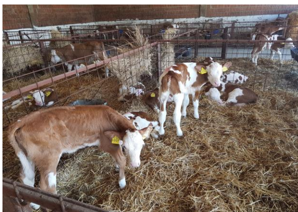
Slika 11. Prikaz simentalske teladi

To je najpoznatija kombinirana pasmina a namijenjena je za proizvodnju mlijeka i mesa. U Hrvatsku je ova pasmina uvezena krajem 19 st. U okolicu Križevaca, Bjelovara, Đurđevca. Pretežito je crvene boje s bijelim plohama, bijele glave i repa. Životinja je snažnije konstitucije pa samim time joj je i olakšanja prilagodba za život i u nizinskim predjelima ali i u brežuljkastim. Tjelesna masa krava iznosi oko 600 – 750 kg a visoke su od 135 – 145 cm. Prvi puta u pripust ide sa 16 mj. Dok se teli s 25 mj. a porodna masa teladi iznosi oko 40 – 45 kg. Laktacija joj traje oko 305 dana i u doba dojenja daje vrlo kvalitetno mlijeko s 3,6% proteina i 4,6% mliječne masti. Ova pasmina je vrlo zahvalna i u tovu jer daje vrlo kvalitetnu telad i genetski dobru predispoziciju za tov kod muškog podmlatka. Dnevni prirasti mlade junadi do 450 kg iznosi 1,2- 1,3 kg,