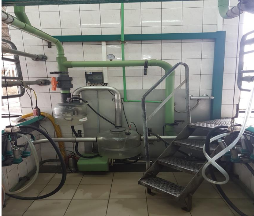
Slika 16. Prikaz glavne mliječne posude i pumpe