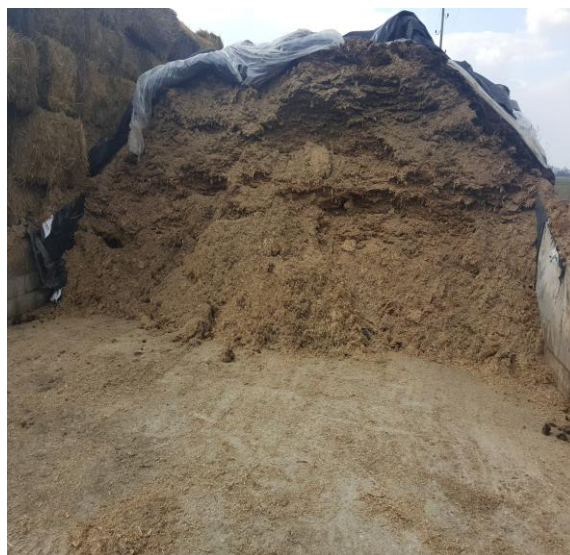
Slika 6. Prikaz silaže koja se koristi u hranidbi