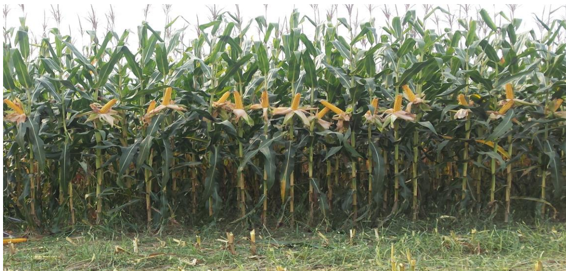
Slika 4. Prikaz kukuruza za silažu

Kukuruz kao hrana za stoku je energetska krmivo a hrane se u suhom ili siliranom obliku. Kukuruz kao biljka je vrlo osjetljiv na mraz i nedostatak vode. Minimalna temperatura pa početak rasta iznosi oko 8 do 10 °C. U slučaju da se mraz pojavi kada kukuruz ima više od 6 listova dolazi do uništenja usjeva. Najviše mu pogoduju plodna i duboka tla koja zadržavaju veću količinu vode.