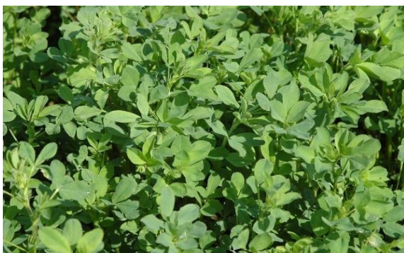
Slika 9. Lucerna

Lucernu imamo zasijanu na 65 ha i namjeravamo povećati do 80 ha. Lucerna je izvrsno proteinsko krmivo a ujedno i voluminozno. Lucernu spremamo na dva načina a to su siliranje i sušenje u sijeno, većinom prvi otkos u godini pravimo sijenažu dok ostale sušimo i prešamo u kvadrant bale. Sjetva se može izvoditi u jesen i u proljeće ali preporučljivo je u jesen ukoliko uvjeti dozvoljavaju jer u proljeće već dobivamo dobar prvi otkos dok u slučaju proljetne sjetve prvi otkos dolazi kasnije te možemo reći da i gubimo jedan otkos.