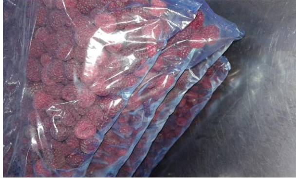
Slika 11. Zamrznuta malina