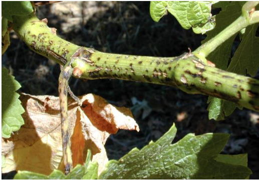
Slika 5: Crna pjegavost na zelenim mladicama

rozgve, a moguće je da bude zahvaćena i cijela rozgva. Tu promjenu boje rozgve uzrokuje micelij gljive koji se razvija ispod kore. Na površini izbjeljenje kore u proljeće se formiraju crne točkice – piknide. Piknidi su lako vidljivi golim okom ( www.vinogradarstvo.com , 2016.).