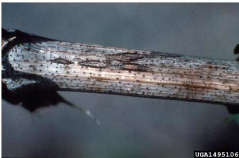
Slika 7: Izbjeljena kora s vidljivim točkicama piknidima