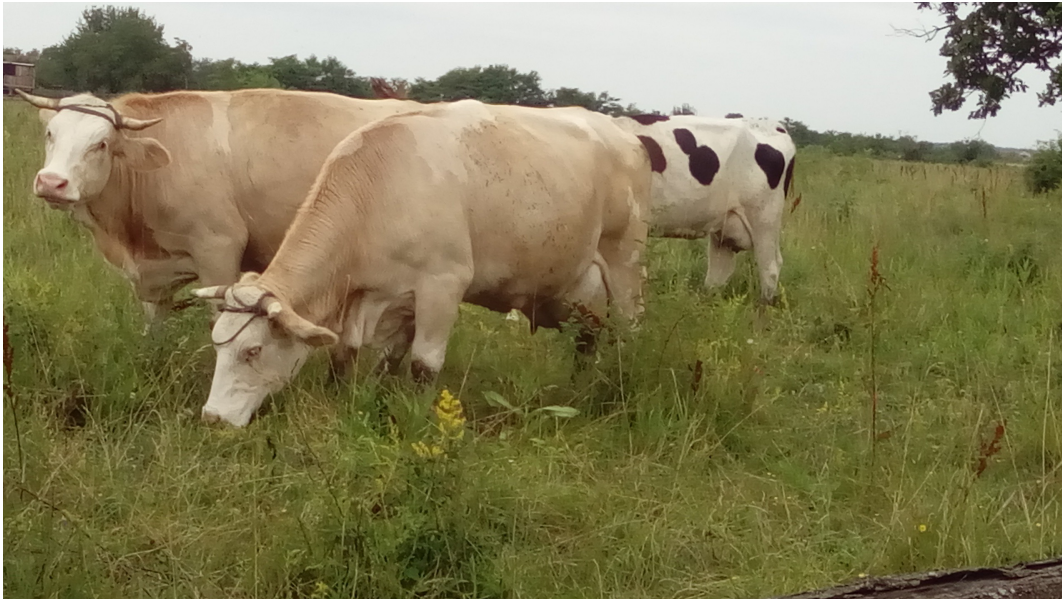
Slika 3.: Tehnološki zastario način žetve voluminozne krme?

Na račun ekonomičnosti suvremenih požnjevenih voluminoznih krmiva (engl. „harvested forages“, u SAD-u je objavljena i karikatura (Slika 4., www.onpasture.com ).