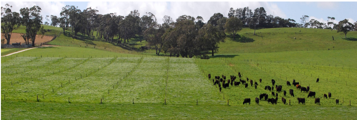
Slika 2. Pašnjak podijeljen na pregone. Goveda uvijek dolaze na mladi porast trava.

Redovito je potrebno provoditi inventuru pašnjaka: koje vrste trava, djetelina i korova su zastupljene, koliko je dobra pokrivenost tla tratinom, kolika je biljna masa na pojedinim dijelovima pašnjaka, u kakvom su stanju ograde, gdje je smješteno pojilo i izvori vode za napajanje itd. Iz ukupnih pašnjačkih površina potrebno je izdvojiti jednu manju „žrtvovanu zonu“ za držanje životinja tijekom razdoblja kada je tlo mokro (da se izbjegne kvarenje strukture tla gaženjem) i kada je porast tratine minimalan (druga polovica ljeta i zima, da se izbjegne oštećivanje tratine preniskim i preučestalim odgrizanjem uslijed nedostatka krme). Ova zona može zapravo biti površina tzv. „ispusta“, koja je uobičajeno smještena uz staje pri stajskom držanju životinja koje se hrane konzerviranim krmivima. Napasivanje na travi niže od 7 cm uzrokuje stres za same biljke kroz smanjenje lisne površine, koja je