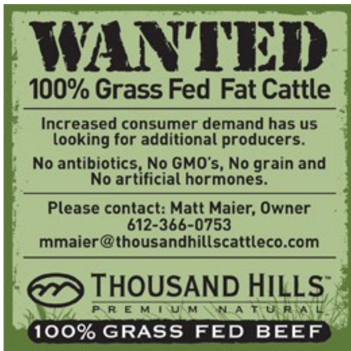
Slika 5. Oglas za govedinu proizvedenu na ispaši. (izvor: www.onpasture.com )

35% višu cijenu za mlijeko i meso s ispaše u odnosu na iste proizvode stajski držanih i TMR-om hranjenih životinja.