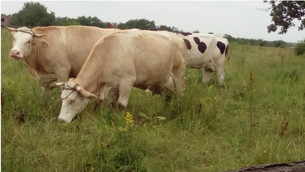
Slika 3.: Tehnološki zastario način žetve voluminozne krme?

Na račun ekonomičnosti suvremenih požnjevenih voluminoznih krmiva (engl. „harvested forages“, u SAD-u je objavljena i karikatura (Slika 4., www.onpasture.com ).