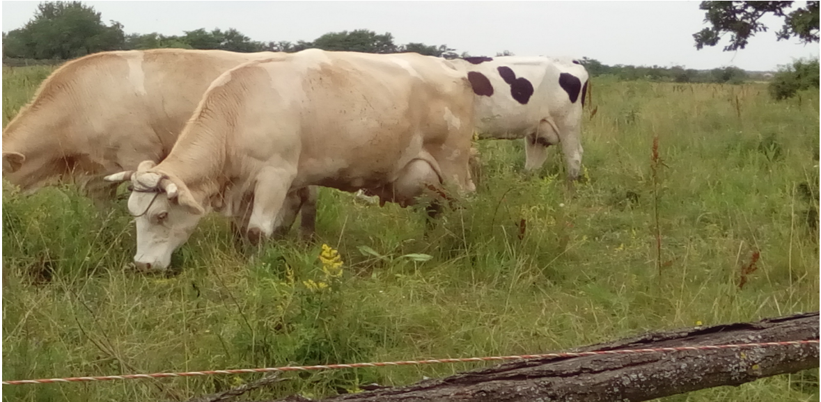
Slika 1. Prerasla biljna masa na pašnjaku s prisutnim korovima. Jelisavac