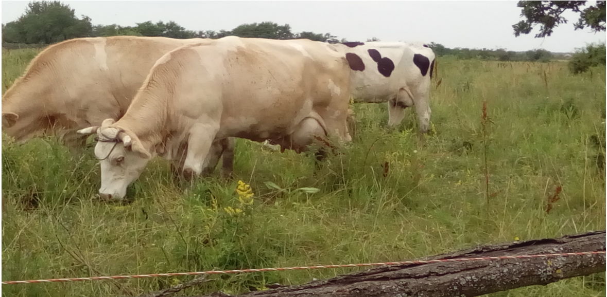
Slika 1. Prerasla biljna masa na pašnjaku s prisutnim korovima. Jelisavac