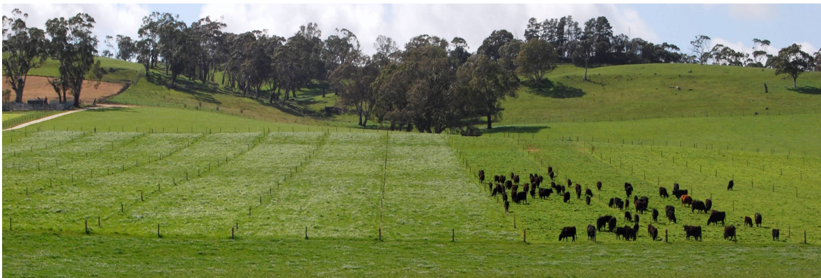
Slika 2. Pašnjak podijeljen na pregone. Goveda uvijek dolaze na mladi porast trava.

Redovito je potrebno provoditi inventuru pašnjaka: koje vrste trava, djetelina i korova su zastupljene, koliko je dobra pokrivenost tla tratinom, kolika je biljna masa na pojedinim dijelovima pašnjaka, u kakvom su stanju ograde, gdje je smješteno pojilo i izvori vode za napajanje itd. Iz ukupnih pašnjačkih površina potrebno je izdvojiti jednu manju „žrtvovanu zonu“ za držanje životinja tijekom razdoblja kada je tlo mokro (da se izbjegne kvarenje strukture tla gaženjem) i kada je porast tratine minimalan (druga polovica ljeta i zima, da se izbjegne oštećivanje tratine preniskim i preučestalim odgrizanjem uslijed nedostatka krme). Ova zona može zapravo biti površina tzv. „ispusta“, koja je uobičajeno smještena uz staje pri stajskom držanju životinja koje se hrane konzerviranim krmivima. Napasivanje na travi niže od 7 cm uzrokuje stres za same biljke kroz smanjenje lisne površine, koja je